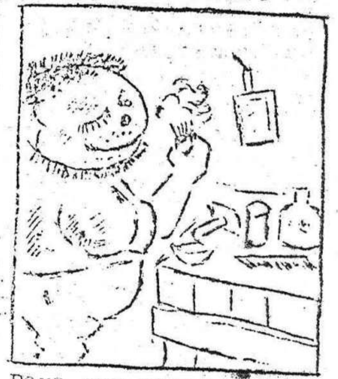
3 Para ser reconocido brocha y jabon ha pedido

Los motores gruñen con escándalo, como si cantasen también la victoria del día. Un oficial se lo dice al conductor de primero, entre el retumbar de las corzas de hierro: - "Ahora, a reponer; no queda ni un disparo." Es la segunda salida del día. Y aun quedan muchas horas de sol y de luz para volver al combate.