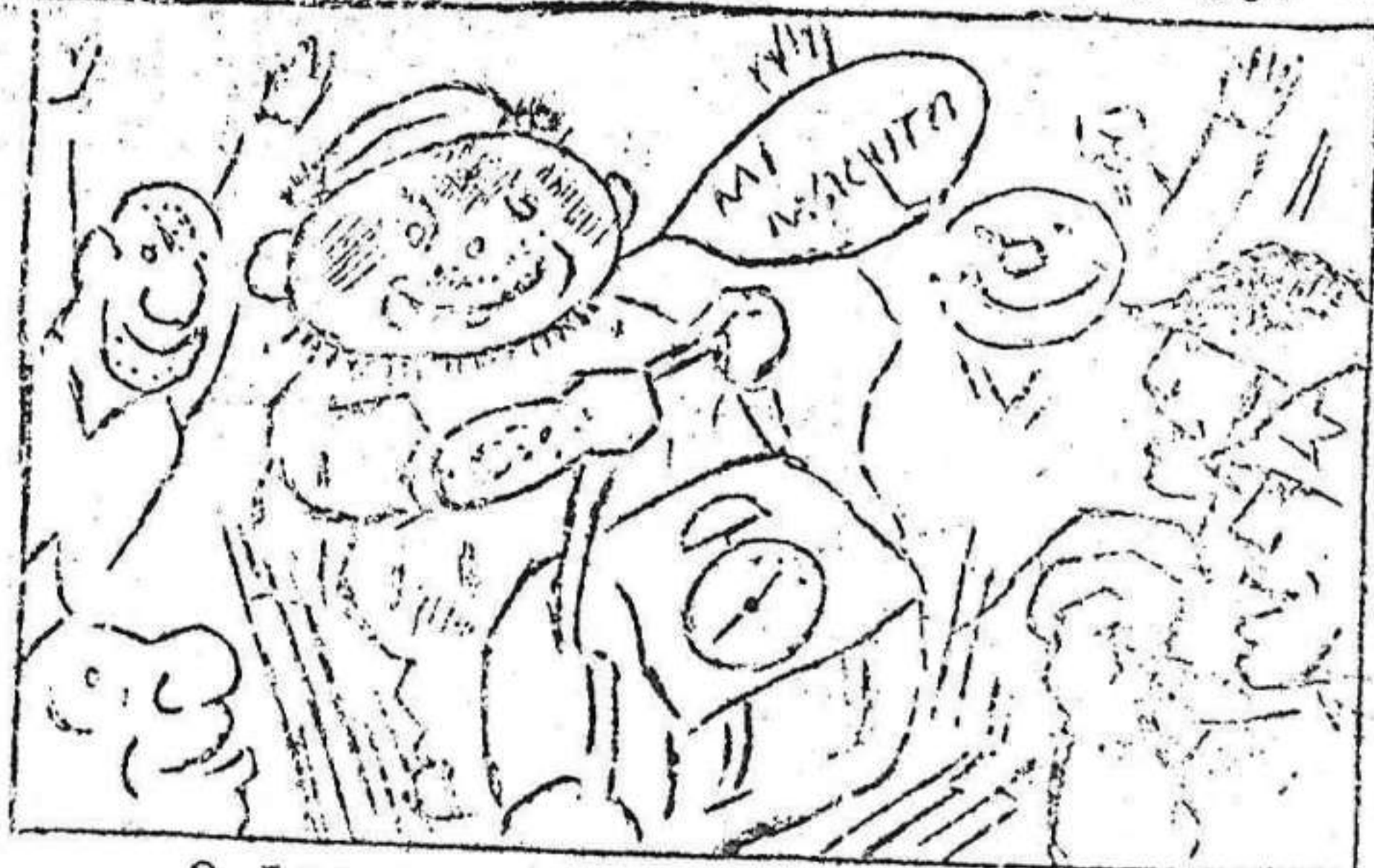
2. Los nuestros dicen a coro ¿ de donde sale este moro ?