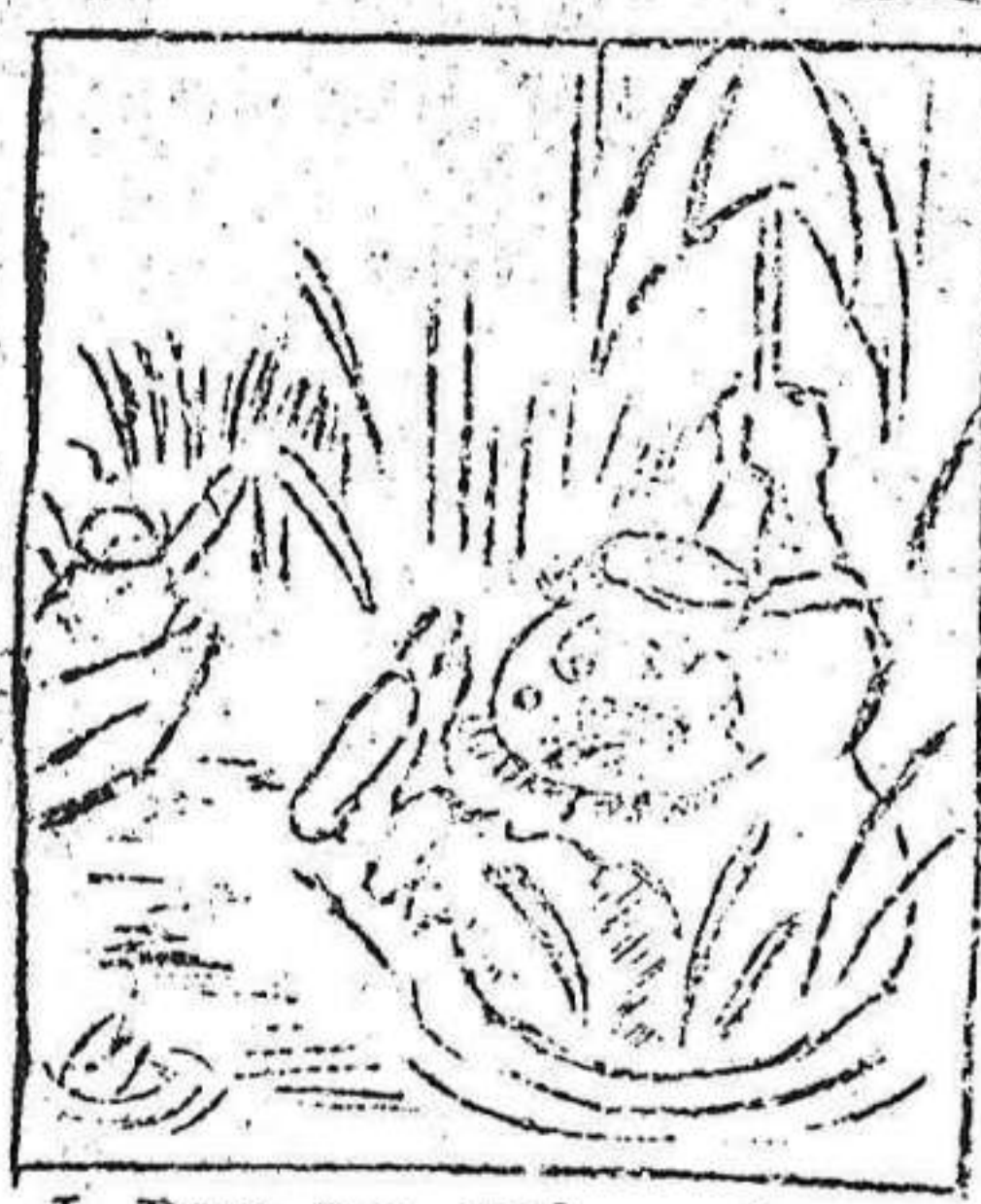
1. Por no saber de aviación se ha dado el gran remojón.

AVENTURAS DE "MACUTO", primo hermano de Canuto. - Nº20. - Regreso de "MACUTO"