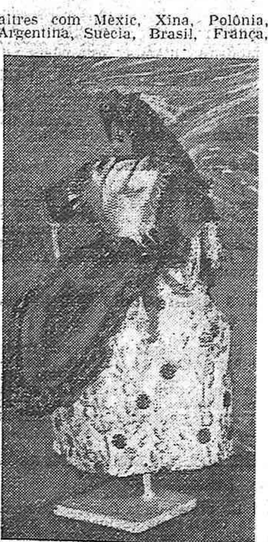
Estats Units, U. R. S. S. i tants d'altres, ens mostren amb llurs actituds en la vida nacional de llurs respectius països, formant un sol cos amb ell, quina és llur aportació en el desenvolupament de les forces del progrés, democràcia i de la pau de la humanitat.

En aquesta Exposició, les dones de països tan allunyats uns dels altres com Mèxic, Xina, Polònia, Argentina, Suècia, Brasil, França, vivits en la vida nacional de llurs respectius països, formant un sol cos amb ell, quina és llur aportació en el desenvolupament de les forces del progrés, democràcia i de la pau de la humanitat.