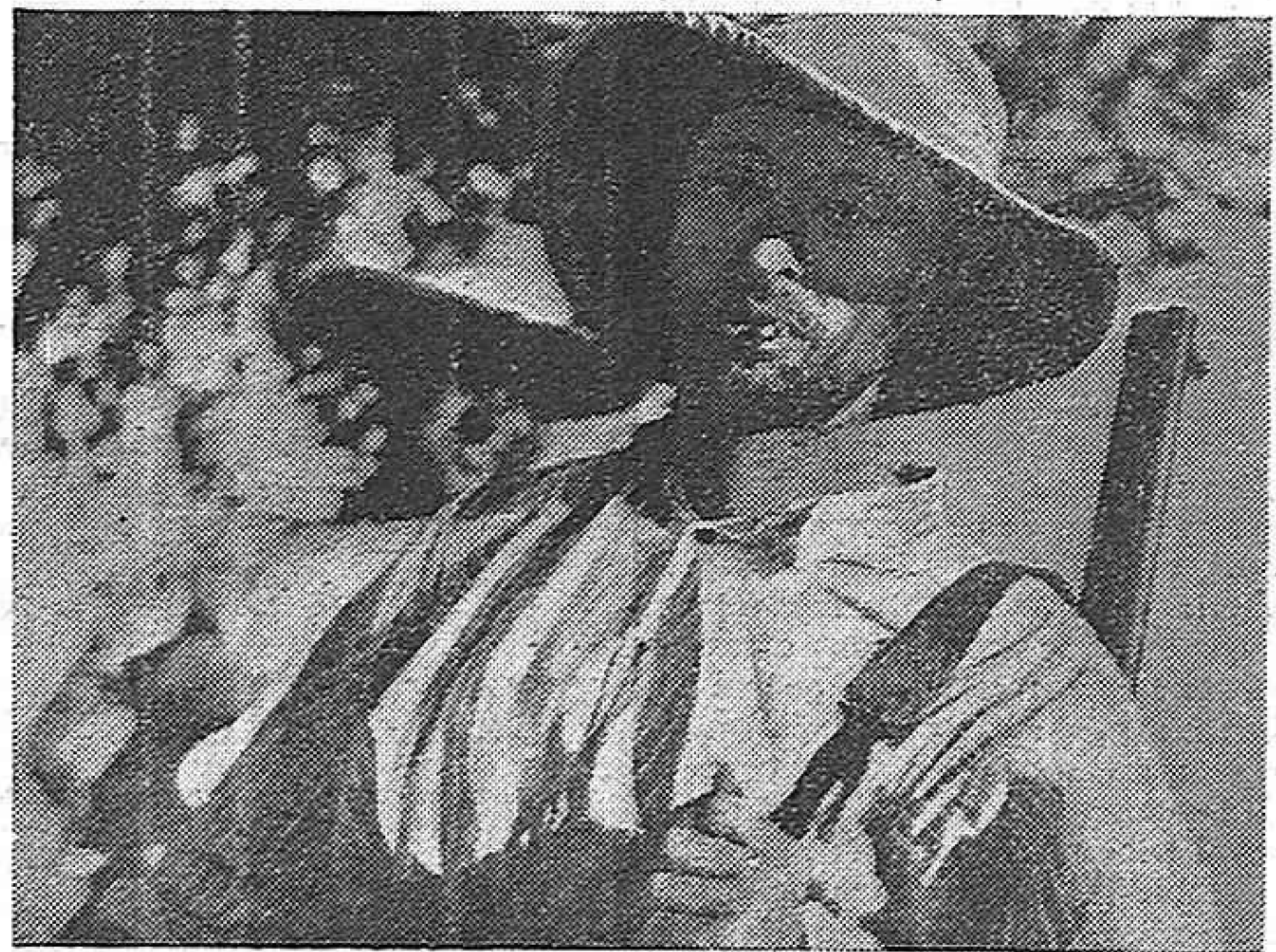
Guerrillers d'Espanya, herois de la independència nacional.

Secundar la crida guerrillera no significa pas renunciar a recolzar les institucions de la República a l'emigració. El Partit Comunista defensa les institucions republicanes encara que no està d'acord ni amb la composició actual del Govern republicà ni amb l'existència simbòlica d'aquestes institucions, simbolisme còmplice de la política capituladora d'aquells que han perdut la fe en el poble si només esperen un «gest» dels imperialistes anglo-nordamericans que els permeti de justificar llur renúncia a la lluita per a la República, en l'oposició de la reacció internacional al restabliment de la democràcia a Espanya. Sobre això vull dir que les forces autènticament republicanes i democràtiques no s'han d'alarmar massa davant la defeció de certa gent que, havent renunciat a la lluita i a la República, cerquen acullir al calor de les ales de la monarquia que les forces reaccionàries imperialistes ofereixen com a solució. Per a ocupar els llocs que ells abandonen arriben milers i centenars de milers de pègoss, d'obrers, d'intel·lectuals, de menestrals que han viscut l'experiència de la mon-