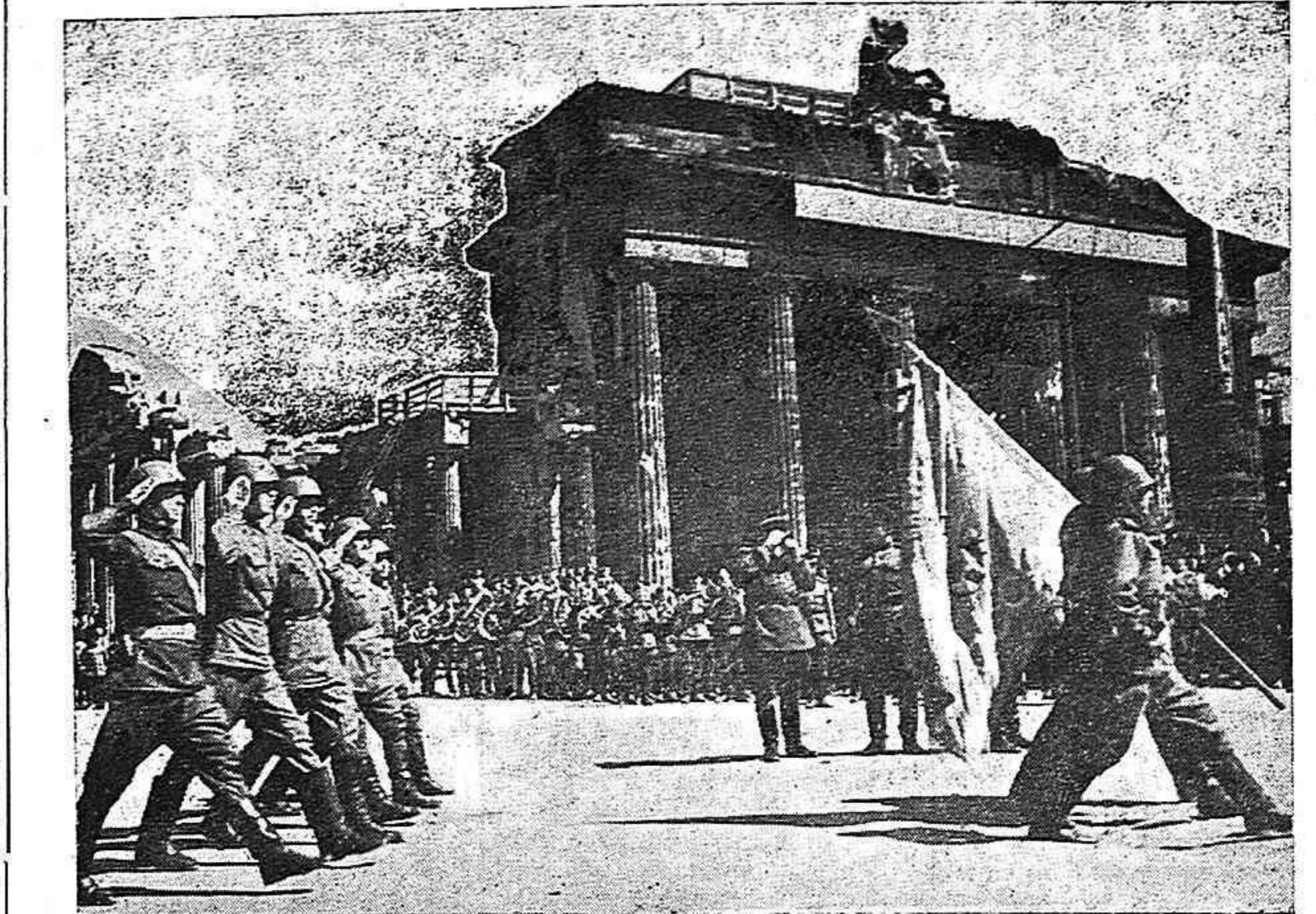
Las victoriosas tropas del Ejército Rojo, en uno de los actos de celebración de la toma de Berlín y de la victoria, desfilan ante la Puerta de Brandemburgo.