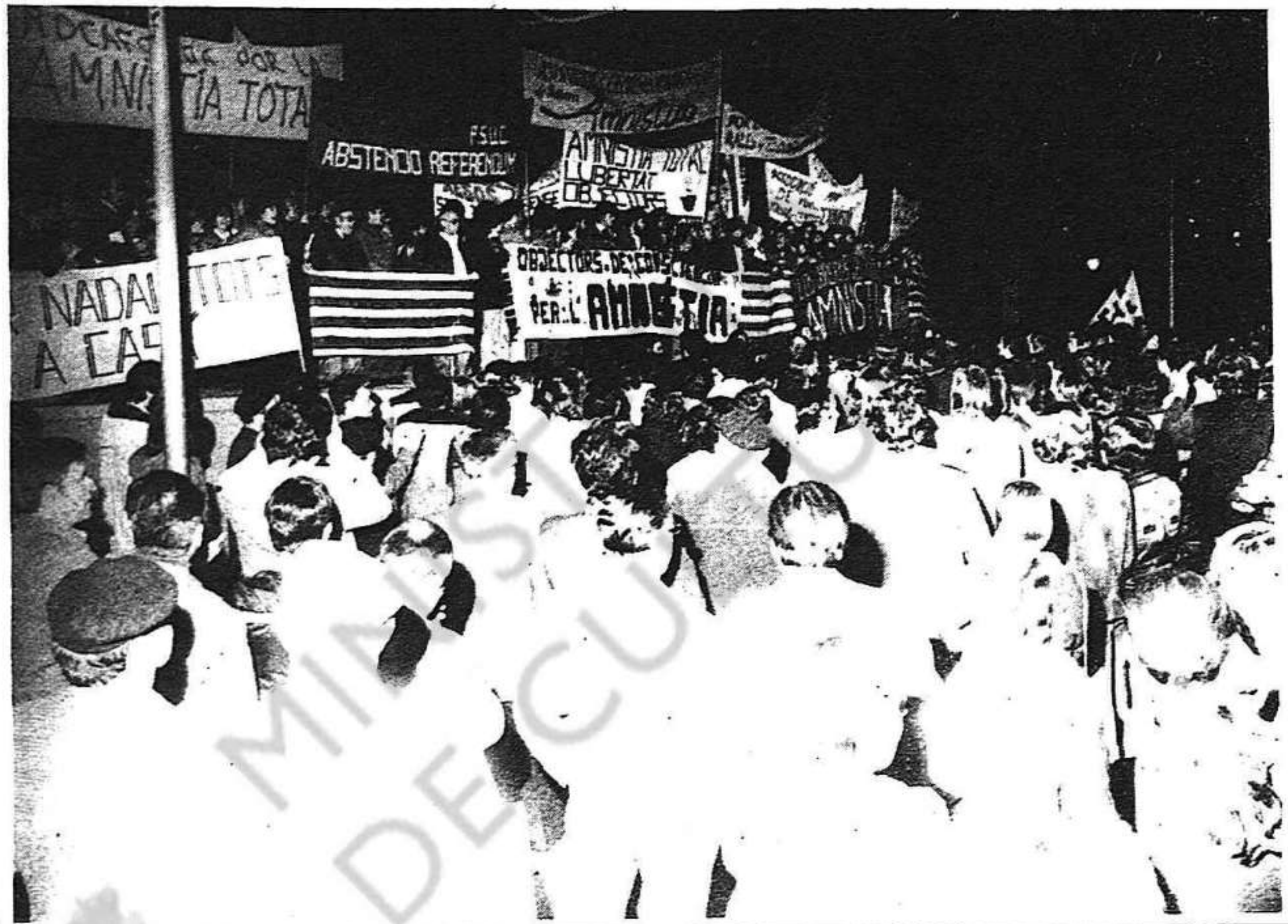
Mataró: manifestació per l'amnistia

Ha passat el referèndum i ha passat la desfeta dels "ultres", amb un elevat percentatge d'abstencions i amb pocs vots afirmatius que, tal com el mateix govern presentà la campanya, han estat vots a favor de la democràcia. El referèndum ha passat, però els problemes del país resten damunt la taula. Caldrà imposar al govern les set condicions de l'oposició, condicions que, per a nosaltres, els catalans, tenen un significat inequívoc: llibertat, amnistia i Estatut d'autonomia.