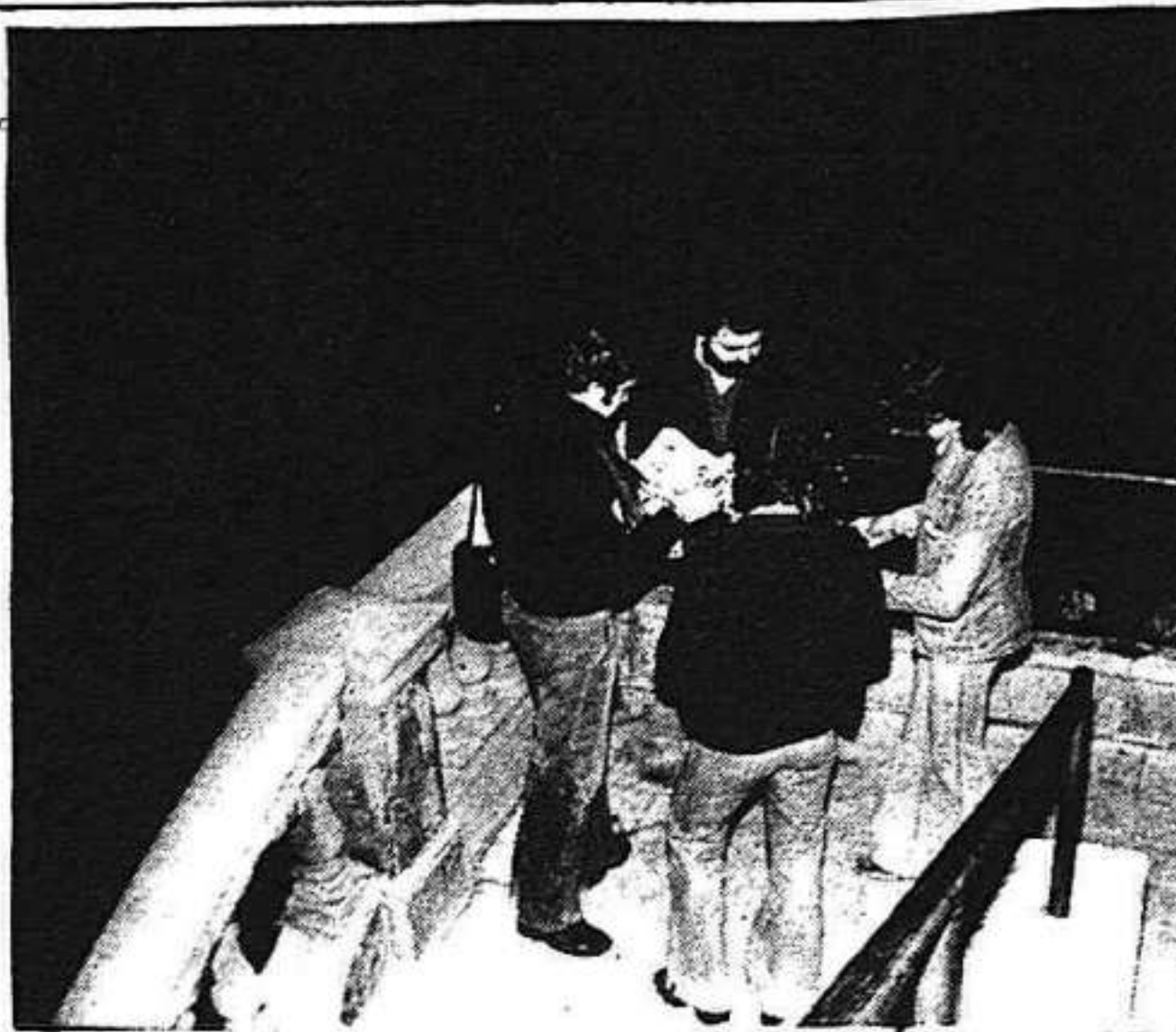
VENDA PÚBLICA DE TREBALL A CORNELLA