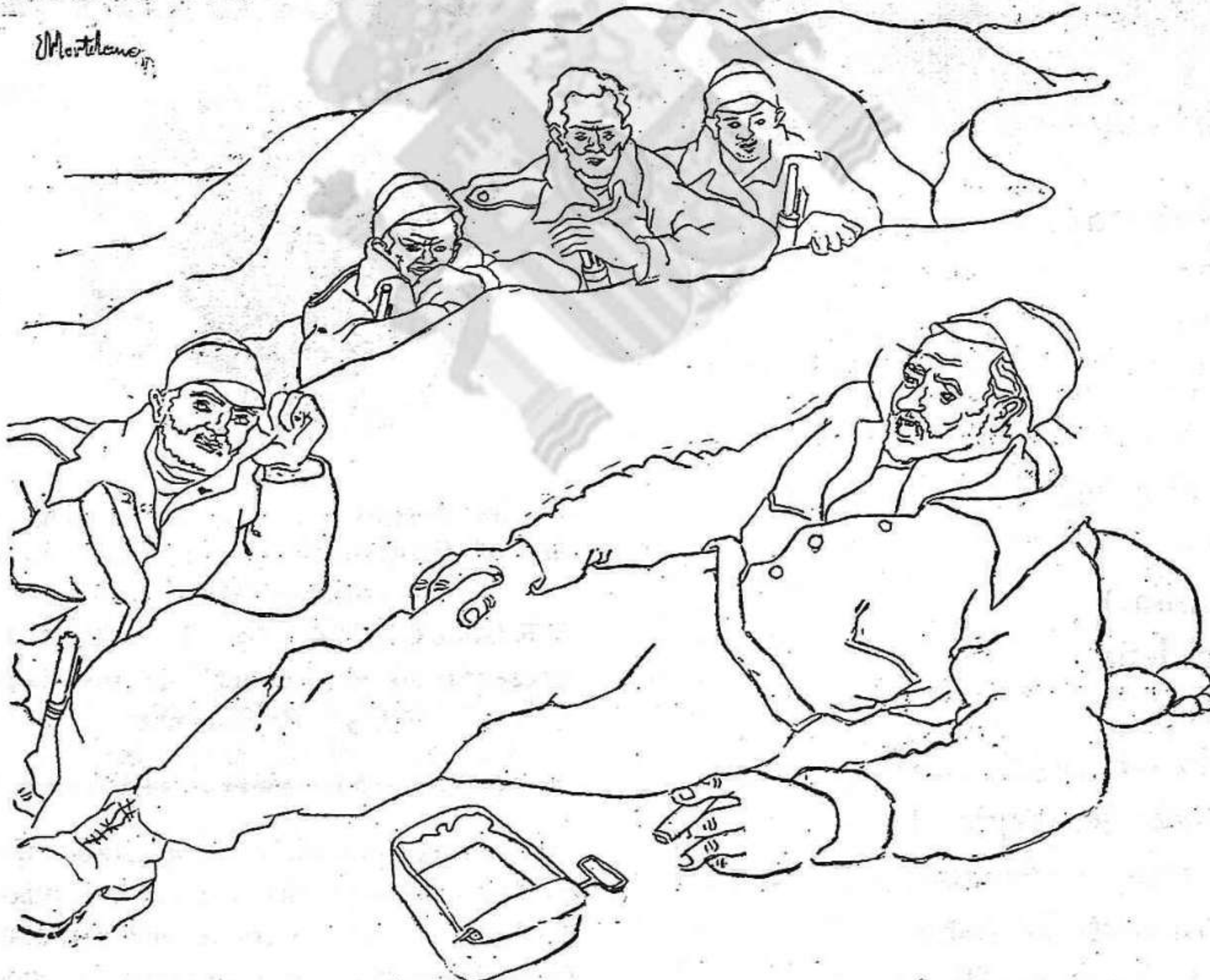
FRENTE DEL CENTRO. — Durante un descanso en las trincheras los milicianos entonan canciones. (Apunté del natural por Hortelano.)

"Ruégole visite comisario Negocios Extranjeros expresarle el nombre mío, Gobierno y pueblo español profunda indignación acogidos aquí último acto piratería rebeldes al hundir barco soviético "Komsomol". Gran impaciencia nos embarga a todos por suerte haya podido correr tripulación. En los escasos días paso región valenciana hizo tan popular para sus componentes, guardamos recuerdo emocionado de su sana solidaridad. Agradeceré a este respecto cualquier noticia envíen. Por lo demás, hundimiento "Komsomol" es una nueva prueba justeza tesis española sobre grave peligro que corre por horas la paz mundial, si se sigue permitiendo a las fuerzas conocidas de destrucción y de guerra hacer el juego a quienes, carentes de todo sentido de responsabilidad europea, no vacilarán en arrastrar tras su propio fracaso la causa general de la paz."