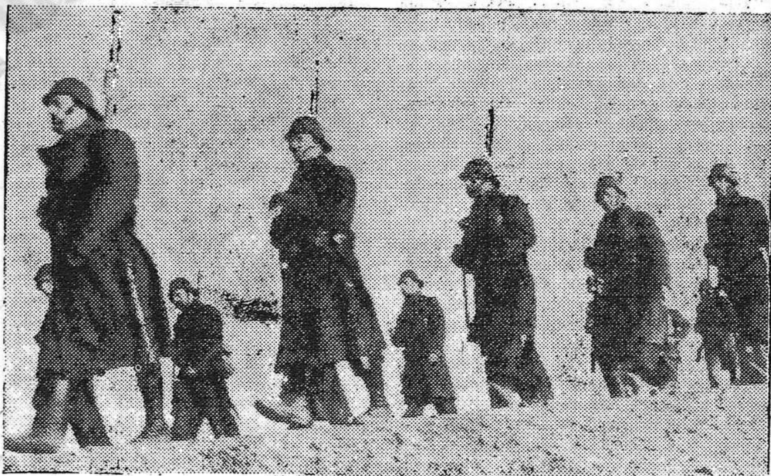
Los defensores de Madrid son el orgullo de los antifascistas del mundo entero

El general contestó que ello no era suficiente, porque la política de intervención comportaba riesgos formidables. La cuestión del nuevo envío de tropas fué aplazada para dentro de unos días.