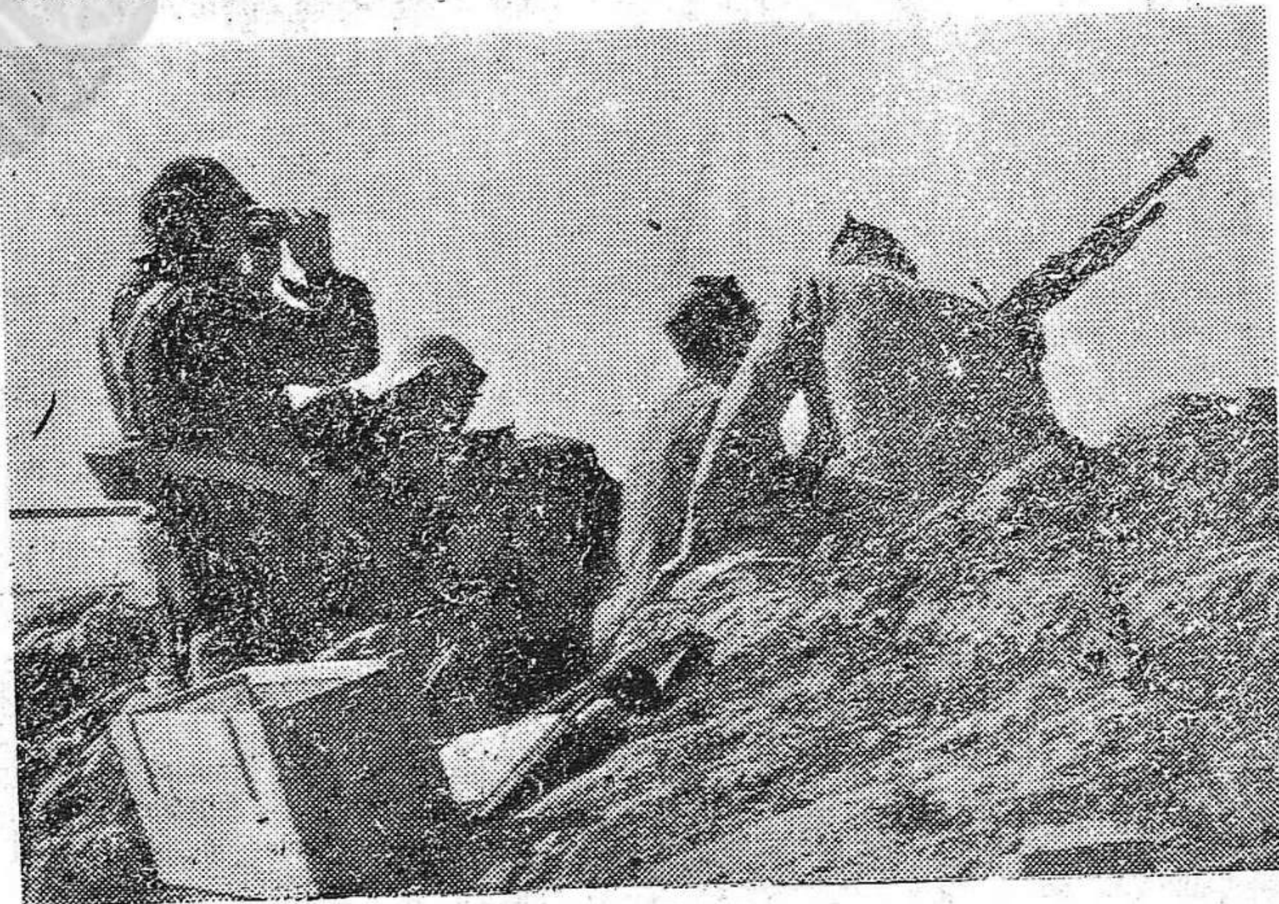
Escenas del frente