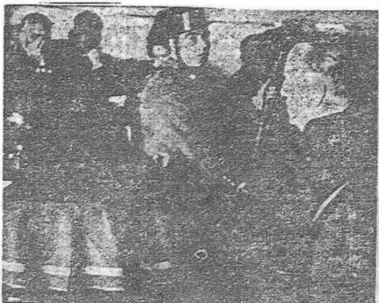
El general Llano

El capità de cavalleria Puig Jiménez digué que el seu coronel arregà els soldats amb visques a Espanya, per impedir que esclatés un moviment extremista.