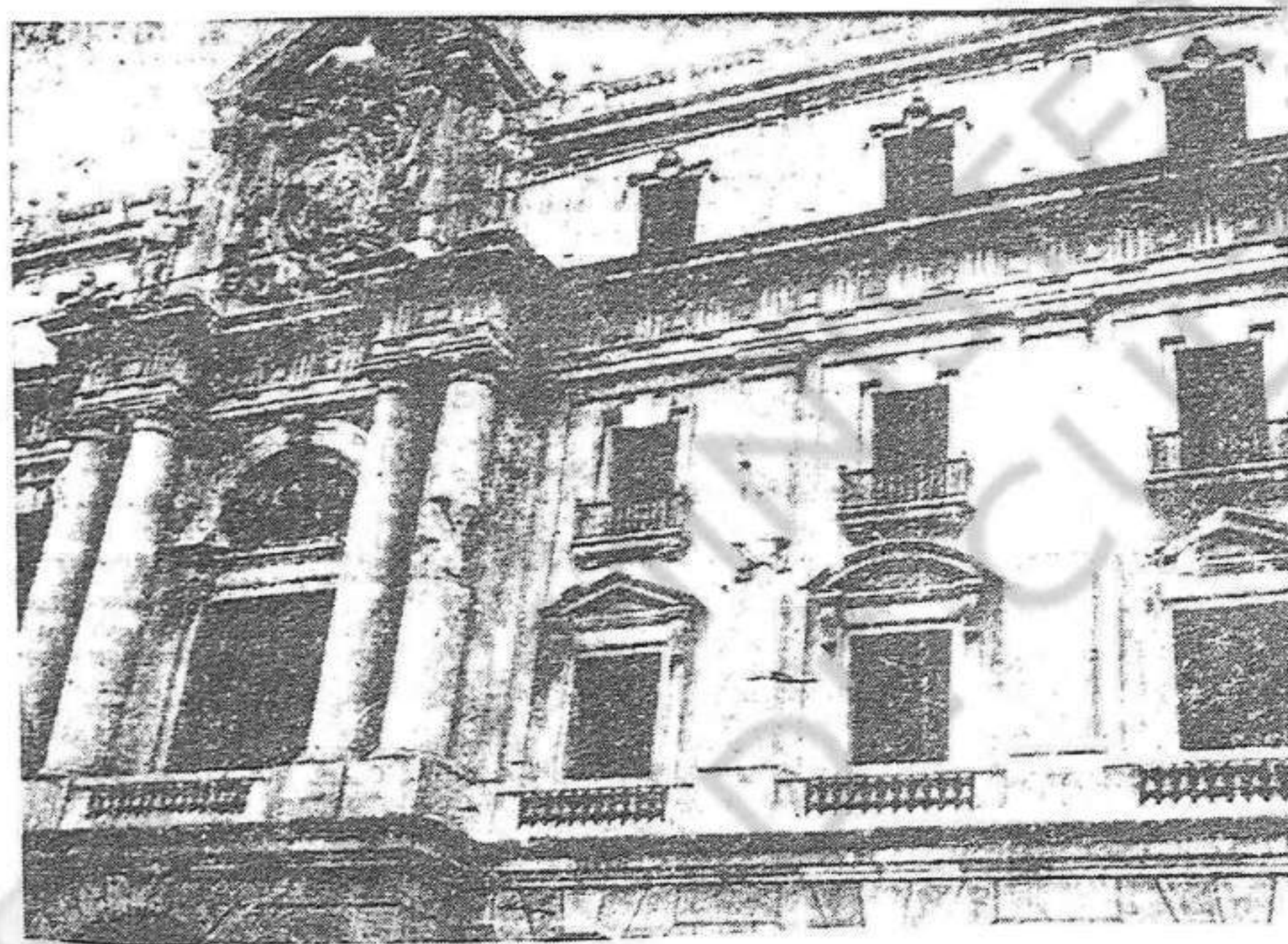
Edifici de la caserna de la Quarta Divisió, des del qual el sedictee Godeo es féu fort contra les forces lleials

Van anar desfilant els testimonis. El primer fou el general Llano. Després fou el general Aranguren. Després altres generals i altres militars. Tots contestaren les preguntes de la defensa gairebé coincident. Llevat dels dos primers generals esmentats, que aportaren detalls concrets i incontrovertibles, els altres, processats així mateix per haver secundat el moviment sedictee, contestaven amb evasives i amb vaguetat, però coincidint l'un amb l'altre. Coincidint fins al punt que donaven la impressió d'una lliçó apresca, com així ho recollí, insinuant-bo, l'acusador en el seu informe final.