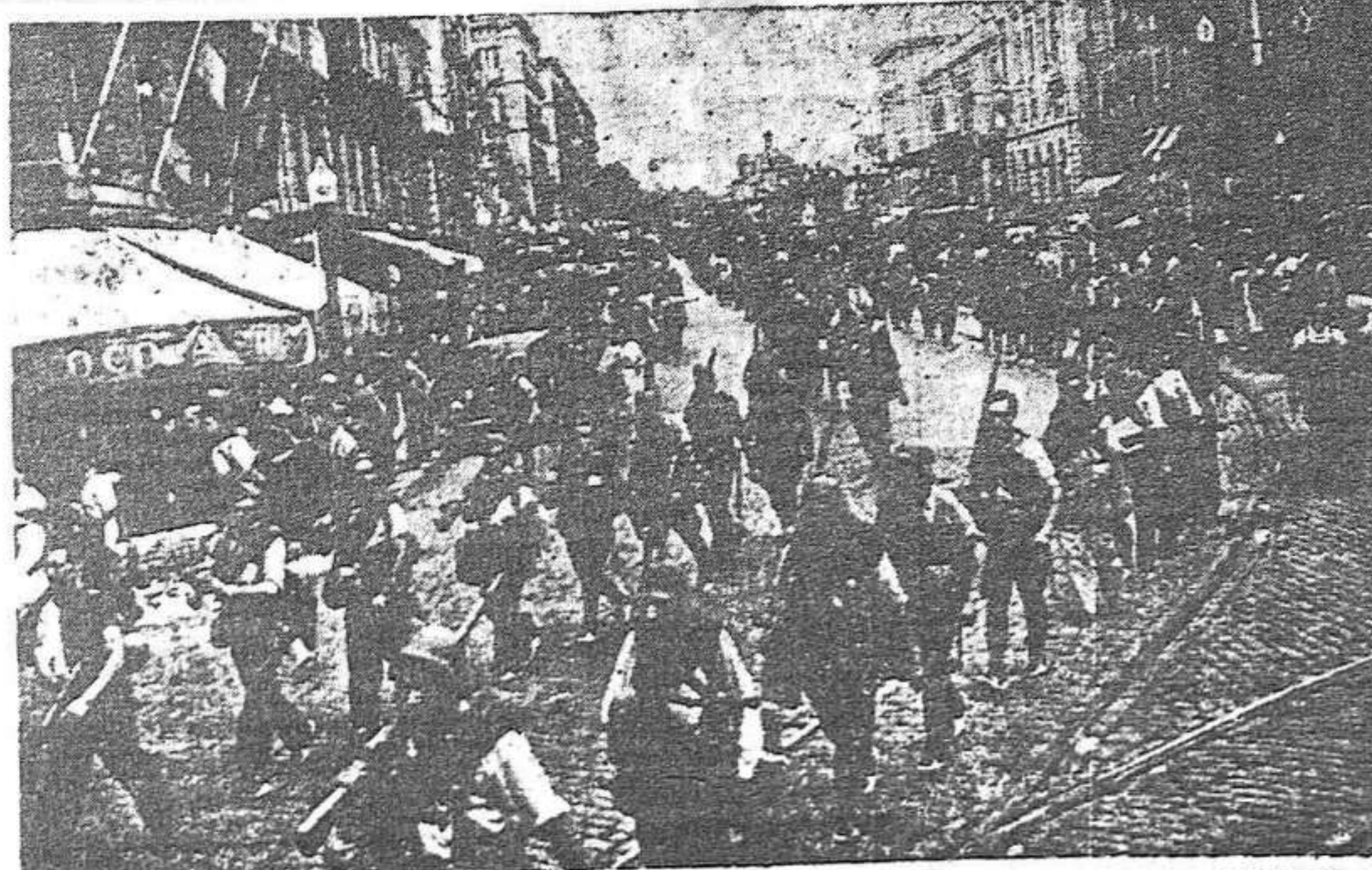
Els milicians de la U. G. T. surten del Parc per concentrar-se i partir cap a Olesa a combatre el feixisme