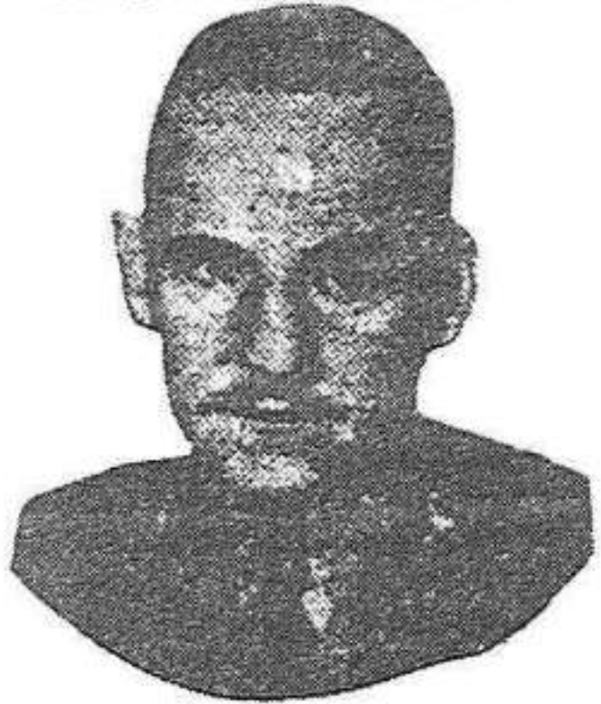
El traïdor Godeo, cap dels sedictees de Barcelona