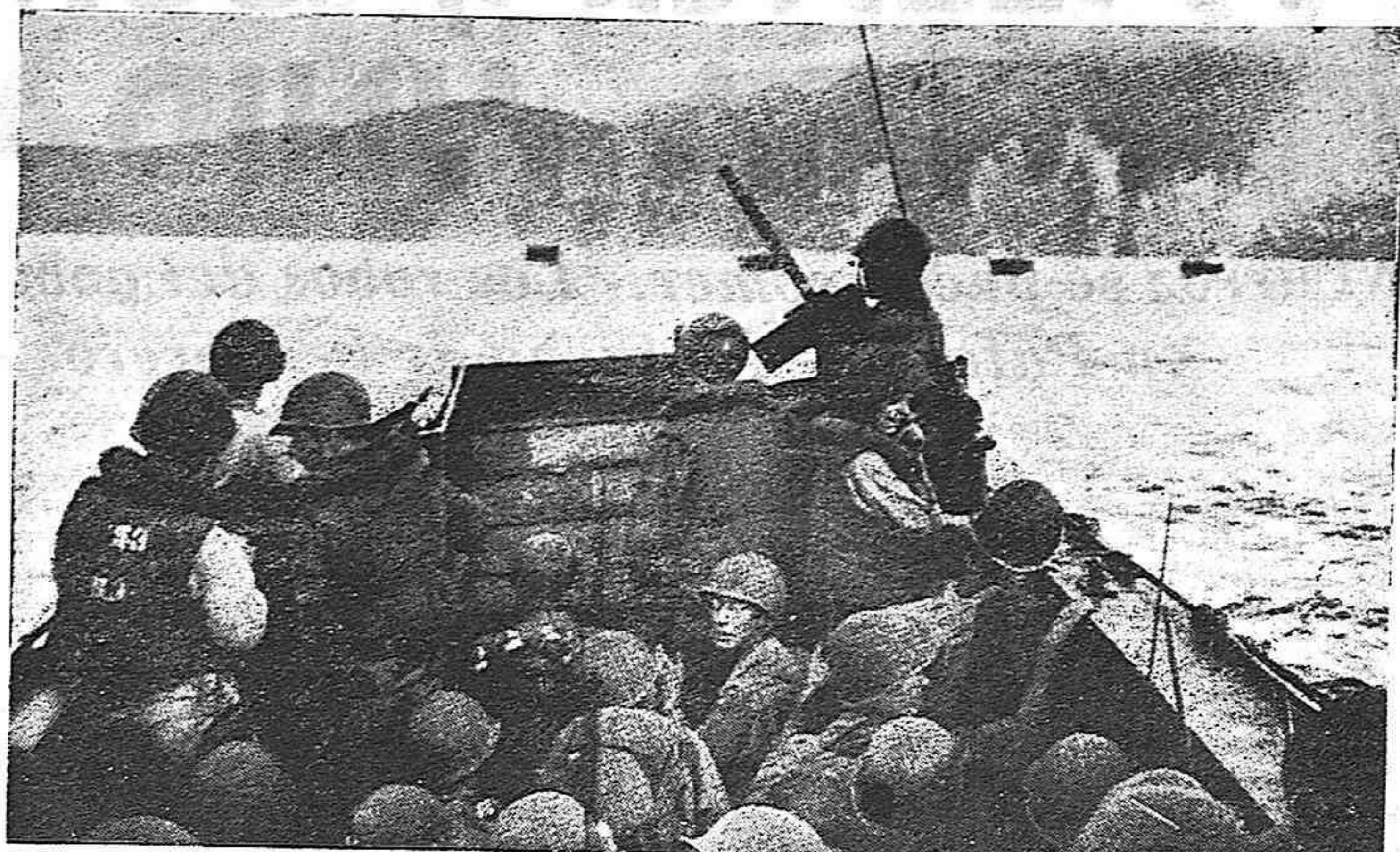
Desembarco norteamericano en una de las islas del Pacífico.

Se refirió a la creación de la J. S. y afirma que el deber de la emigración es ayudar ese gran movimiento subterráneo que acabará con el franquismo y reconquistará la República. Nuestro grito de guerra hoy debe ser disciplina y unidad. Termina haciendo un llamamiento muy cordial para que se agrupen todos los republicanos en torno a la J.S. órgano de la dirección de la lucha de nuestro pueblo. Se dió lectura a algunos párrafos de una carta del ilustre jefe del E. M. del Ejército de la República general Rojo en la que se destaca el valor decisivo que la creación de la Junta Suprema, representa para la libertad de España. El deber nuestro —dice— es ayudar esa obra de unidad. El poeta Juan Rejano leyó poesías; entre ellas trozos del poema de Antonio Machado —que si viviera estaría al lado de la lucha del pueblo, dijo Rejano— titulado "Campos de Soria", un bellísimo soneto de que es autor el propio Rejano "Soneto a España" y una composición de Rafael Alberti dedicada a la Junta Suprema, que publicaremos en nuestras páginas.