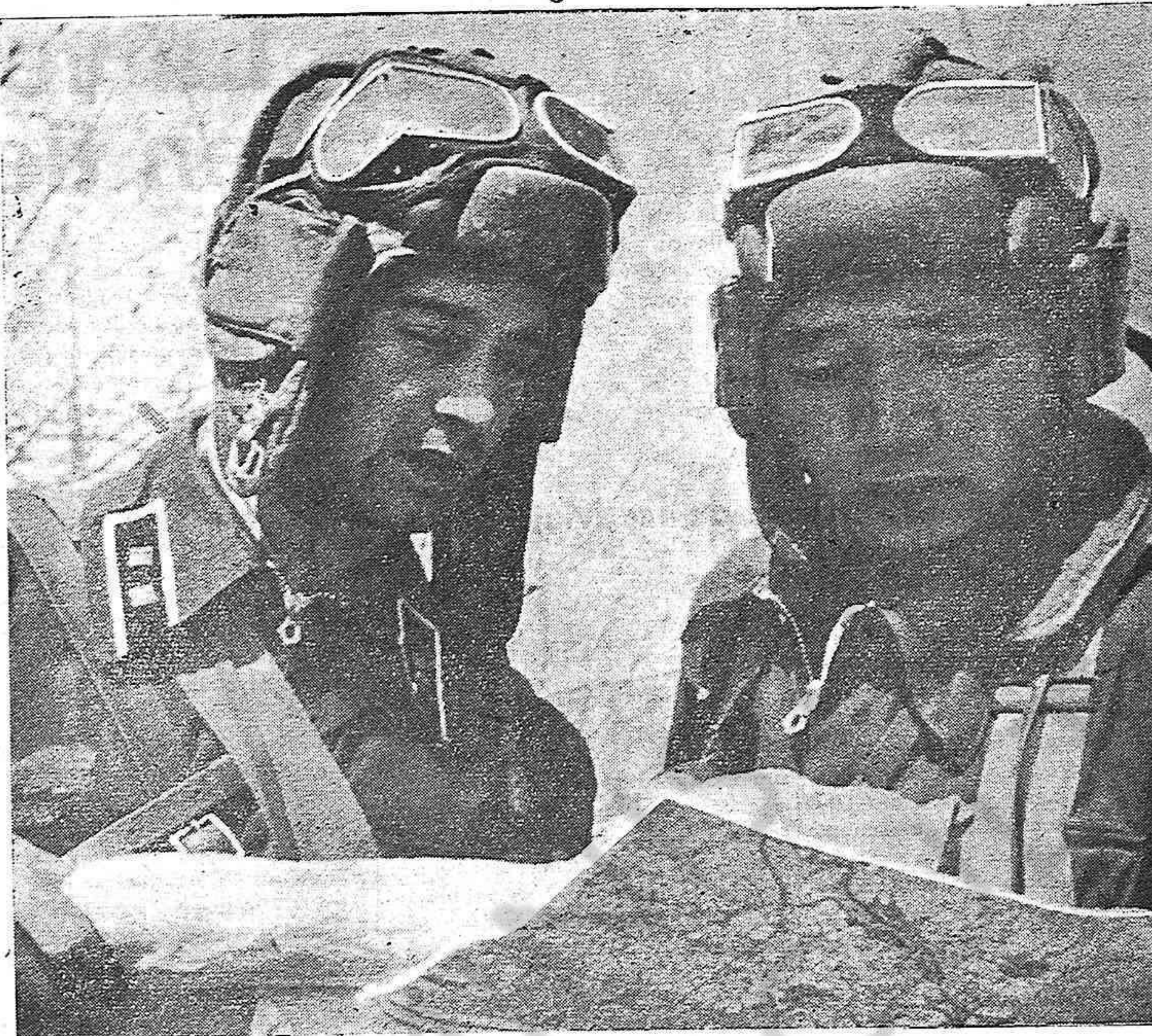
¡A Berlín! Tanquistas soviéticos estudiando sus mapas de operaciones.

—¿Cómo? ¿Se muda usted, señora Eulalia? —Sí. He encontrado un cuarto allá por Diego de León. —Pues le habrá costado mucho trabajo y bastante dinero, porque ahora eso está difícil. Claro que como su marido fué sargento de la División Azul pues... esos siempre tienen ventajas. —No vaya a creer. Me ha costado mi dinero conseguir el traspaso del cuarto. Pero es que ya no podíamos seguir más aquí. Verá lo que me pasó el otro día. Me encontré en la escalera con el muchacho ese, impresor, que vive en el 4; ya sabe, ese que es tan rojo que no se como no le han metido en la cárcel a ver si nos deja tranquilos. Bueno, pues se enteró de que mi marido había vuelto de la División Azul y me dijo: "Señora, buena se la ha buscado su marido, pues hay que ver lo que les espera a los de la División Azul cuando esto cambie, que será pronto. —Pero mi marido fué forzado. —¿Pues no dicen que son voluntarios? —Bueno, eso se dice porque no se puede decir otra cosa. —Pues sea como sea no doy un real por el pellejo de su marido. Y se fué riendo escaleras arriba. —Así que ya ve, me mudo, porque como ese chico es tan bruto es capaz de hacer lo que dice. En Diego de León tiene usted su casa. —Muchas gracias. Que les vaya bien. Y... por si acaso, no diga usted allí que su marido estuvo en la División Azul.