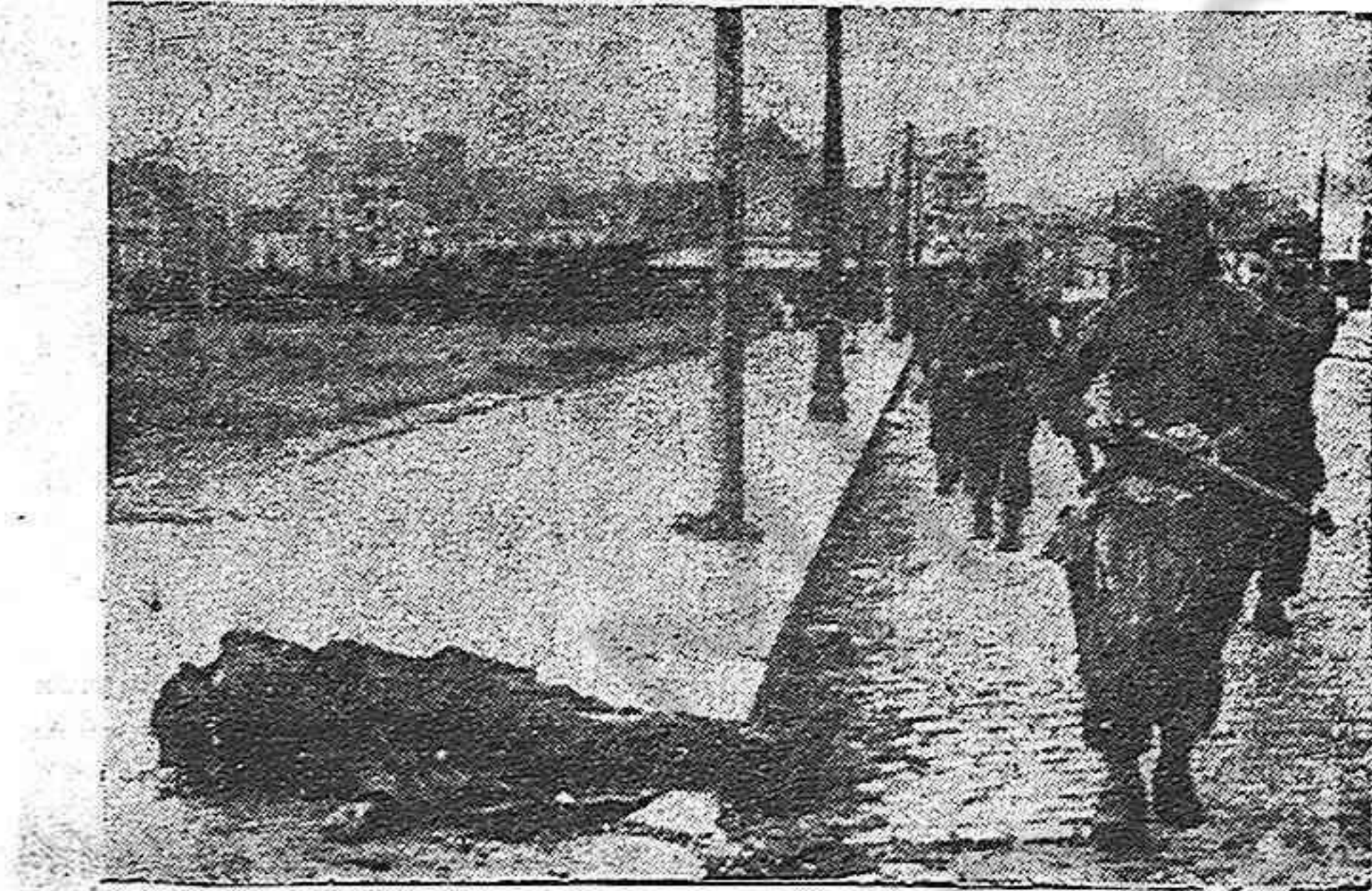
Soldados aliados pasan por una calle de Cherburgo ante un nazi que dejó de serlo.

lo extiende el gobernador de la provincia y para obtenerlo es preciso presentar cédula, carnet de identidad y a veces, esto no es suficiente y es necesario presentar otra documentación. Aquellos que son sorprendidos viajando sin salvoconducto son detenidos, están algunos días en la cárcel y se les impone una multa.