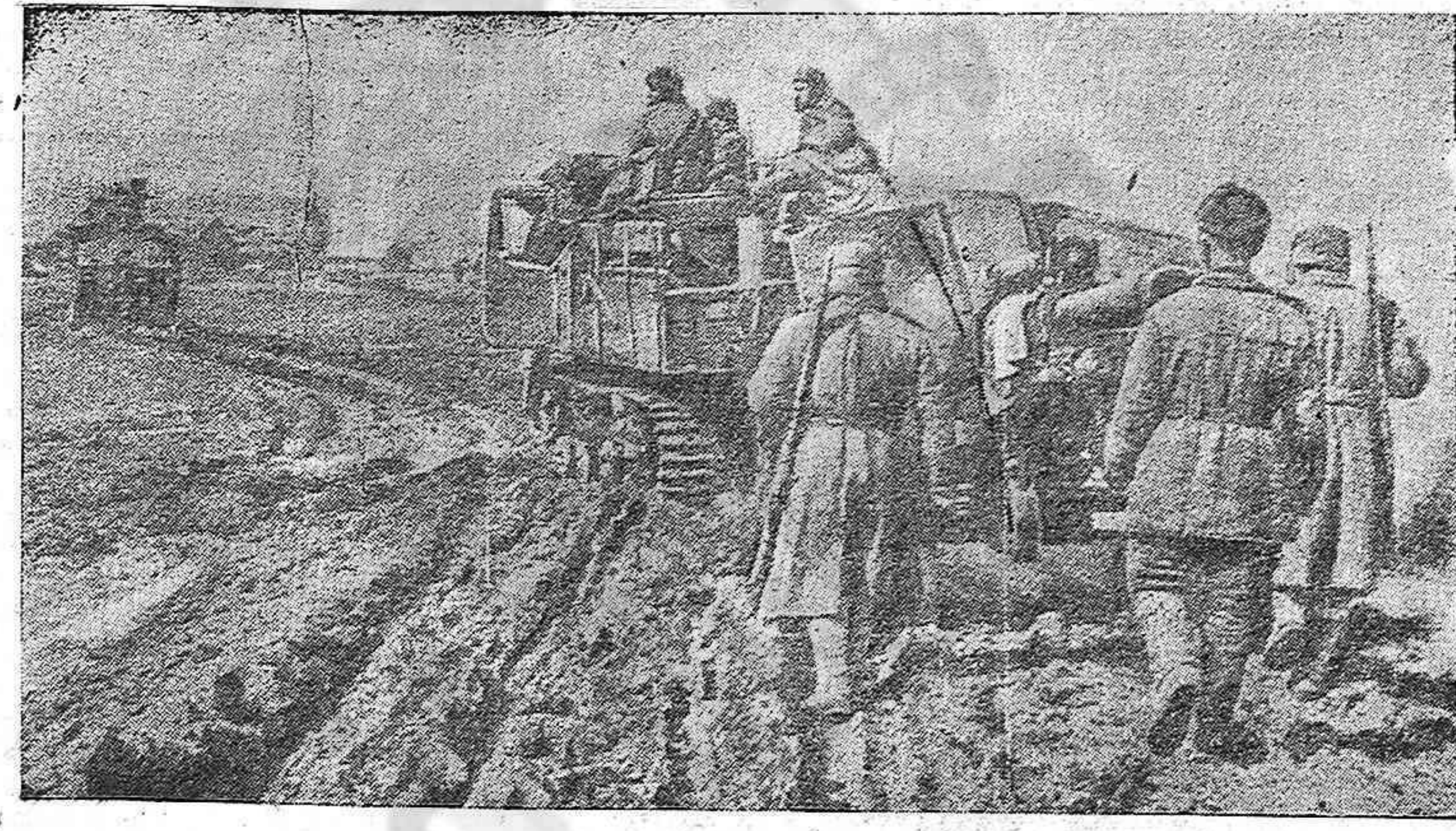
Frete oriental.—Hacia un nuevo emplazamiento artillero.