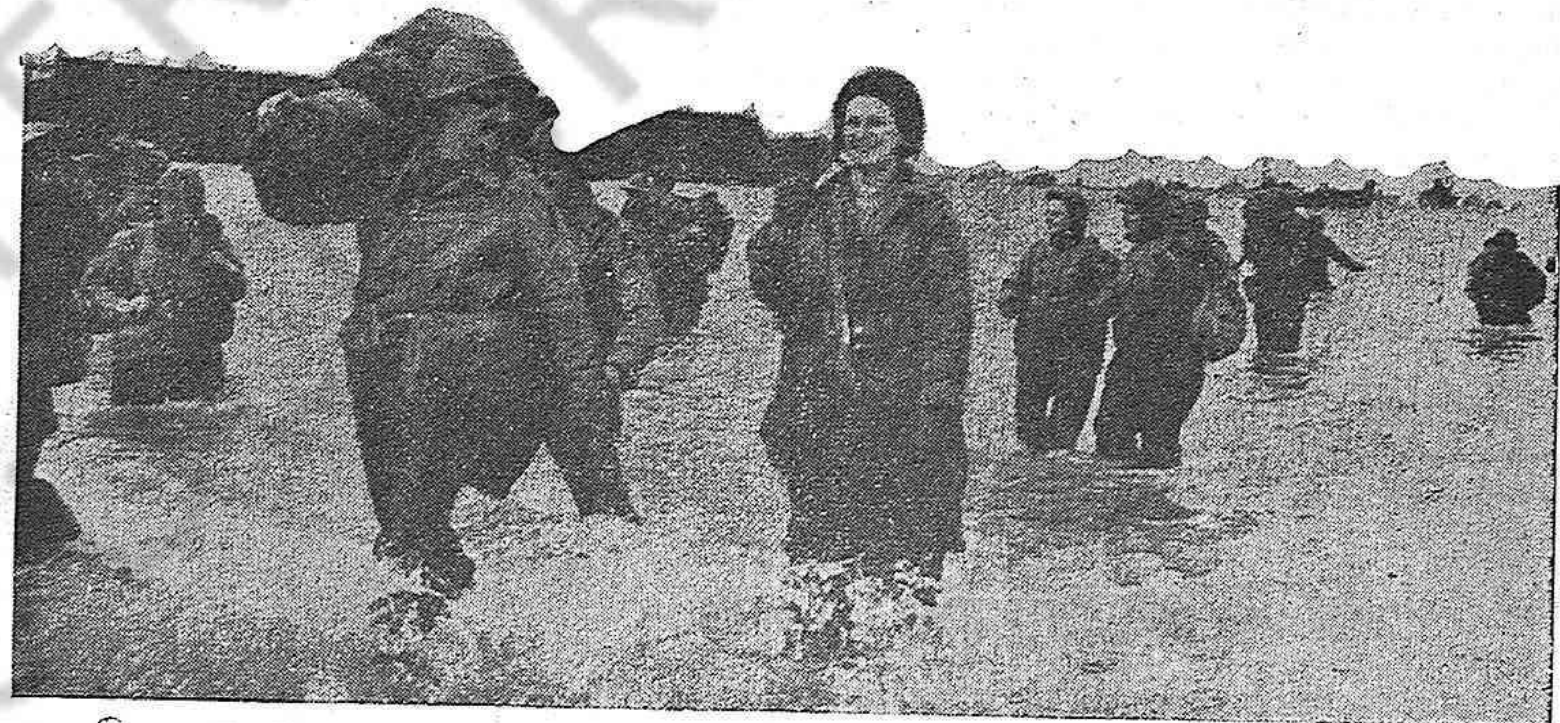
Enfermeras norteamericanas desembarcando en las playas francesas.