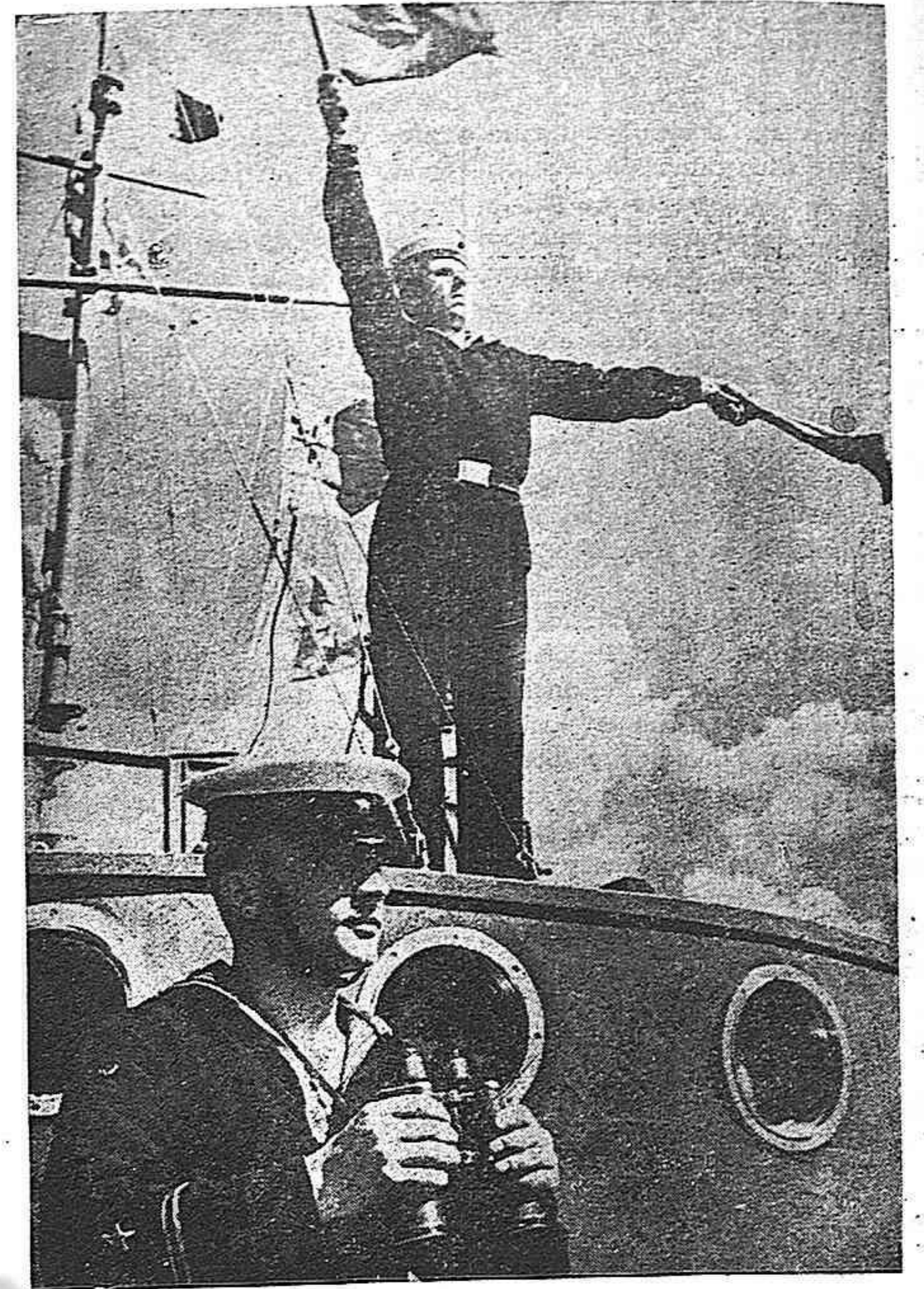
MARINOS DE LA GLORIOSA FLOTA DEL MAR NEGRO

El acto constituyó un extraordinario acontecimiento y una muestra inequívoca de la irrompible fraternidad entre los hijos de Francia y de España.