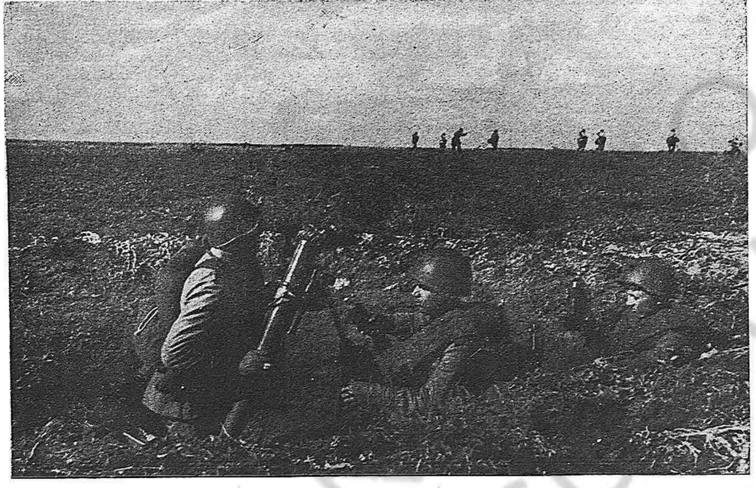
MORTERISTAS SOVIETICOS PROTEGIENDO UN AVANCE

dos tuvimos que escuchar, porque la asistencia era obligatoria, en las que puso a Hitler de vuelta y media y se refirió a su indignación al ver en un viaje a Italia, los productos españoles, como vinos y aceite, con etiquetas en que decía: "Aceite de nuestras Colonias". —Por eso digo que no me extraña que haya ese acuerdo con los católicos. Y cada día irán ingresando en la Junta Suprema nuevos elementos que odian al franquismo. Y así será la lucha más fuerte y su acción más arrolladora e incontenible.