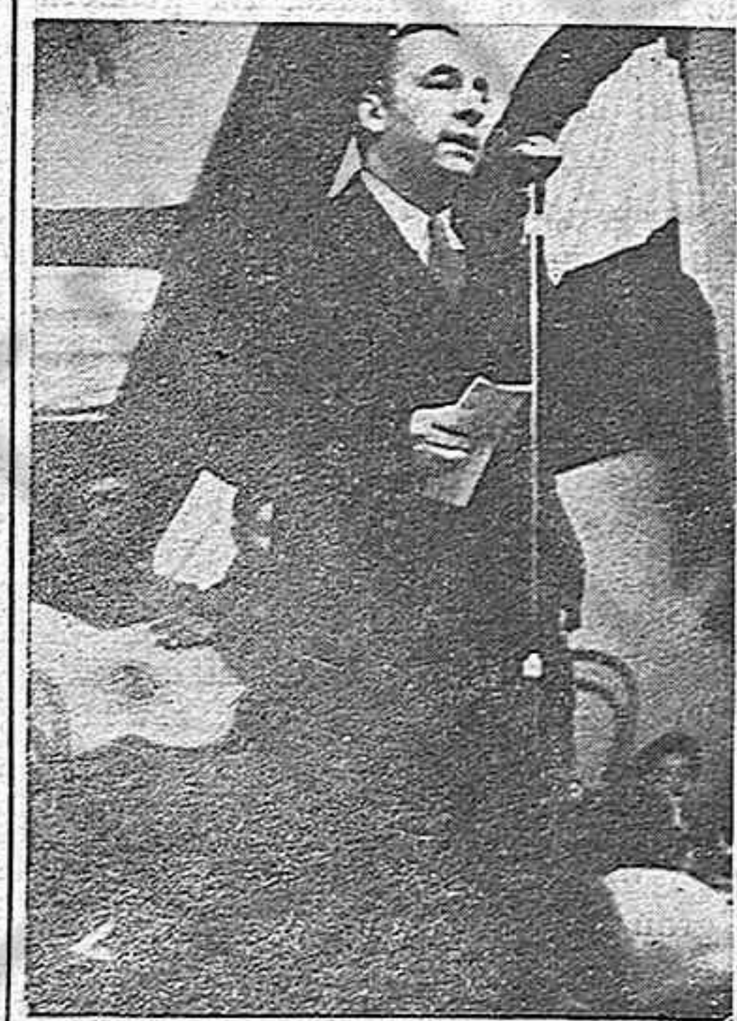
Pablo Neruda, el gran amigo de nuestro pueblo en su despedida.