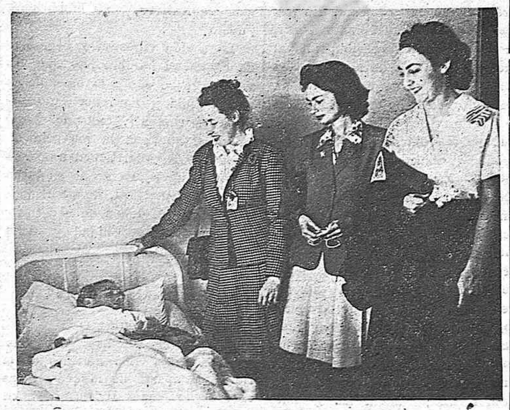
Las delegadas norteamericanas a la gran Convención de Solidaridad, hacen una visita al sanatorio de la FOARE.