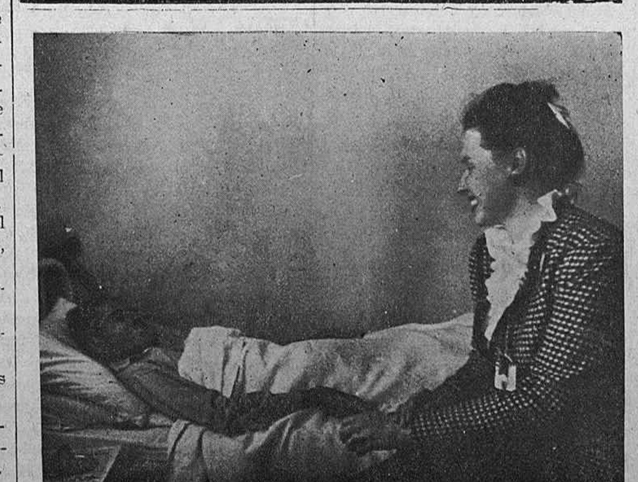
Una delegada norteamericana a la Convención, charlando con un enfermo en el Sanatorio de la FOARE.