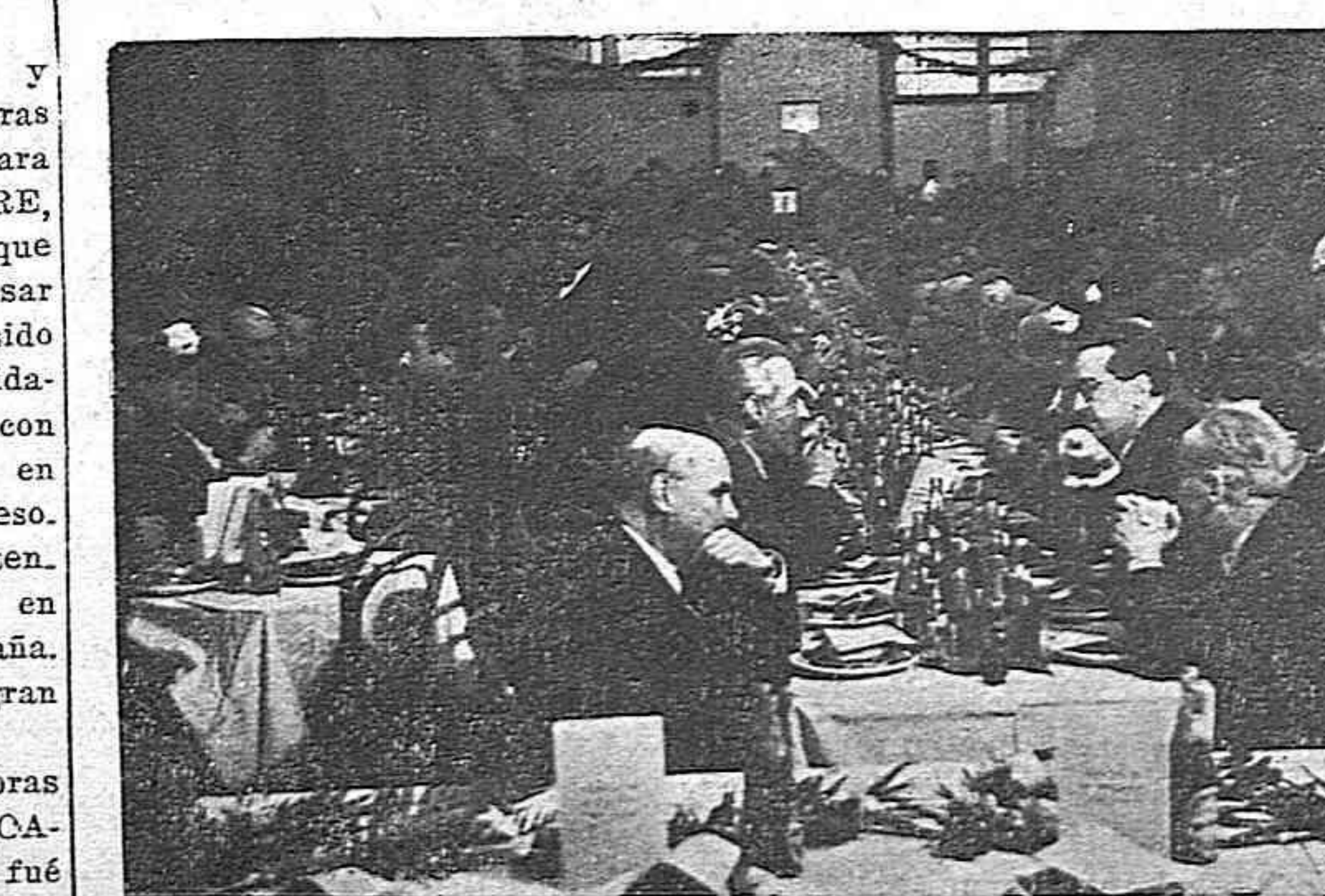
Un aspecto del banquete a Pablo Neruda, gran amigo del pueblo español, al que concurrieron centenares de personas.

21.—Proponemos que se someta a la consideración del Presidente de la República Mexicana, la conveniencia de establecer en la mayor brevedad posible un consulado en la ciudad de Argel, puesto que nada como la presencia de un representante de México en la citada población podría servir, lo mismo en el terreno moral que en el material, a los españoles radicados actualmente en África del Norte.