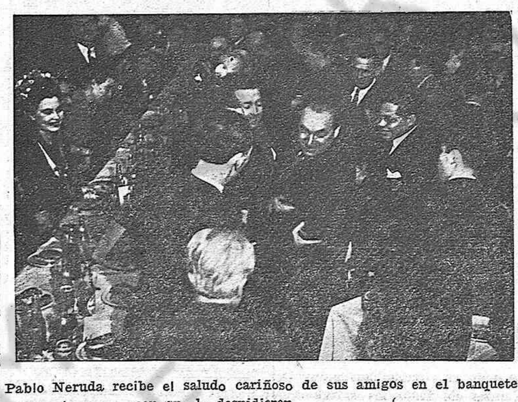
Pablo Neruda recibe el saludo cariñoso de sus amigos en el banquete con que lo despidieron.

Los franquistas españoles no se detienen ante ningún procedimiento por vil que sea. He aquí un caso que da muestra cabal de lo que son capaces: Un muchacho de las J. S. U. se hallaba en peligro de ser detenido en Miranda de Ebro. Un tío suyo, de quien el joven no sospechaba que fuera falangista, le brindó asilo y se lo llevó a su casa. Allí procuró sonsacarle algunas cosas, especialmente a qué actividades se había dedicado durante la guerra. Al cabo de algún tiempo, el falangista le dijo al muchacho que ya podía salir sin peligro. Nada más pisar la calle le detuvieron. Y cuando la madre del muchacho fué a preguntar a su hermano: ¿Dónde está mi hijo?, el miserable contestó tranquilamente: —Donde debía estar hace mucho tiempo.