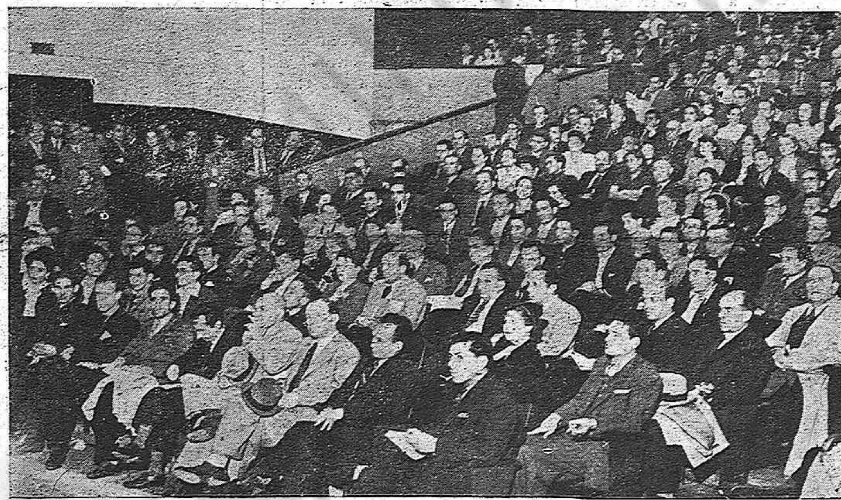
Un aspecto del Teatro de las Artes el 18 de julio en conmemoración de la lucha del pueblo español.