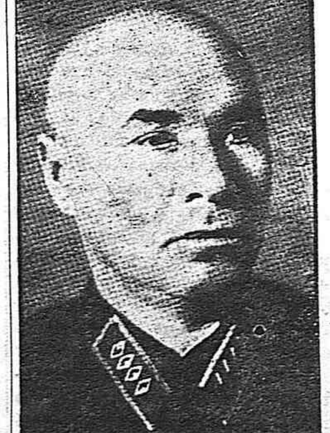
El General Apanasenko "Hércules", Jefe del Ejército Rojo del Extremo Oriente.

Las protestas falangistas de hoy tienen el mismo significado que las de ayer. A esos profesionales del crimen, nada puede importarles la destrucción de monumentos históricos. Durante treinta y dos meses arrasaron cientos de iglesias españolas, destruyeron con saña las mejores obras de arte de nuestra Patria, asesinaron a cientos de miles de pacíficos españoles. Lo que les importa son los soldados fascistas muertos en Roma, las fábricas destruidas, los polvorines volados, las estaciones inutilizadas, porque con ello se ha dado un golpe a la potencia del fascismo y se ha ayudado a la obra liberadora de los ejércitos aliados en Sicilia. El Dean y los profesores falangistas, es decir, hitlerianos, de la Universidad de Barcelona, han "elevado" también su cínica protesta, olvidándose de que hace unos años esa misma Universidad y la Catedral de Barcelona, eran bombardeadas por aviones alemanes e italianos, que destruyeron con la complicidad y la colaboración de los franquistas, medio Madrid, medio Barcelona, Guernica, Granollers, Levante y otras tantas ciudades y cientos de monumentos y centros de arte como el Museo del Prado. Una vez más los franquistas surman su actividad cómplice a la orquesta que dirige Goebbels.