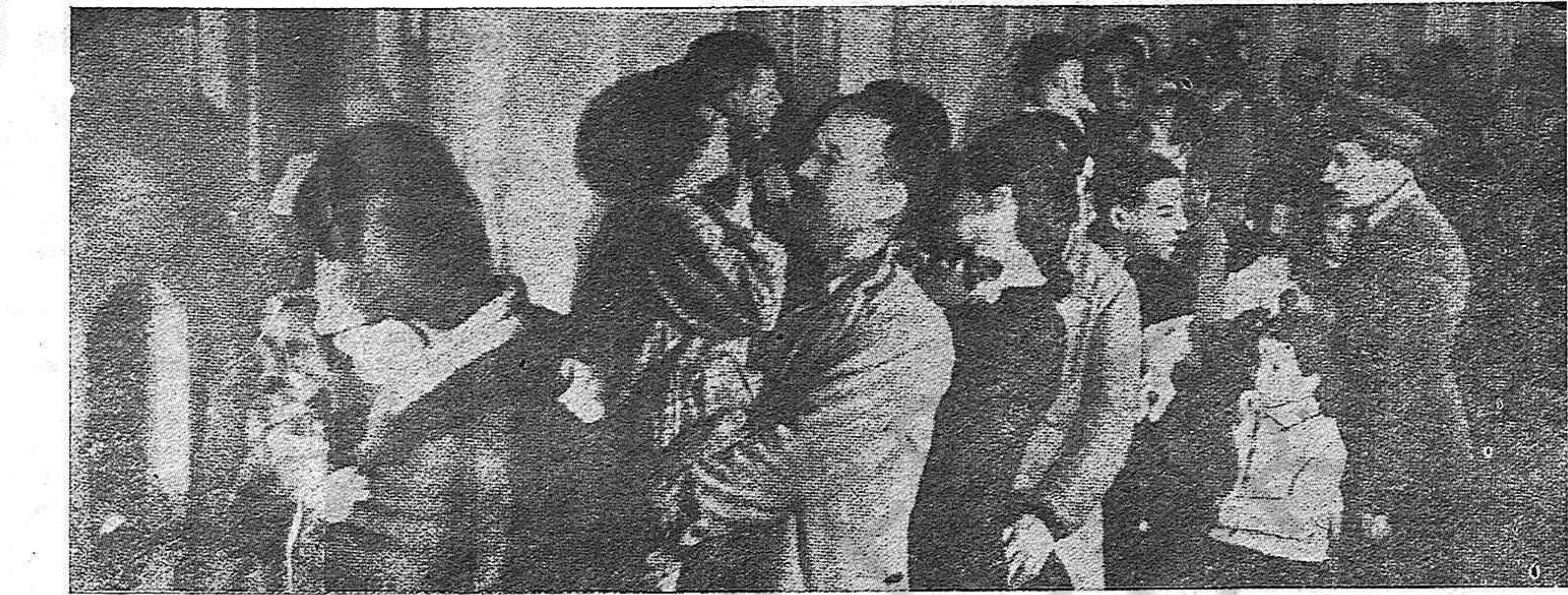
Un día de visita en las cárceles falangistas. Los presos toman en brazos a sus hijos, niños a quien la tiranía falangista ha dejado sin hogar.

Todavía son muchos más los datos que poseemos sobre la situación en Cataluña. Completaremos esta información en nuestro número próximo.