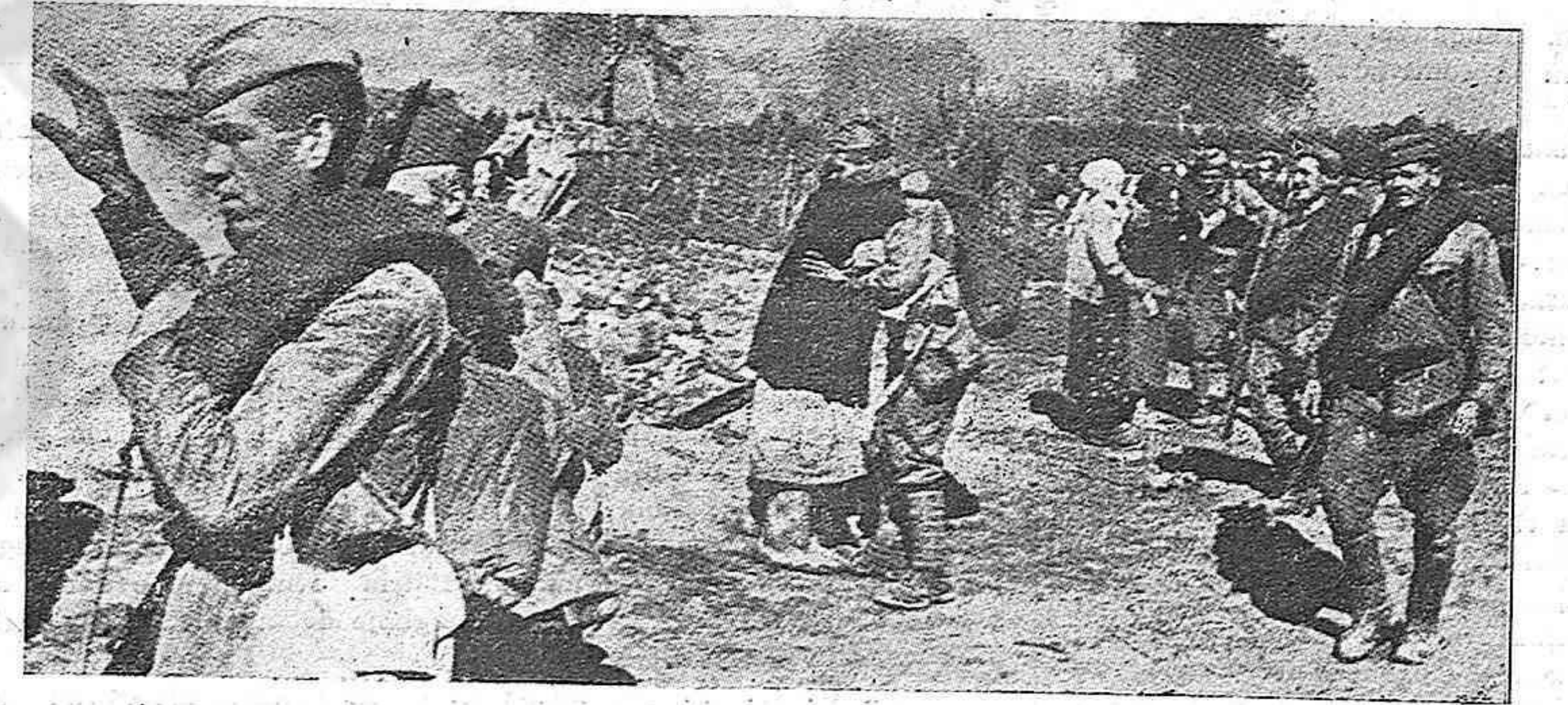
Al liberar nuevos pueblos soviéticos, los campesinos saludan con alegría y emoción a los soldados de la URSS.

Contra la política de guerra franquista y contra el régimen se levanta la oposición de la inmensa mayoría del país. Las más diversas fuerzas sociales y políticas ponen de manifiesto su oposición contra la supeditación a los nazis y la intervención en la guerra.