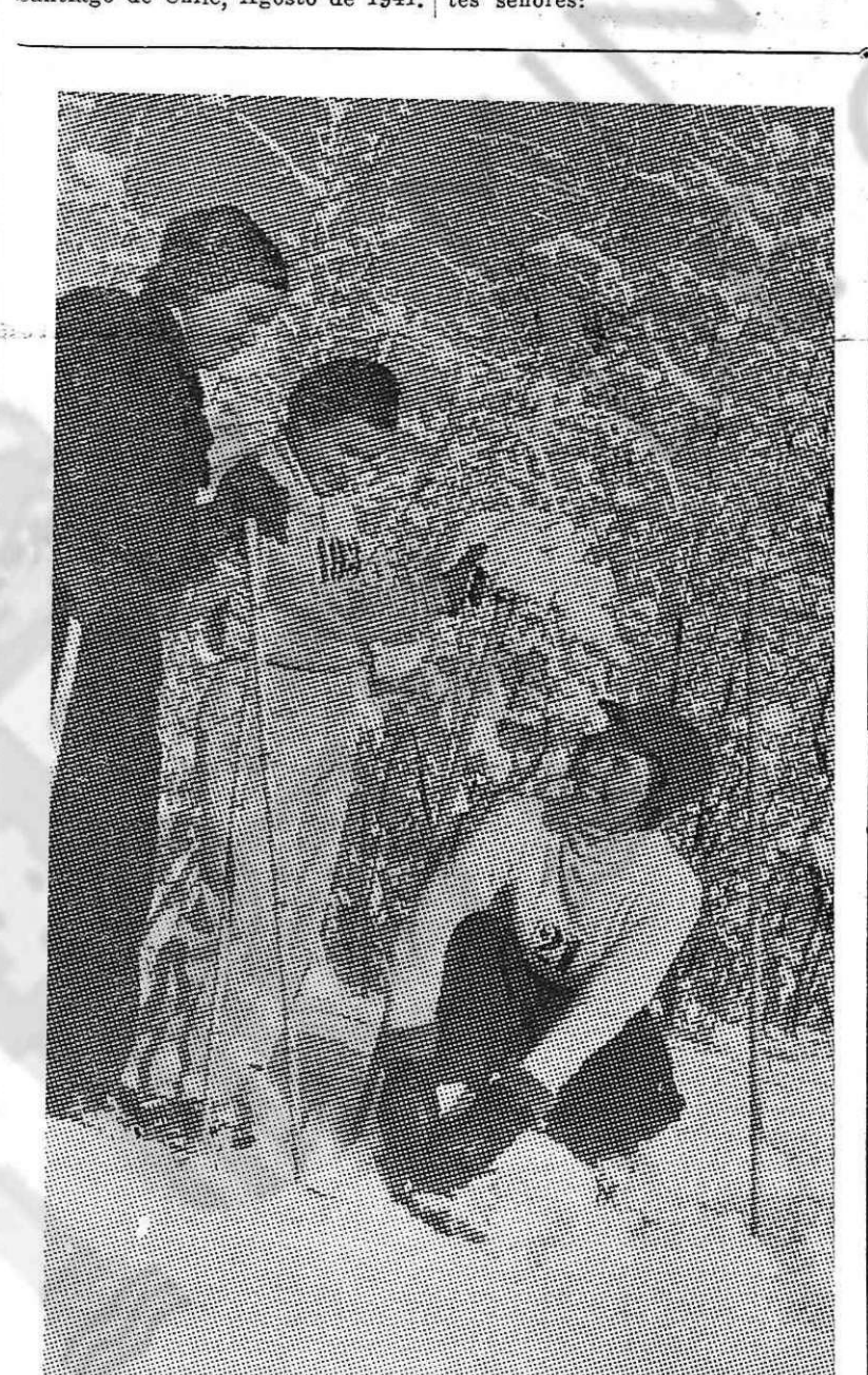
Deportistas de la Unión Soviética. Con la libertad y el bienestar de este gran pueblo quiere acabar Hitler. El pueblo soviético y todos los pueblos acabarán con Hitler.

Intelectuales españoles en Argentina desterrados por fascismo internacional expresan intelectuales soviéticos la solidaridad con su heroica lucha y su fe triunfo final que habrá de restaurar la libertad del mundo. "BERNARD SHAW.—4 WHITE HALL.—LONDRES. Intelectuales españoles en Argentina desterrados por fascismo internacional felicitan intelectuales británicos tenaz resistencia Gran Bretaña haciendo votos por el triunfo que habrá de restaurar la libertad del mundo. Firman los mensajes los siguientes señores: