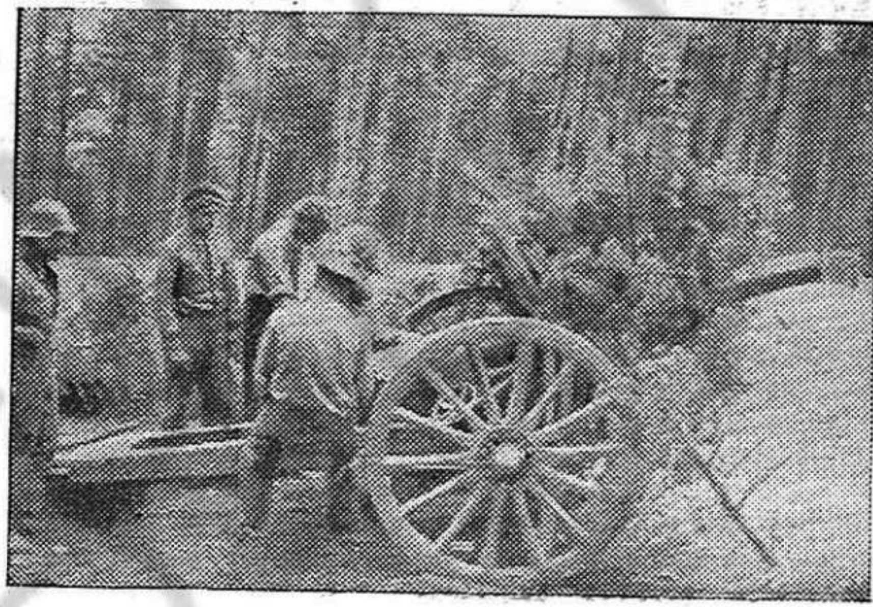
Artillería Republicana. Primeros tiempos de nuestra guerra.

dan para justificar la tardanza en ayudar a la URSS es el de que Inglaterra no está todavía lo suficientemente fuerte para una tentativa de invasión en gran escala. Pero, dijo Mc Vane, "los comentaristas aseguran que la ayuda a Rusia es un asunto de vida o muerte para Inglaterra", añadiendo que muchos ingleses están de acuerdo con el concepto soviético "de que un entrenamiento militar efectuado rápidamente por Inglaterra valdría, para Rusia, como para la Gran Bretaña misma, más que una tentativa de invadir en gran escala, digamos, a Francia, de hoy en un año".