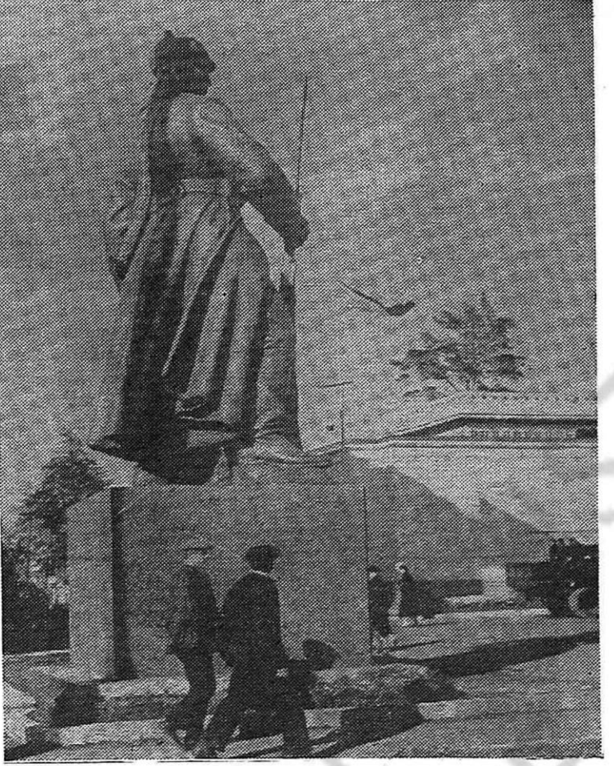
Estadua al soldado rojo, al soldado soviético cuyo heroísmo es hoy admiración y esperanza del mundo.

En un importante discurso, pronunciado en el XVII Consejo Nacional de la CTM, celebrado últimamente en México, el Lic. Lombardo Toledano, en nombre de la (Pasa a la página 4)