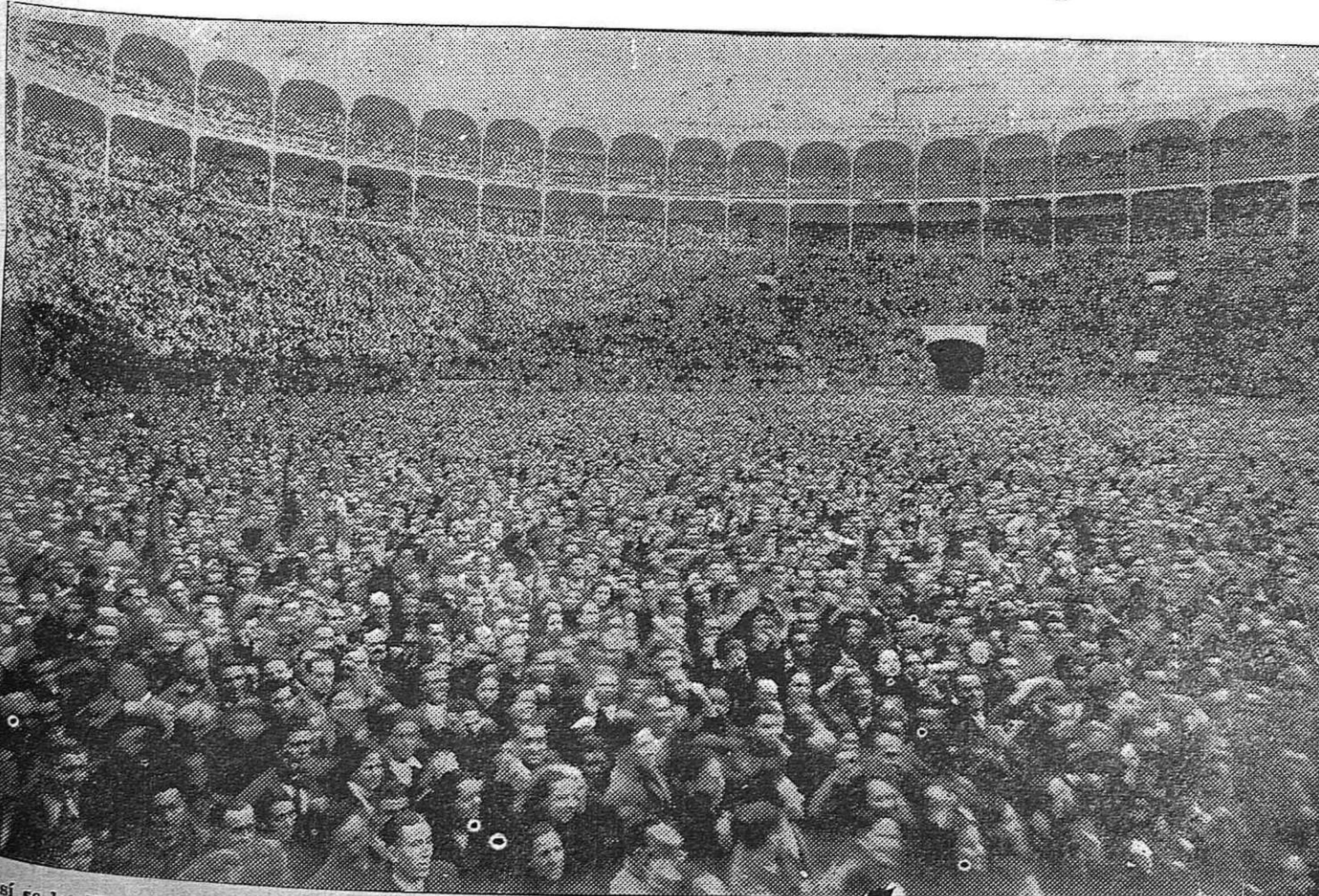
Así se les liberó. Fue el pueblo con su acción unida quien los sacó de las cárceles en Febrero de 1936. He aquí un aspecto de la Plaza Monumental de Madrid durante el histórico y grandioso mitin pro-amnistía celebrado en los días de Febrero de 1936. Ahora el pueblo también libertará a sus dos millones de presos. ¡NI UNA TREGUA EN LA LUCHA POR LA AMNISTÍA!