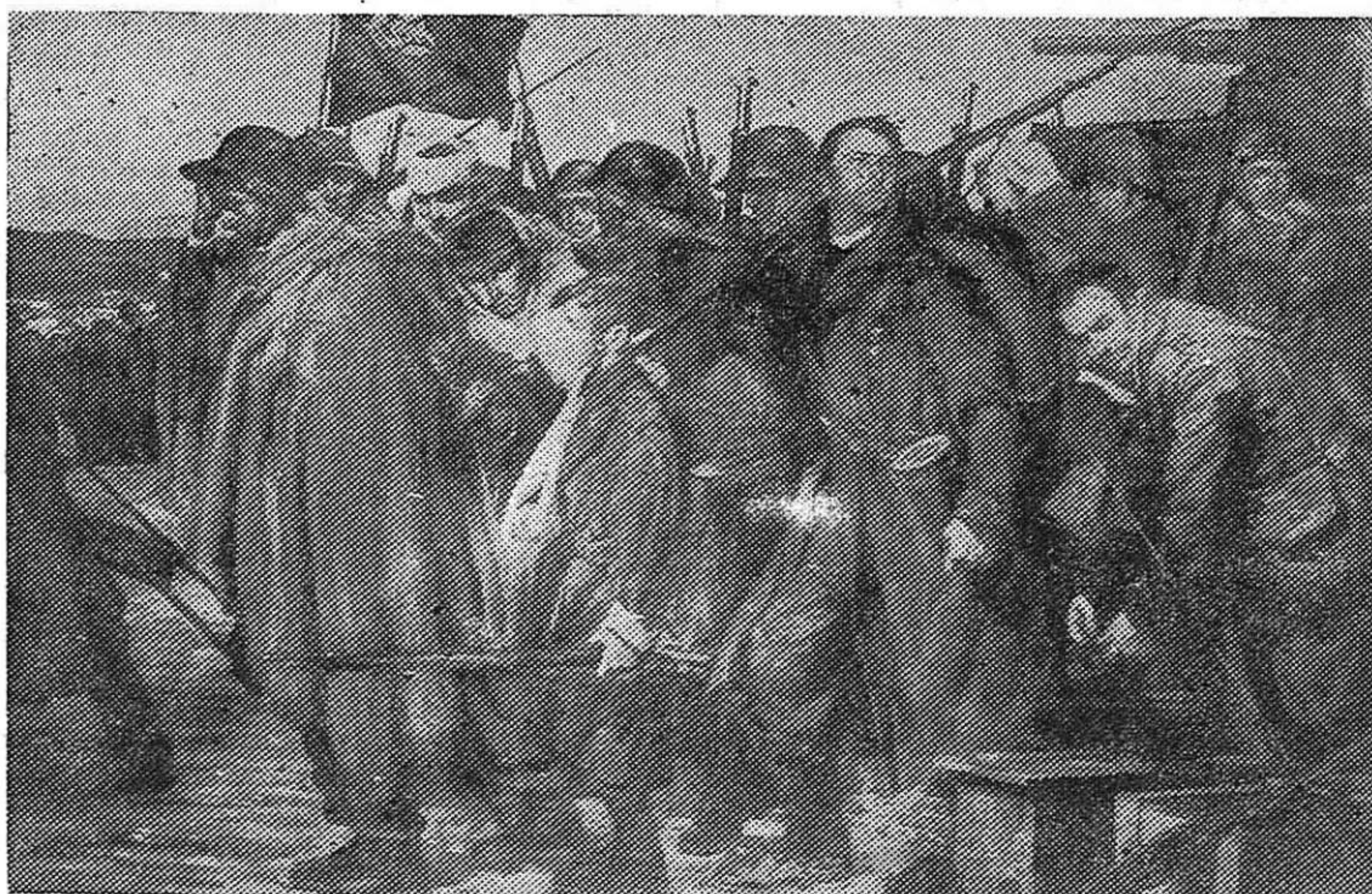
LA RETIRADA, cuadro últimamente expuesto en México, original del pintor español José Bardasano, combatiente de la guerra de España. El arte de Bardasano ha captado todo el dolor y toda la rabia de nuestros soldados y nuestro pueblo en aquellos días trágicos de la retirada de Cataluña.

ta peregrinación de miles de familias enteras, de pueblos enteros en movimiento por las carreteras que llevaban a la frontera francesa, una conciencia política, una capacidad de sacrificio asombrosas? Además, ¿es que el Ejército y el pueblo que vivía en la zona de Franco no estaba también cansado de la guerra? En fin, resulta que los que hablaban del cansancio de la guerra eran los emboscados que no la habían hecho, o que la habían tomado como negocio. Y en cambio los que habían sufrido la acción del enemigo, los que habían entregado su vida a la lucha llenos de fe en los destinos de nuestro pueblo, esos no estaban cansados, esos querían ganar la guerra, esos no querían que toda España fuese una gran cárcel como lo es hoy.