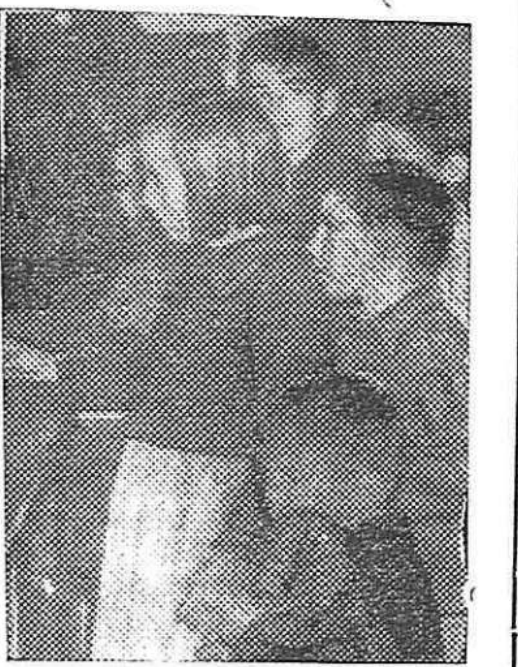
Niños españoles en Auxilio Social. Rostros de hambre, de dolor, de odio.

maquinaria, semillas, etc. Todo esto tendría que ser resuelto en grado considerable por los Comités Pro-Refugiados Españoles que existen en los diversos países y donde hay posibilidades para recoger fondos y ayuda de todo género para el mejor logro de este importante proyecto. Los organismos de la emigración española también deben prestar su concurso a esta obra meritoria que amplía las perspectivas liberadoras de nuestros hermanos recluidos en los campos de Francia.