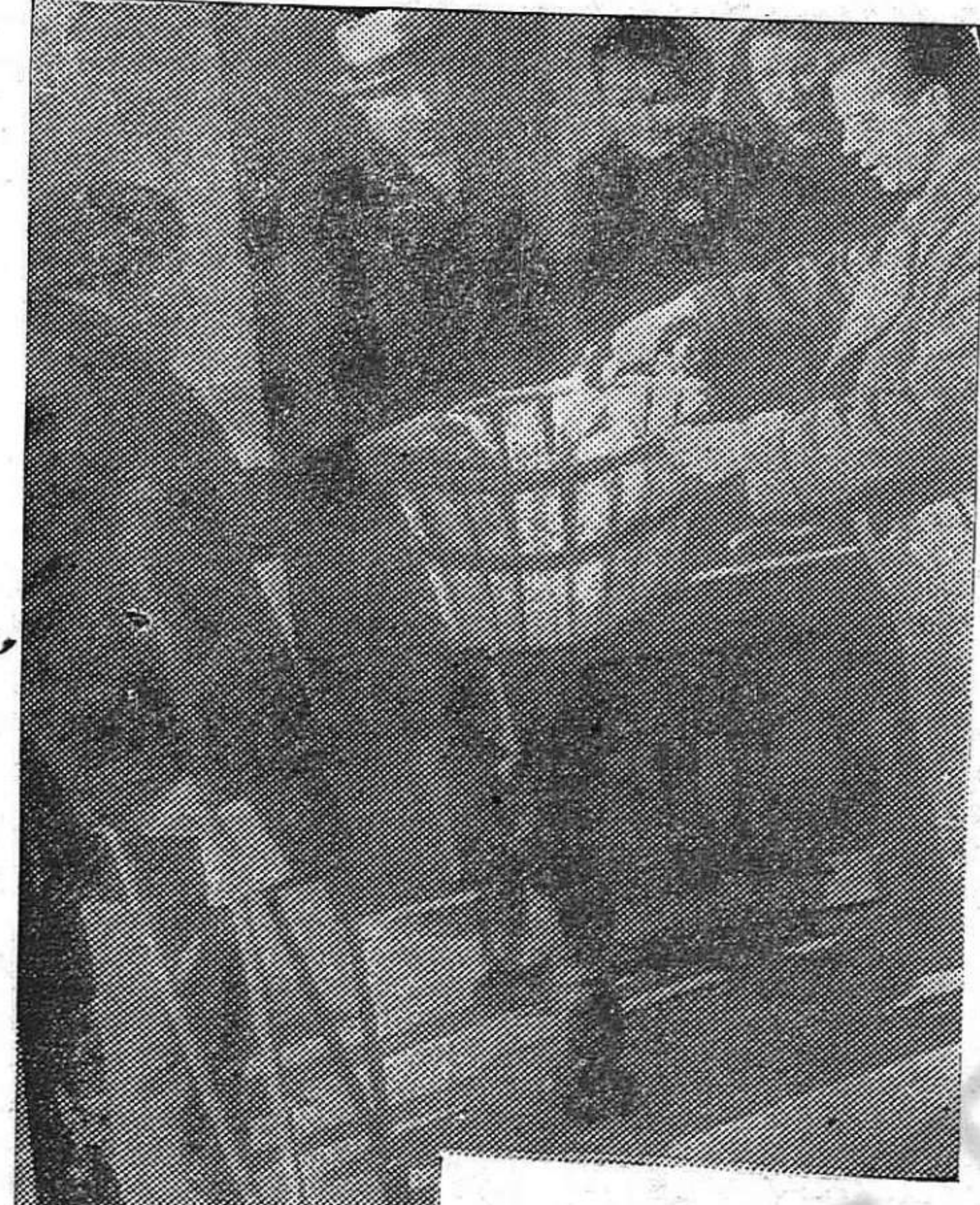
Mendicidad en la Nochebuena del pueblo español. La foto es de A. B. C. que ha publicado en estos días docenas de estampas de miseria y opresión.