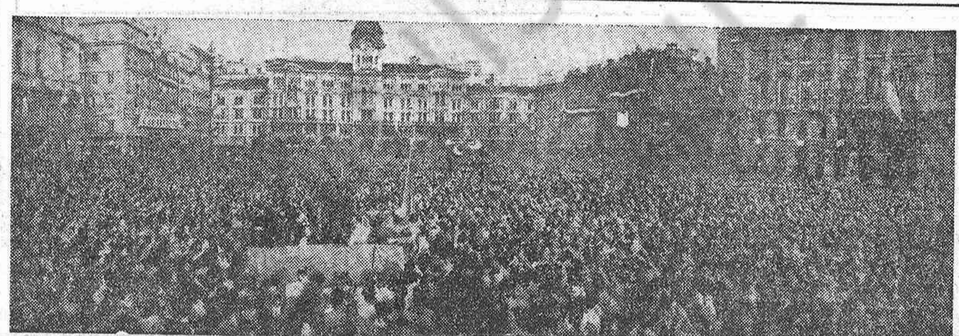
Vista de la plaza de la Unidad de Trieste durante el grandioso mitin organizado el 2 de junio por el Partido Comunista.

GRECIA Al tiempo que el Ejército Democrático sigue cosechando triunfos en las diversas zonas de lucha, los dirigentes democráticos intensifican su esfuerzo en favor de una solución pacífica de la guerra sobre bases justas.