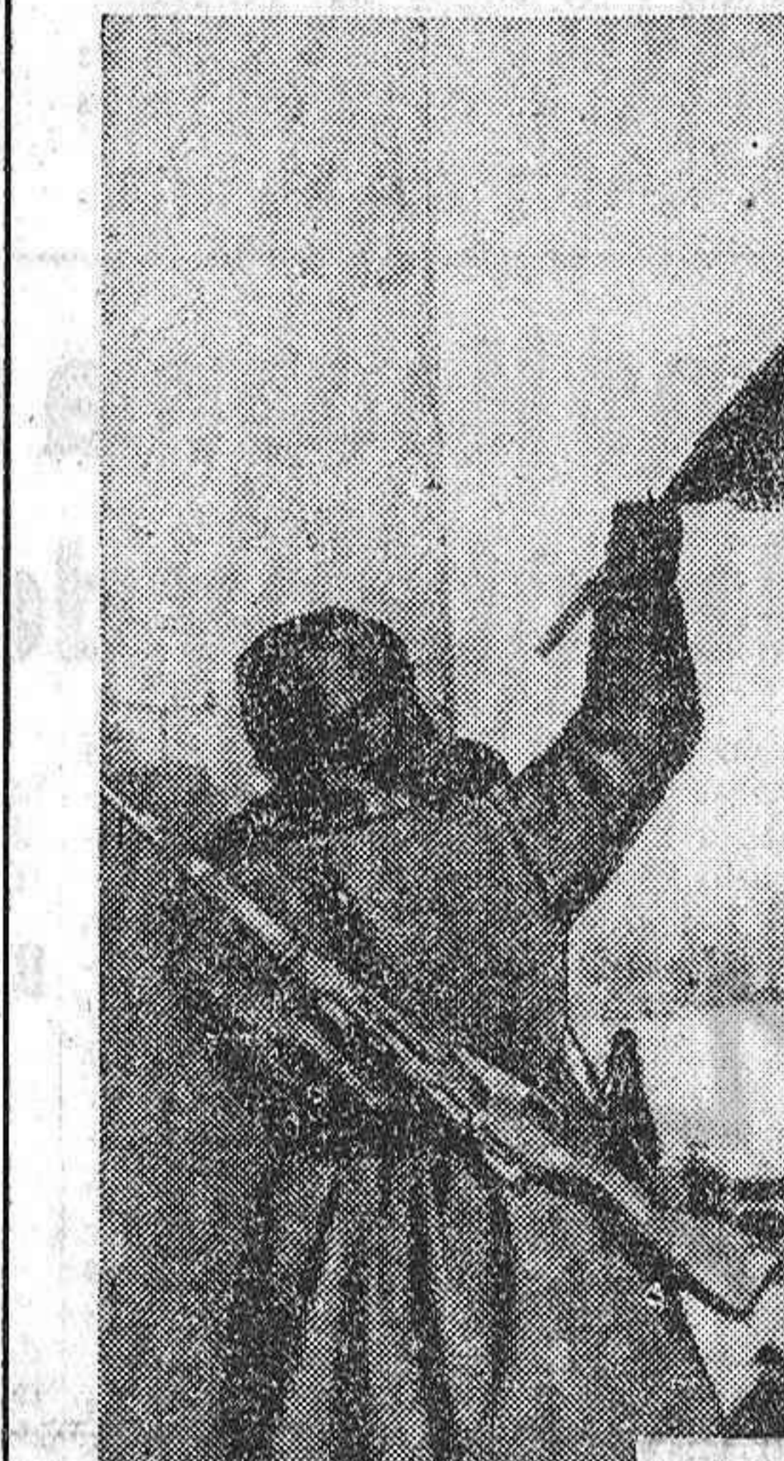
Stalingrado es, por eso mismo, uno de los más altos símbolos de lo mucho que debe la Humanidad a esa abnegación sin límites...