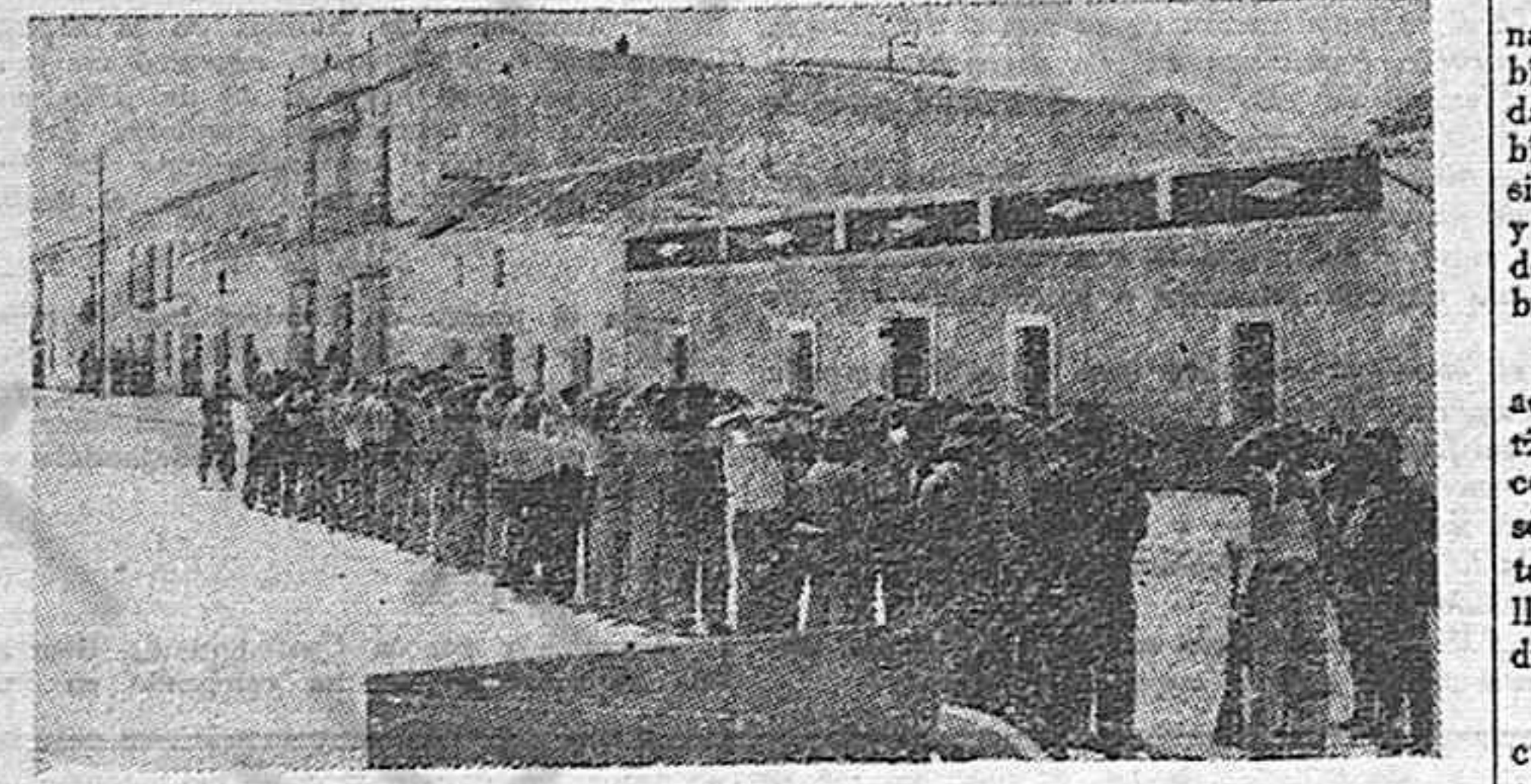
Julio de 1936. Comenzaba el desencadenamiento del terror con el que Franco, diez años después, sigue ensangrentando a Sevilla y a toda España. He aquí un grupo de campesinos de Urbión (Sevilla) detenidos y fusilados por las hordas franquistas en los primeros días de la sublevación.

La Policía falangista no ha logrado descubrir a los valerosos realizadores de estas acciones. La población donostiarra ha saludado con júbilo las audaces manifestaciones republicanas de estas jornadas.