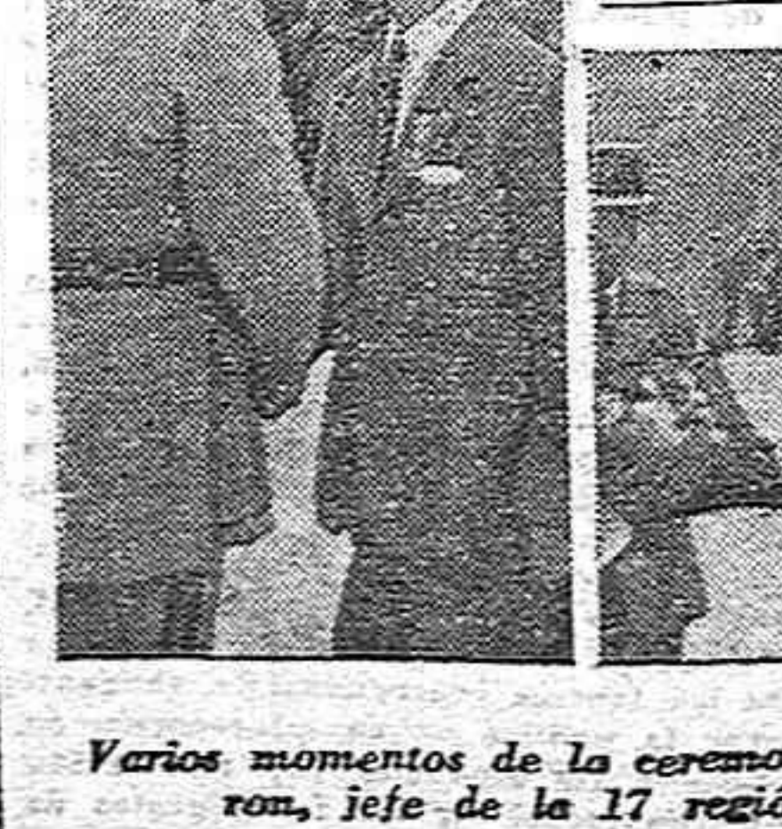
Varios momentos de la ceremonia que tuvo lugar el 14 de julio ante el Monumento a los Muertos en Toulouse, durante la cual el general Bergon, jefe de la 17ª región militar, condecoró con la cruz de Guerra francesa a un grupo de camaradas nuestros por su lucha heroica en la Resistencia.

Guerrilleros españoles condenados por su lucha en la liberación de Francia. (Información en la página 3).