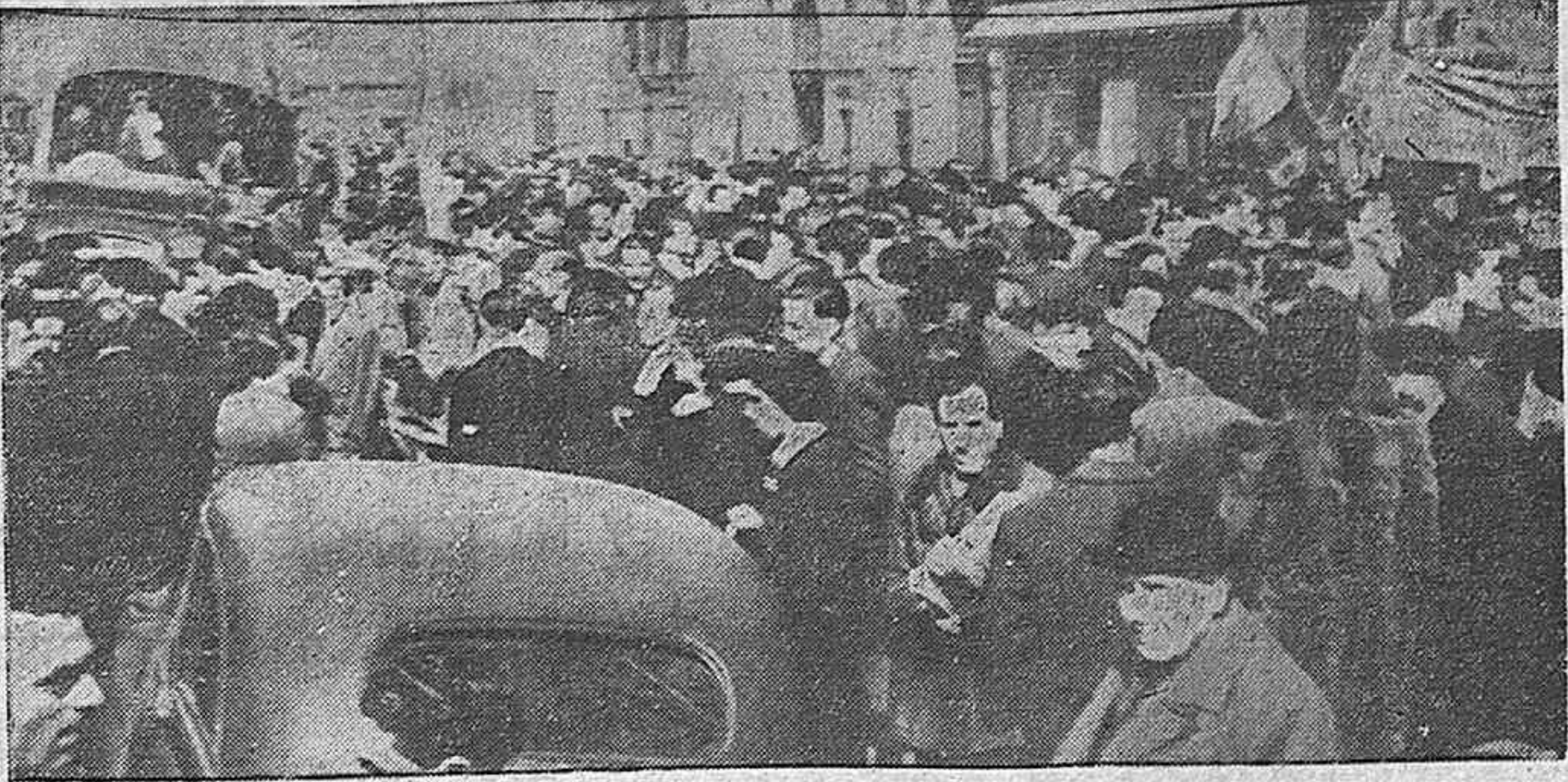
Miles de españoles acudieron en Toulouse al acto de homenaje a la memoria de José Díaz.

En las ciudades son muchos los pequeños comerciantes que protestan contra las multas despiadadas que se les impone. La indignación de las masas se exterioriza ya en algunos lugares, como en Barcelona, Valencia, etc.