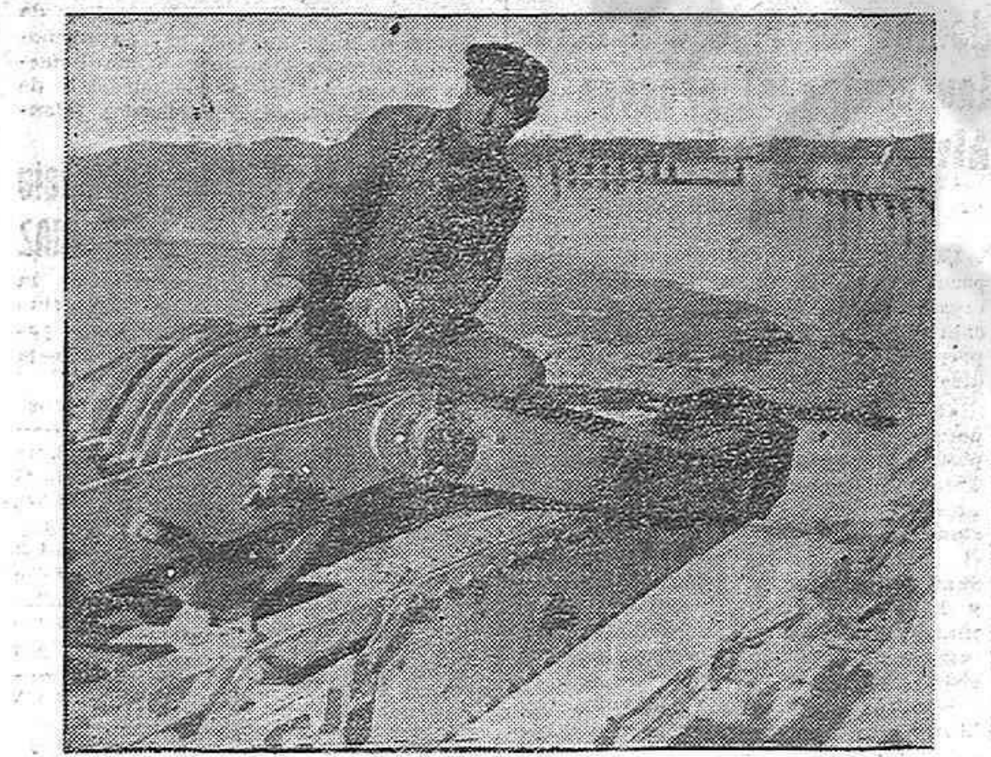
Avanza la reconstrucción del Dnieprostroi.

Esta es la pura verdad, y las masas democráticas de todos los países tendrán que poner en tela de juicio la conducta de los Gobiernos de Estados Unidos y Gran Bretaña en tanto que sigan produciendo actividades políticas tan contradictorias como las que señalamos en los casos del Irán y la España de Franco.