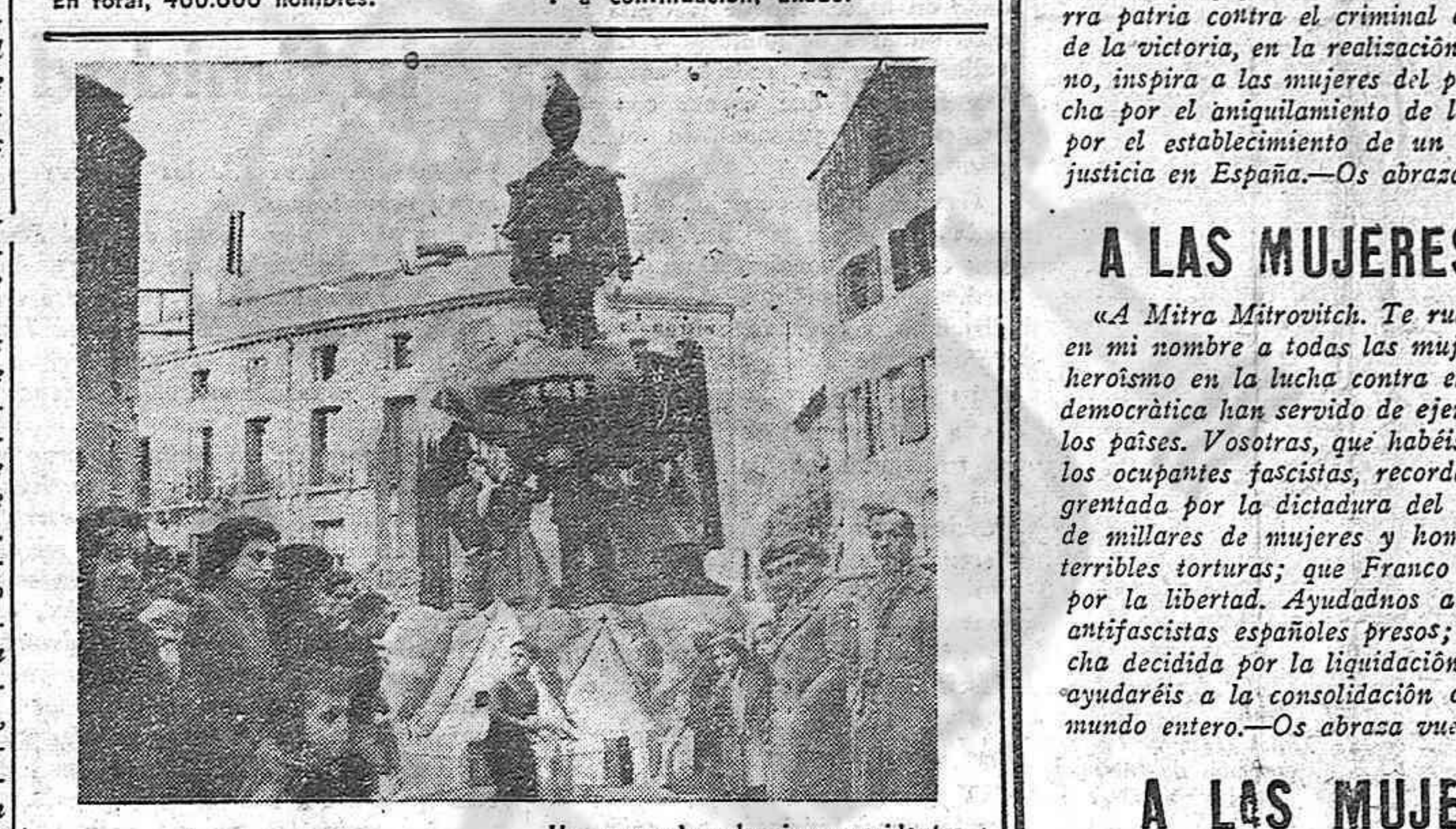
Un grupo de valencianos residentes en Perpignan han organizado una fiesta con el lema «Cromem a Franco».

«L'Humanité» del 15 de marzo publica un mapa descriptivo de la distribución de fuerzas franquistas a lo largo de la frontera pirenaica. Acompañando esta exposición sobre el plano, el camarada Georges Cogniot da en un artículo una serie de datos que testimonian con claridad la gran movilización de fuerzas efectuada por Franco, y la provocación evidente que su establecimiento en la frontera significa para la Francia democrática.