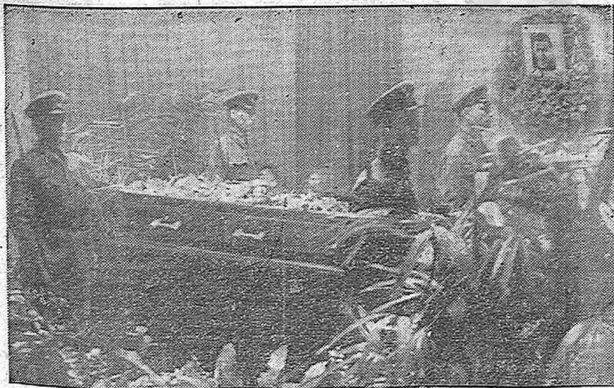
En torno al feretro de José Díaz, el gran dirigente del pueblo español, monaron guardia de honor los oficiales del Ejército Rojo, del Ejército que ha destruido a las hordas del fascismo y ha salvado a la Humanidad.