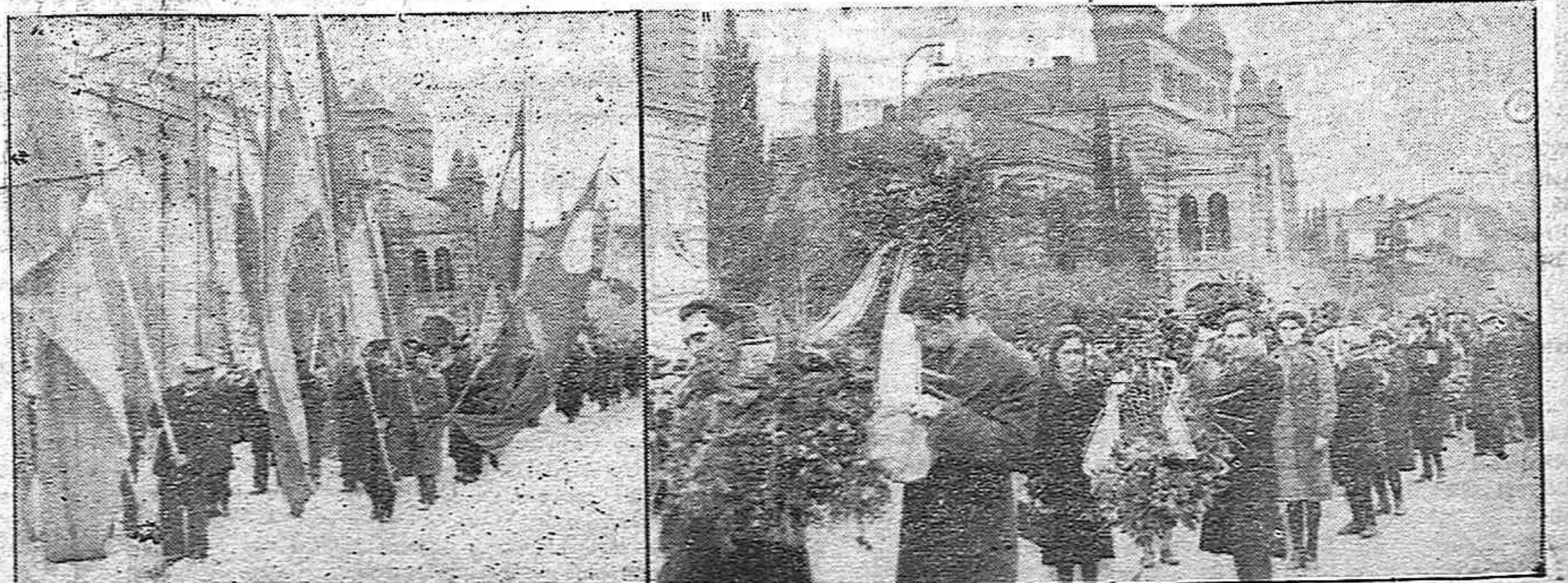
Trabajadores con banderas, mujeres con flores, todo el pueblo de Tibilis, en una emocionante manifestación de solidaridad, expresó su dolor por la muerte del gran dirigente de nuestro pueblo.

El Partido Comunista es el Partido de la unidad; es el Partido de la resistencia, que sigue la senda trazada por José Diaz bajo la firme dirección de Dolores Ibarruri, plenamente convencido de que la unidad de todas las fuerzas obreras y republicanas es una necesidad vital de la lucha por el derrocamiento del régimen de Franco y Falange y acelerar el restablecimiento de la democracia en España, basada en la voluntad libremente expresada del pueblo.