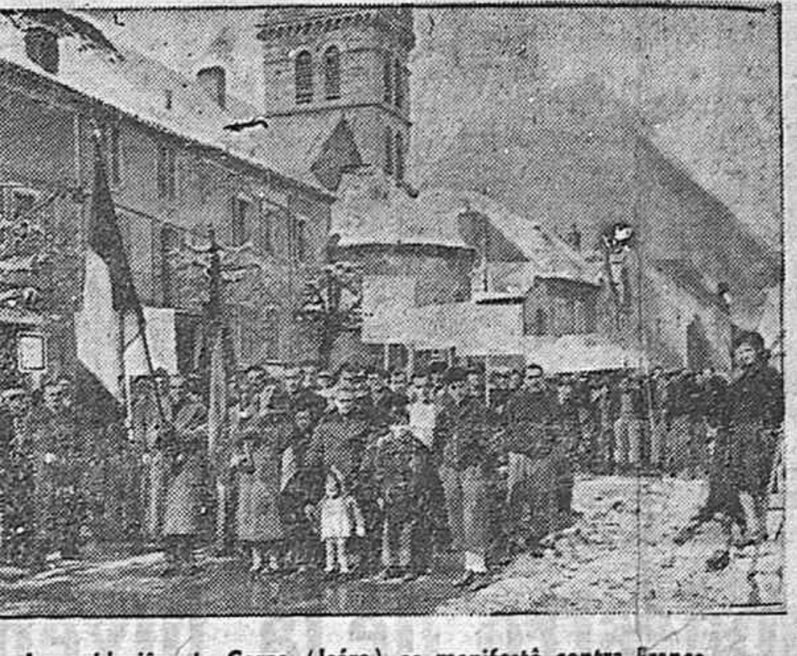
La población de Corps (Isère) se manifestó contra Franco.

Una información más completa de este acontecimiento político daremos a nuestros lectores en el número de la próxima semana.