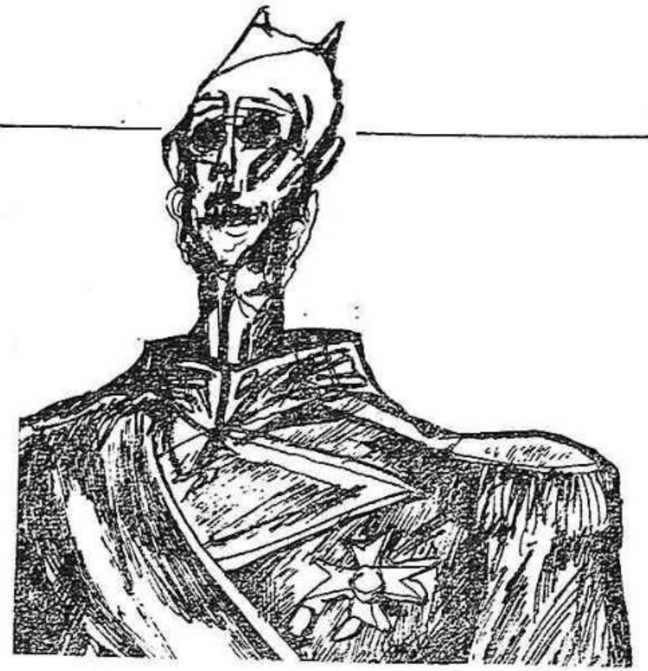
(dibujo de Posada)

Blanco particular del «Plan Lucero» son los dirigentes y militantes