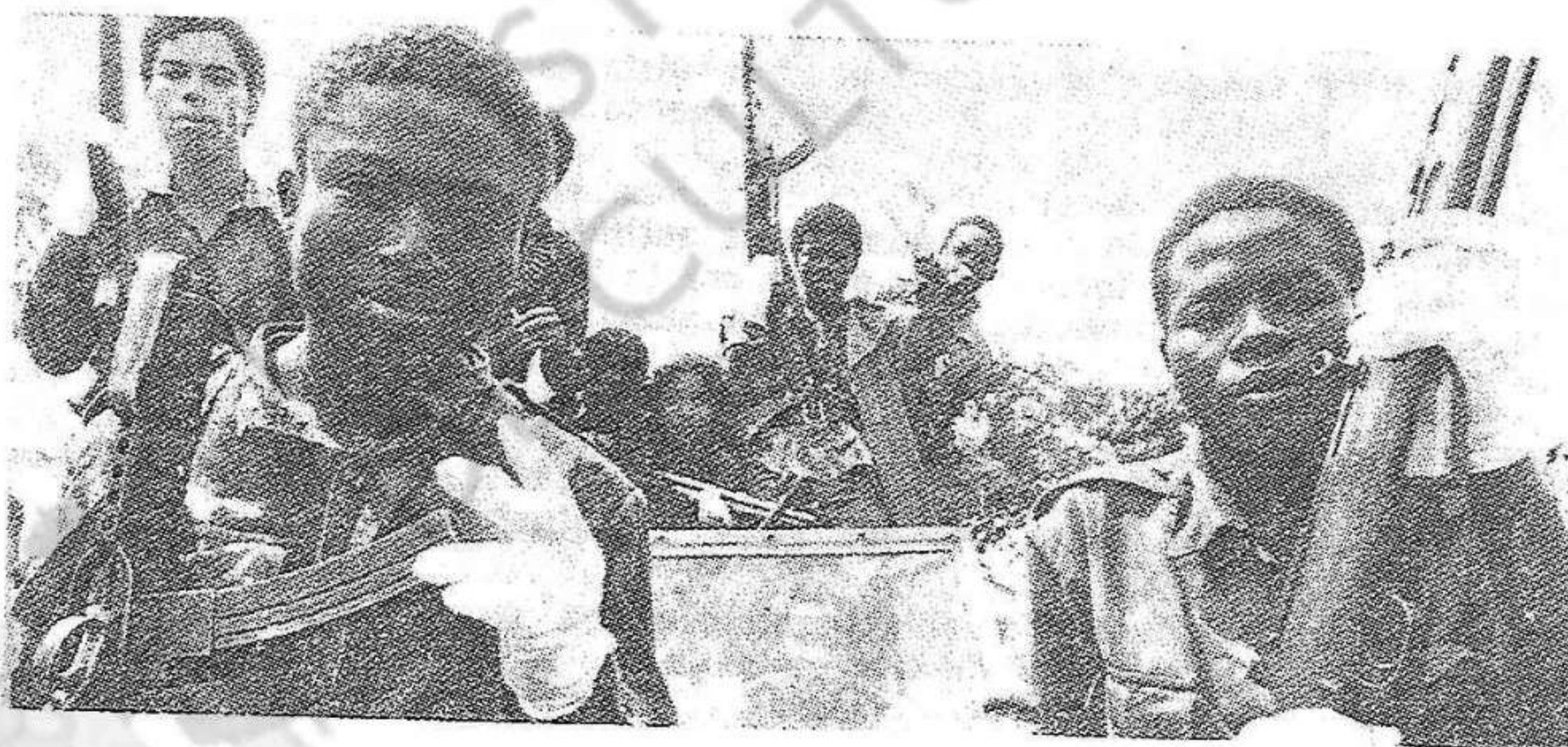
Combatientes del MPLA

El F.N.L.A. depende, en lo esencial, del Zaire de Mobutu y en forma más o menos indirecta de Estados Unidos... y de China... ¡Curiosa y lamentable convergencia! Mientras que la U.N.I.T.A. parece no existir