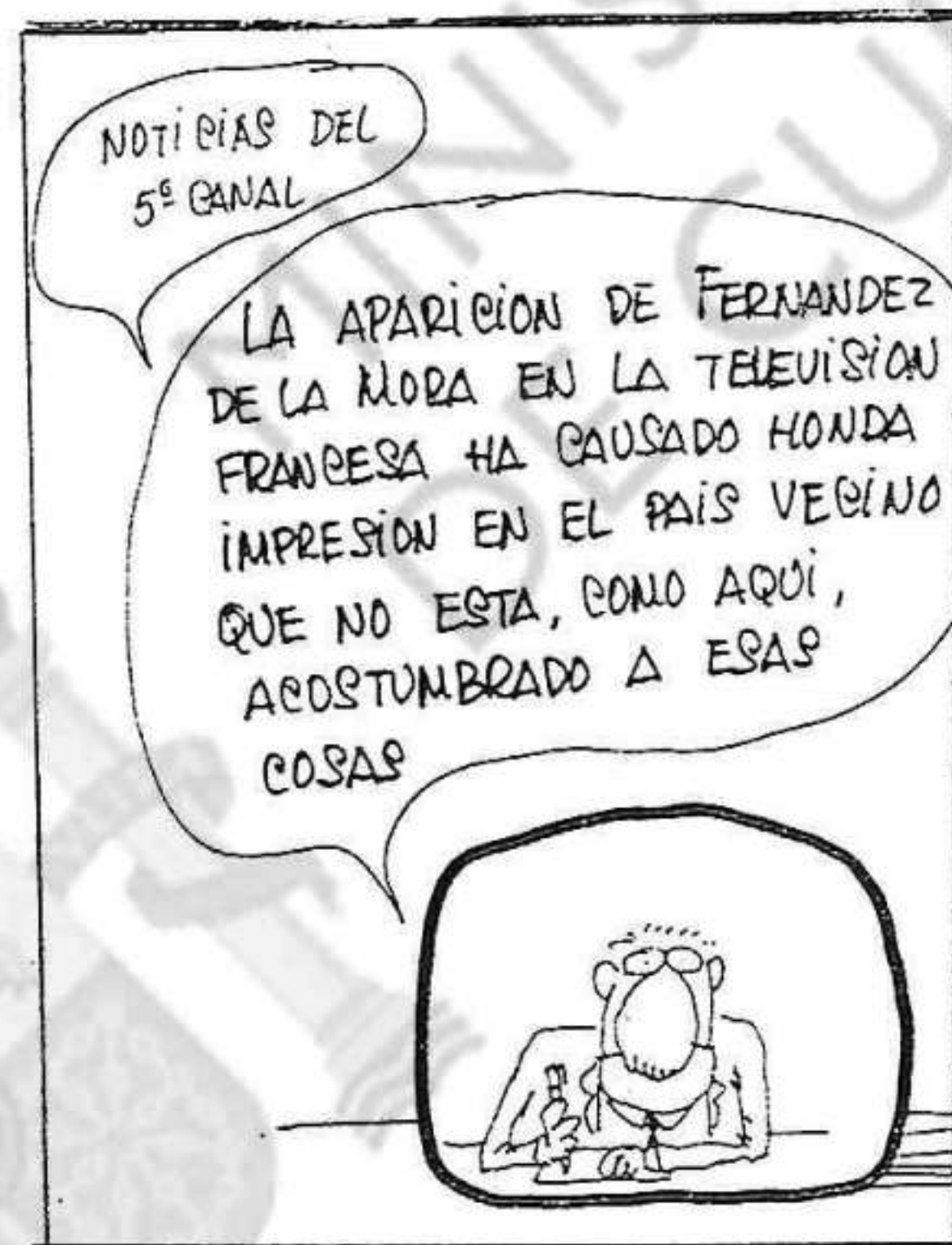
(Perich, en «Por Favor»)

Sabemos que es mucho lo que se hace y muchísimo más lo que se ra-