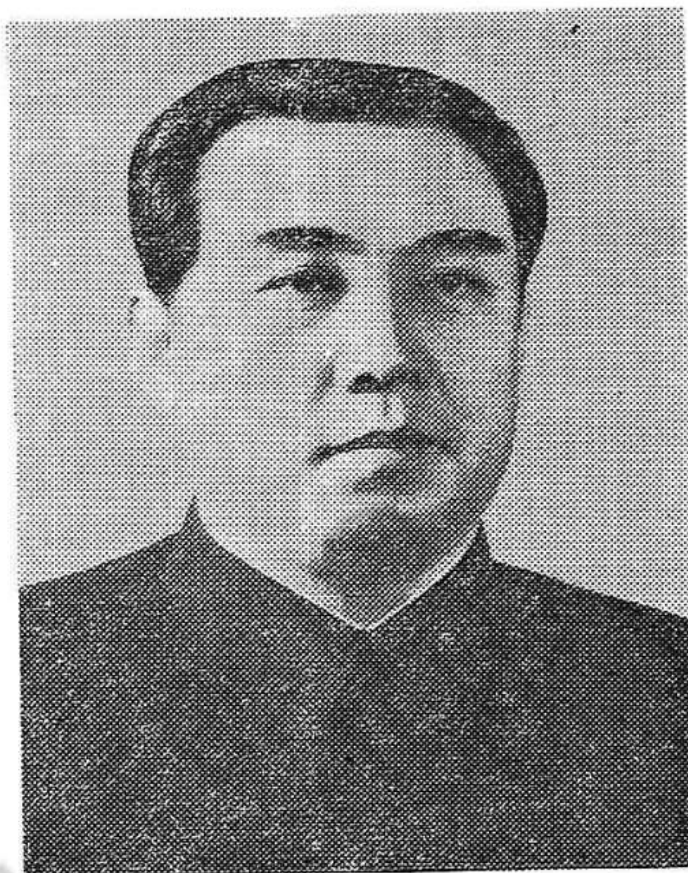
KIM IL SUNG