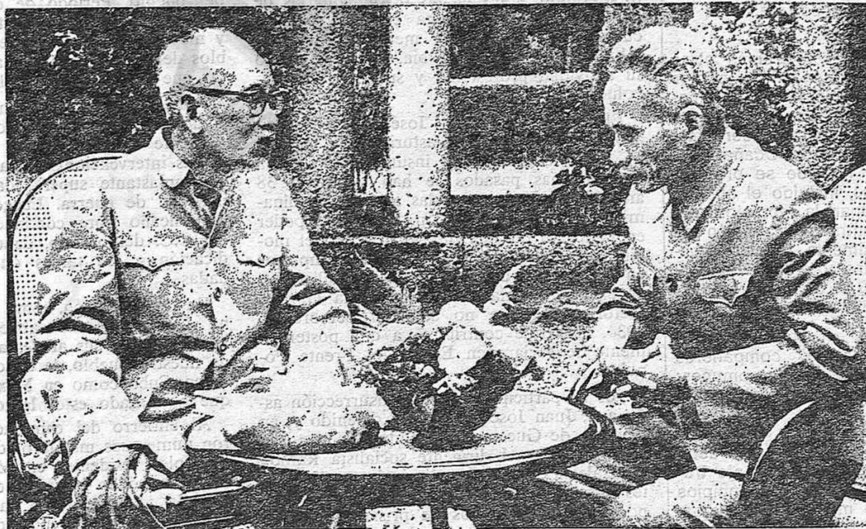
HO CHI MIN