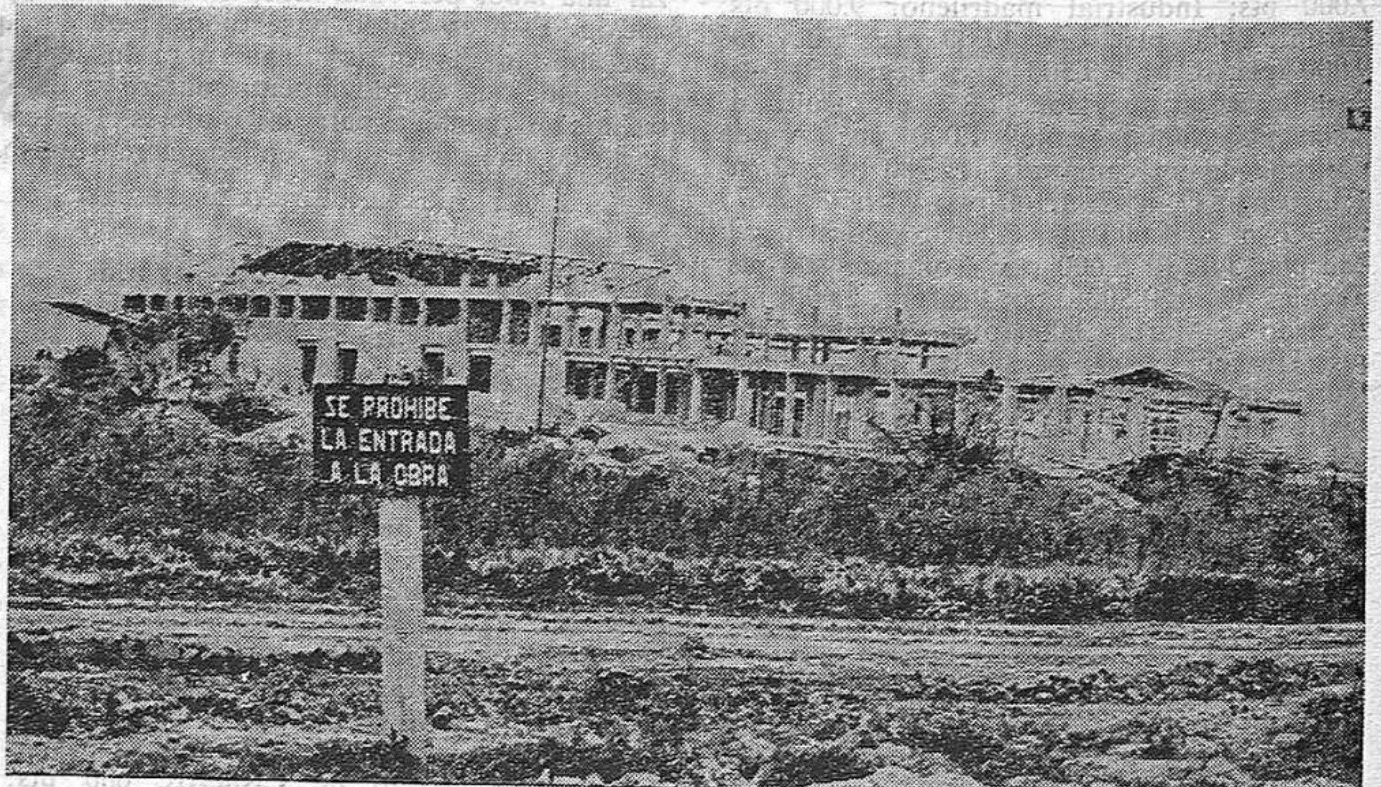
«Se prohíbe la entrada...» de los campesinos expropiados

Muchos millones en danza. Ahí está el por qué de la expropiación de las tierras de esos agricultores valencianos —a los que hace ya un año se ha llegado a cortar el agua para el riego de sus huertos. Millones de pesetas ahora y mucho más después, cuando MERCAVALENCIA funcione. Y detrás, el Ayuntamiento, los beneficiarios del régimen. Ese Ayuntamiento que ha infringido incluso las leyes al ordenar la ejecución de las obras antes de que el Tribunal Supremo haya fallado en el recurso que contra las expropiaciones han alzado las víctimas.