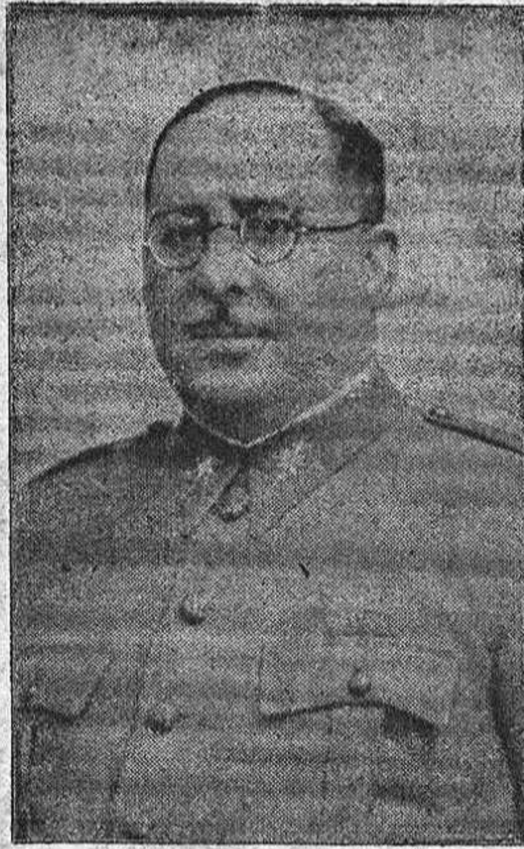
EL LAUREADO GENERAL ARANDA, QUE AL FRENTE DEL CUERPO DE EJERCITO DE GALICIA HA OCUPADO LA CIUDAD DEL TURIA

Continúan recibiendo millares de telegramas de toda España y del extranjero, con motivo de la liberación de Madrid. De Portugal son muchísimos los que se reciben.