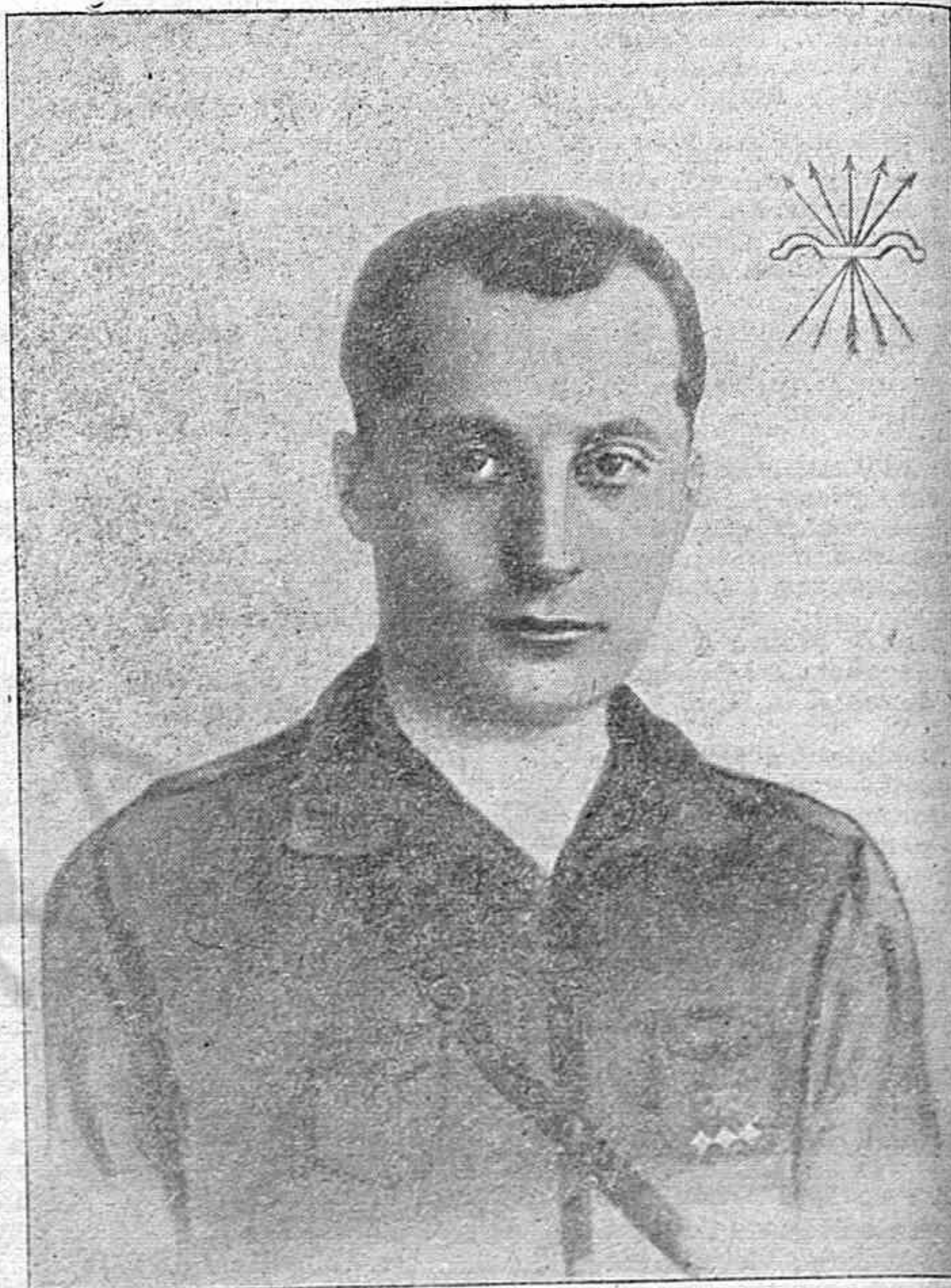
José Antonio Primo de Rivera

Los españoles hemos de entregar ahora a una apremiante labor colectiva: la de elevar, engrandecer y fortalecer a España