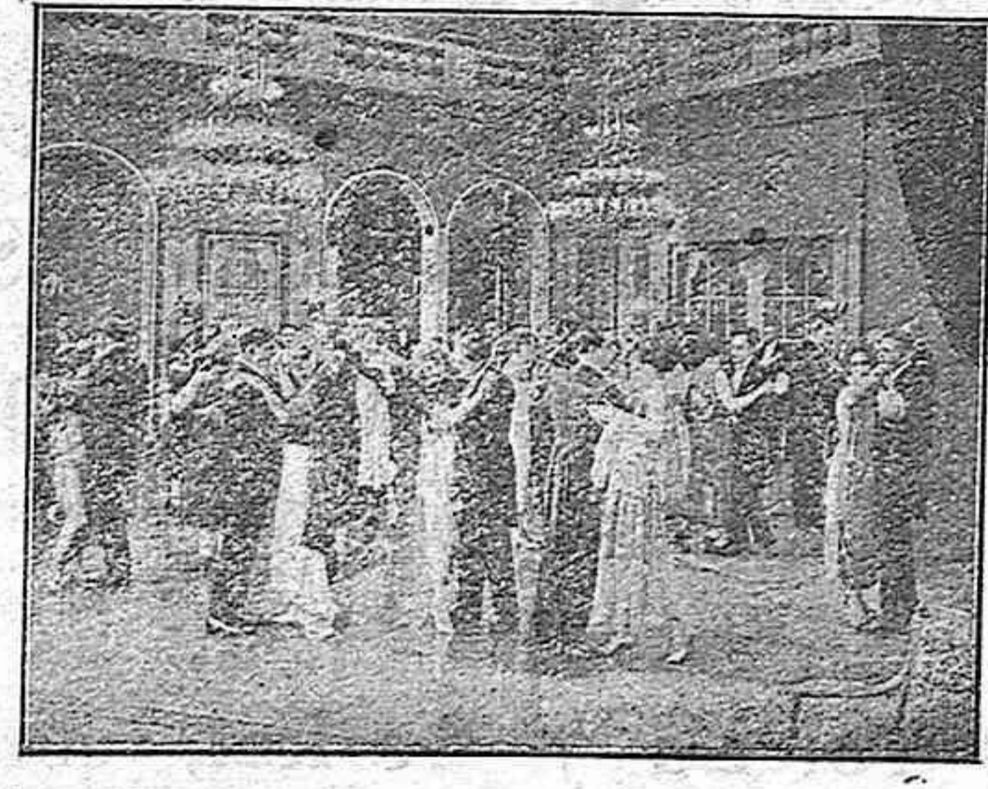
Una interesante escena de la película «¿Deben tener hijos los pobres?»