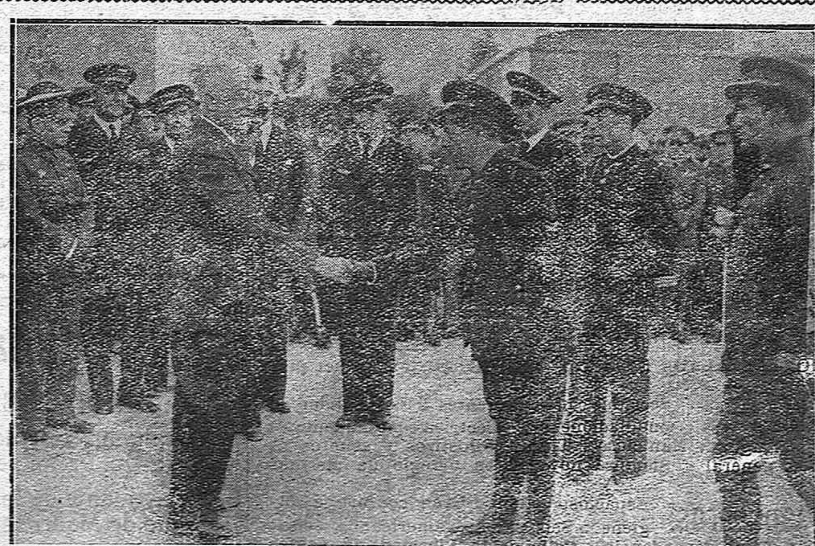
GETAFE: El Presidente de la República, felicitando a un cabo del cuerpo de aviación, que pilotaba un avión de los ganadores en la Vuelta a España