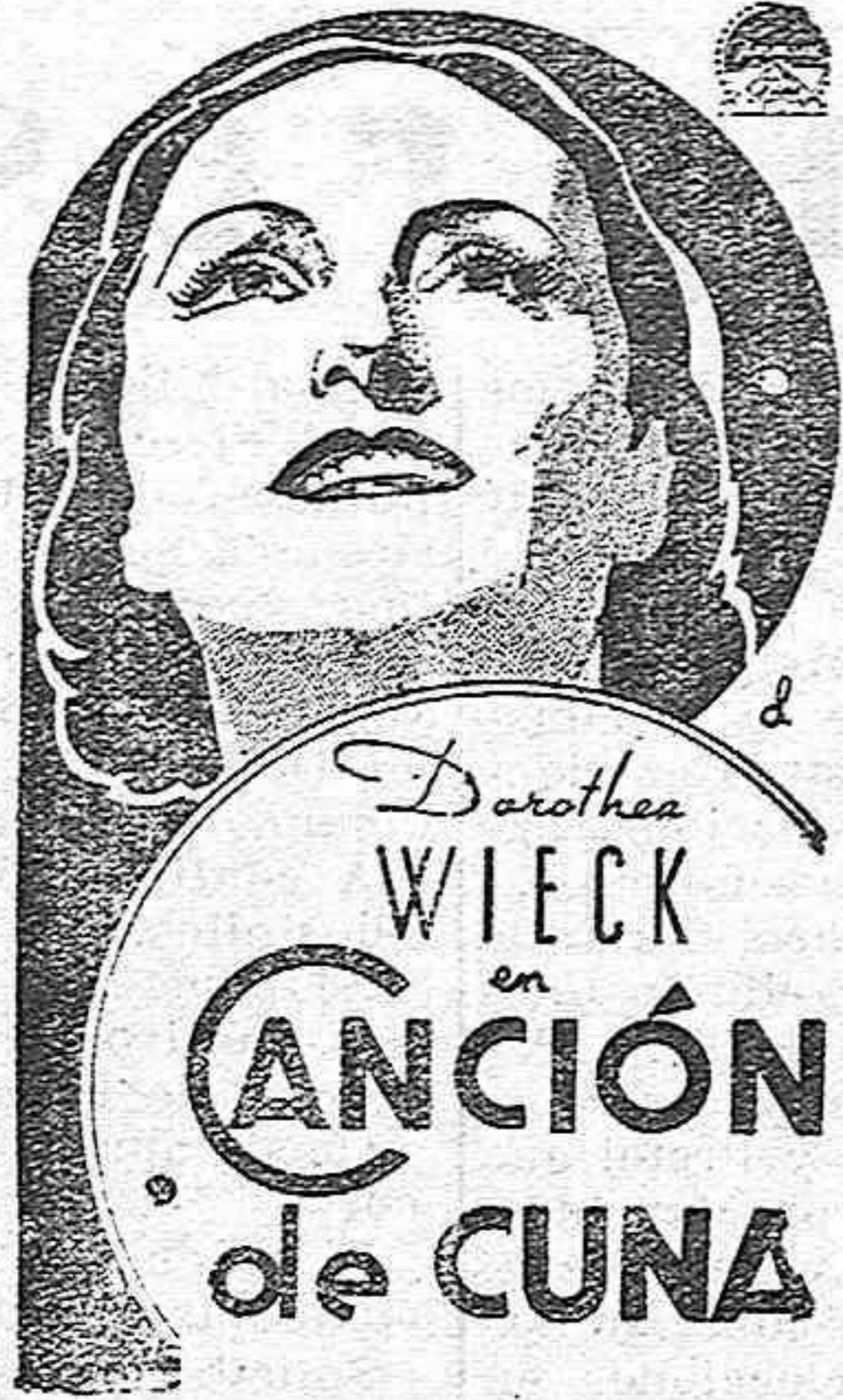
Hablada en español

Un film que encierra tesoros de emoción humana. Una película sutil, plena de encanto y de ternura, realizada por el arte maravilloso de DOROTHEA WIECK