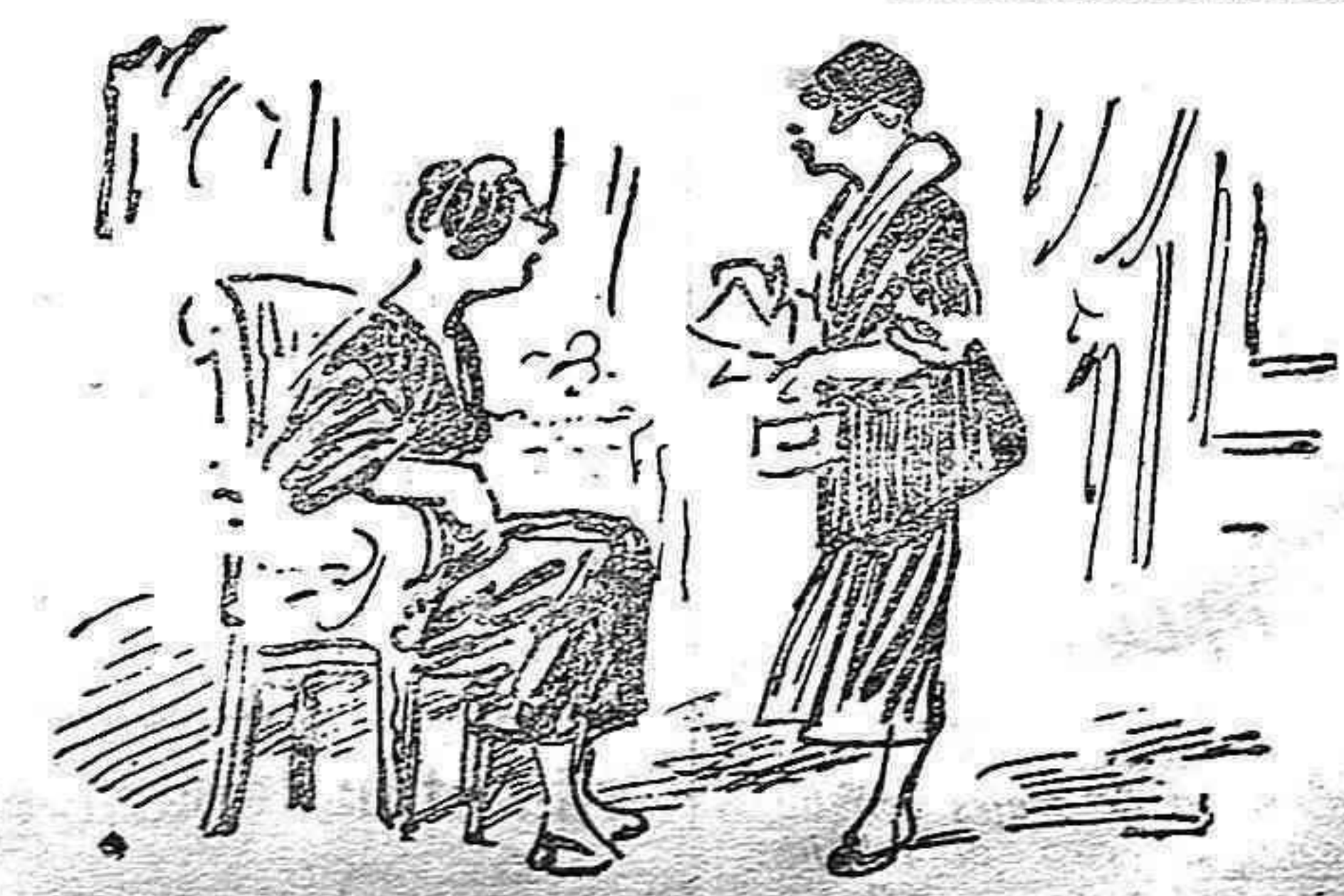
LA SEÑORA.—¿Trae usted certificados de las casas en que ha prestado sus servicios? —¡Ya lo creo! Aquí tiene usted treinta y dos años.

CABREIROA Códigos hepáticos-nefríticos Hoteles Balneario Abiertos 1.º Julio a 30 Septiembre