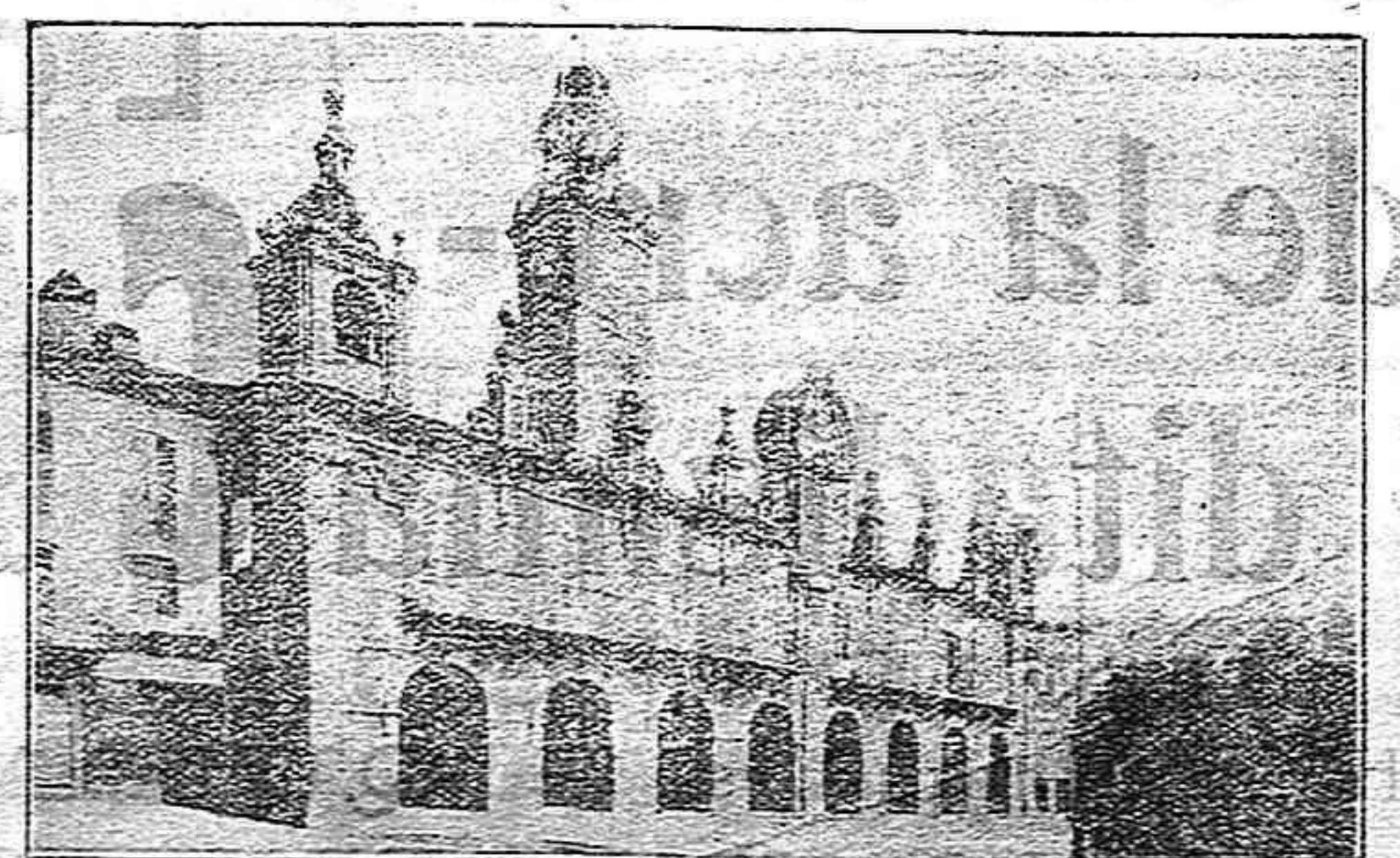
Fachada principal de la Casa Consistorial