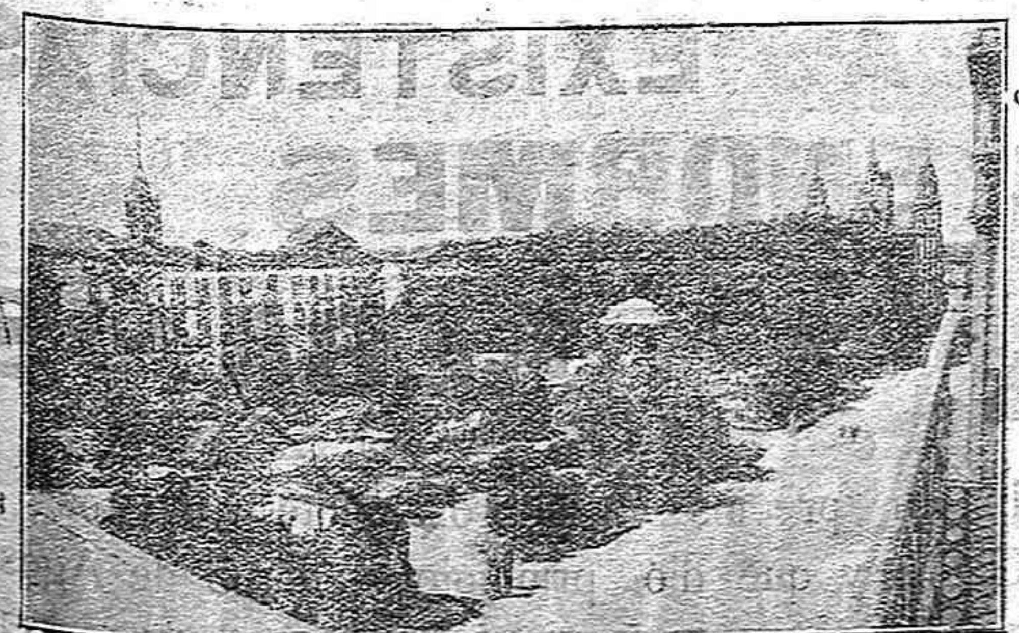
Jardines de la Plaza de la Constitución. Al fondo, la Catedral