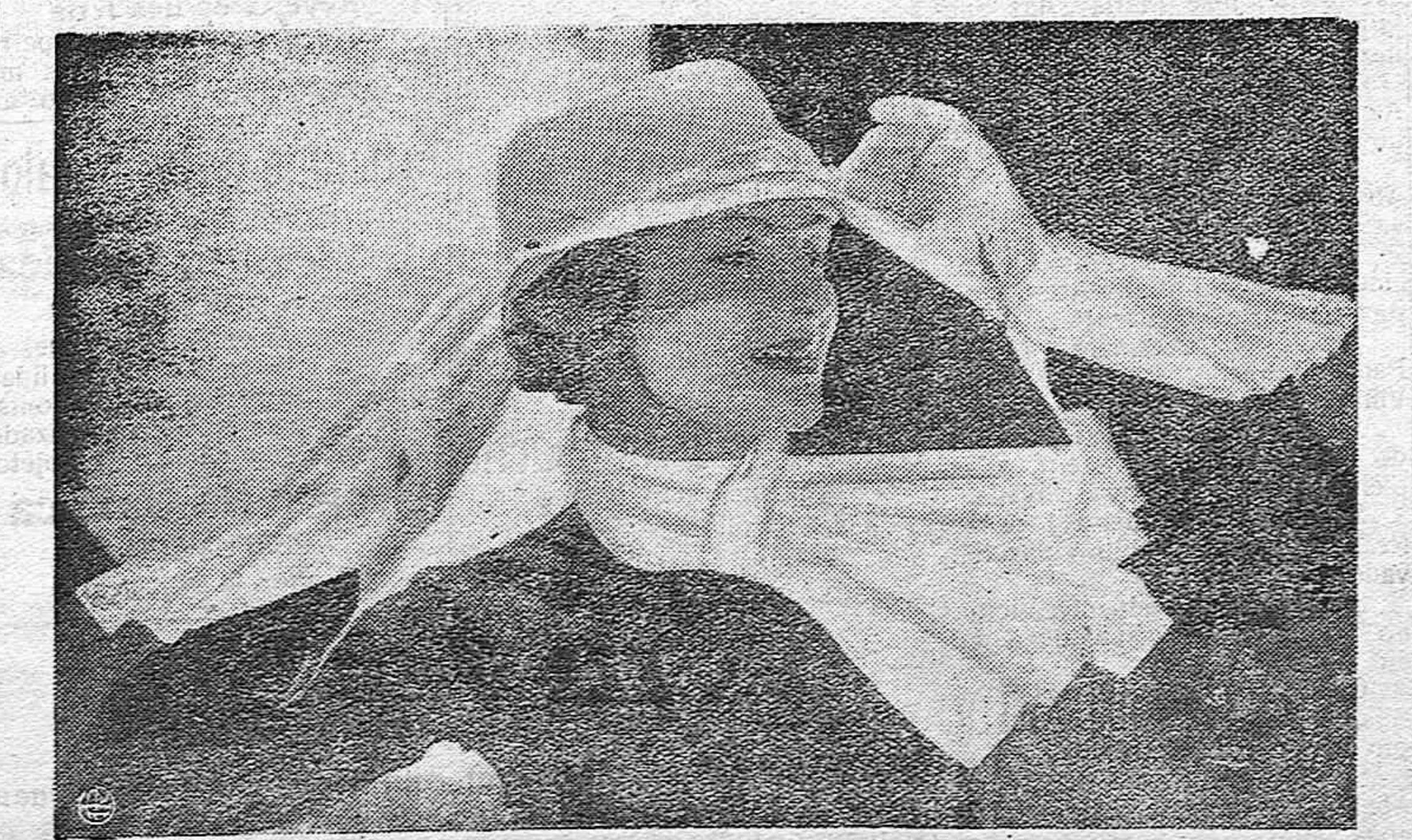
Canotier ligero en piqué blanco. La copa alta y un poco cuadrada. Rodeandola, una cinta de la misma tela rizada por delante y adornada con un motivo de cristal. Con estos sombreros, armonizan muy bellamente las corbatas blancas formando ojal por el que pasan los pliegues. Modelo de guantes terminados por altas manoplas encañonadas con tenaza, también de piqué blanco.