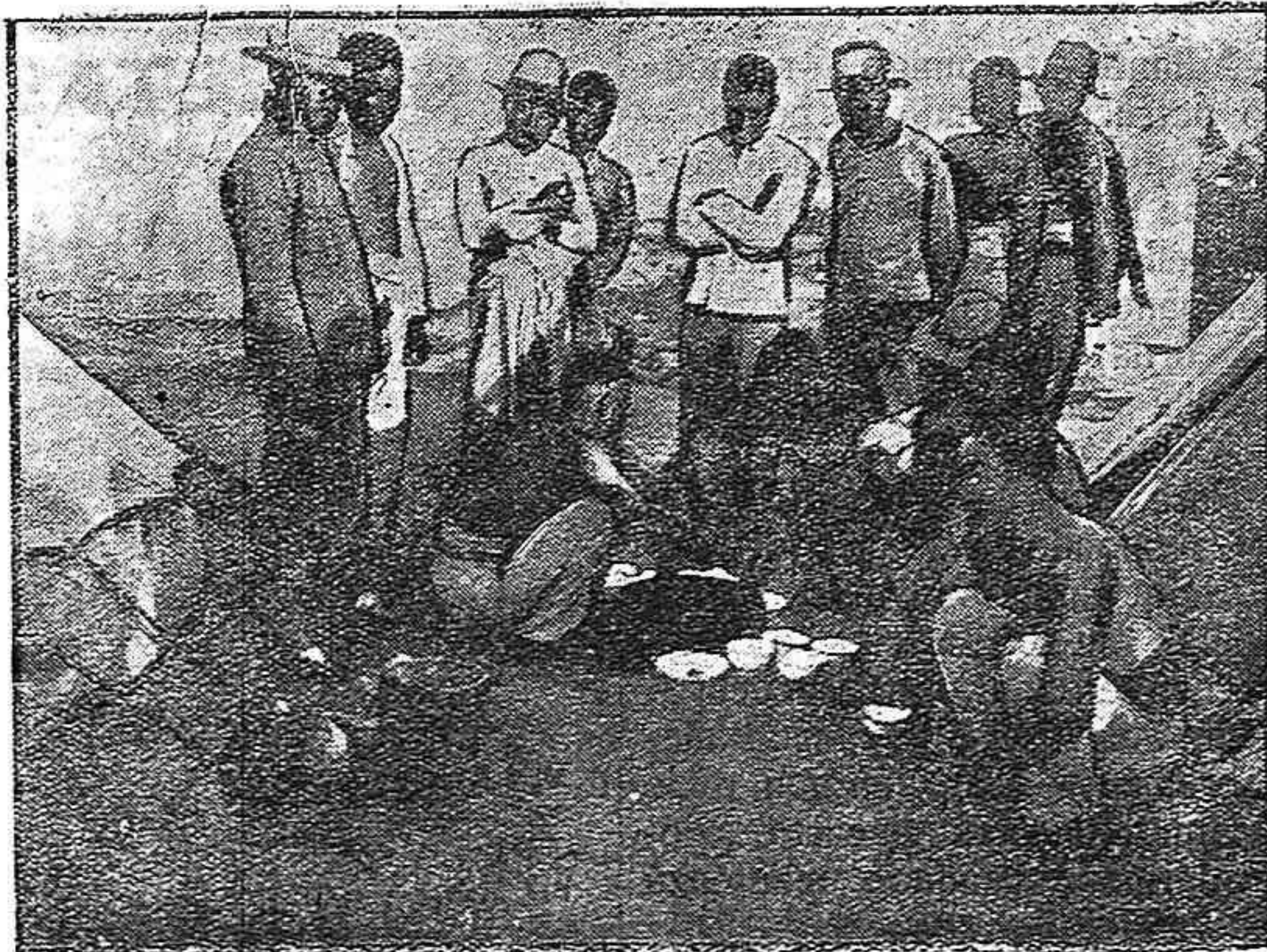
Cuerpo expedicionario francés en el Asia menor. Trabajadores chinos.

La que se dará por muy honrada y favorecida es la Guardia civil, y esta prueba de aprecio será y germinará en corazones que son los más agradecidos porque son también los más humildes y heroicos. Los hijos de Ahumada se encontrarán orgullosos y sentirán crecer, si