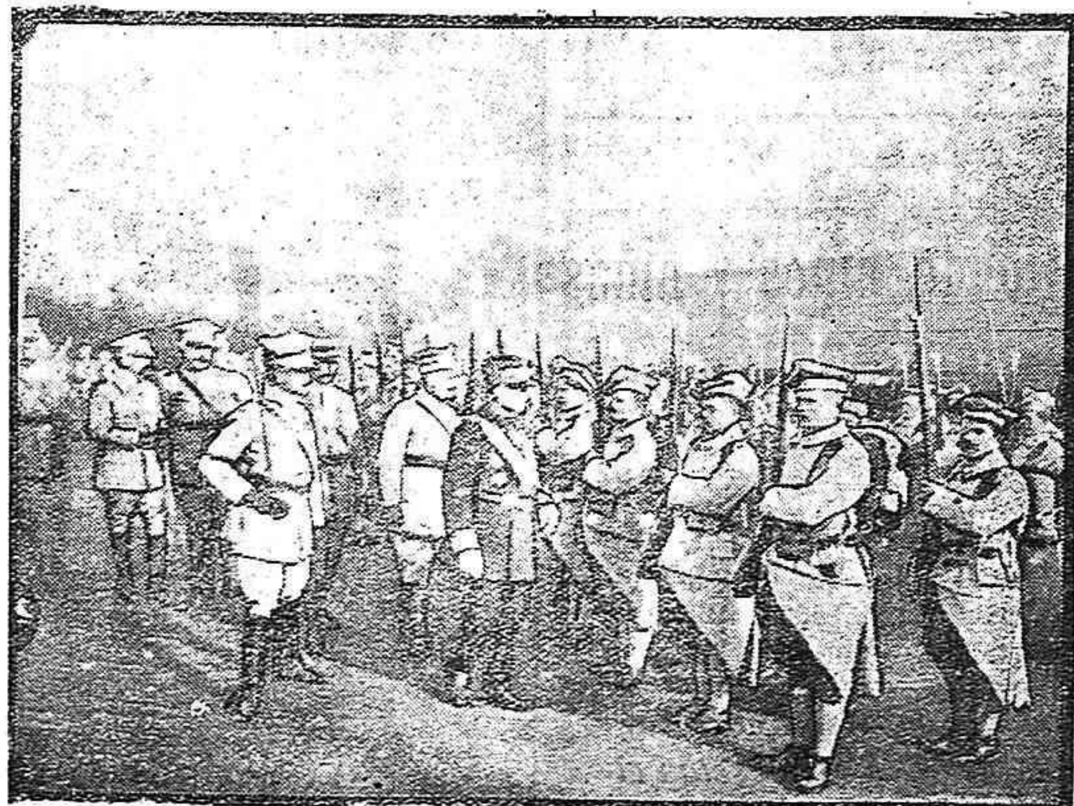
General francés revisando la Legión polonesa