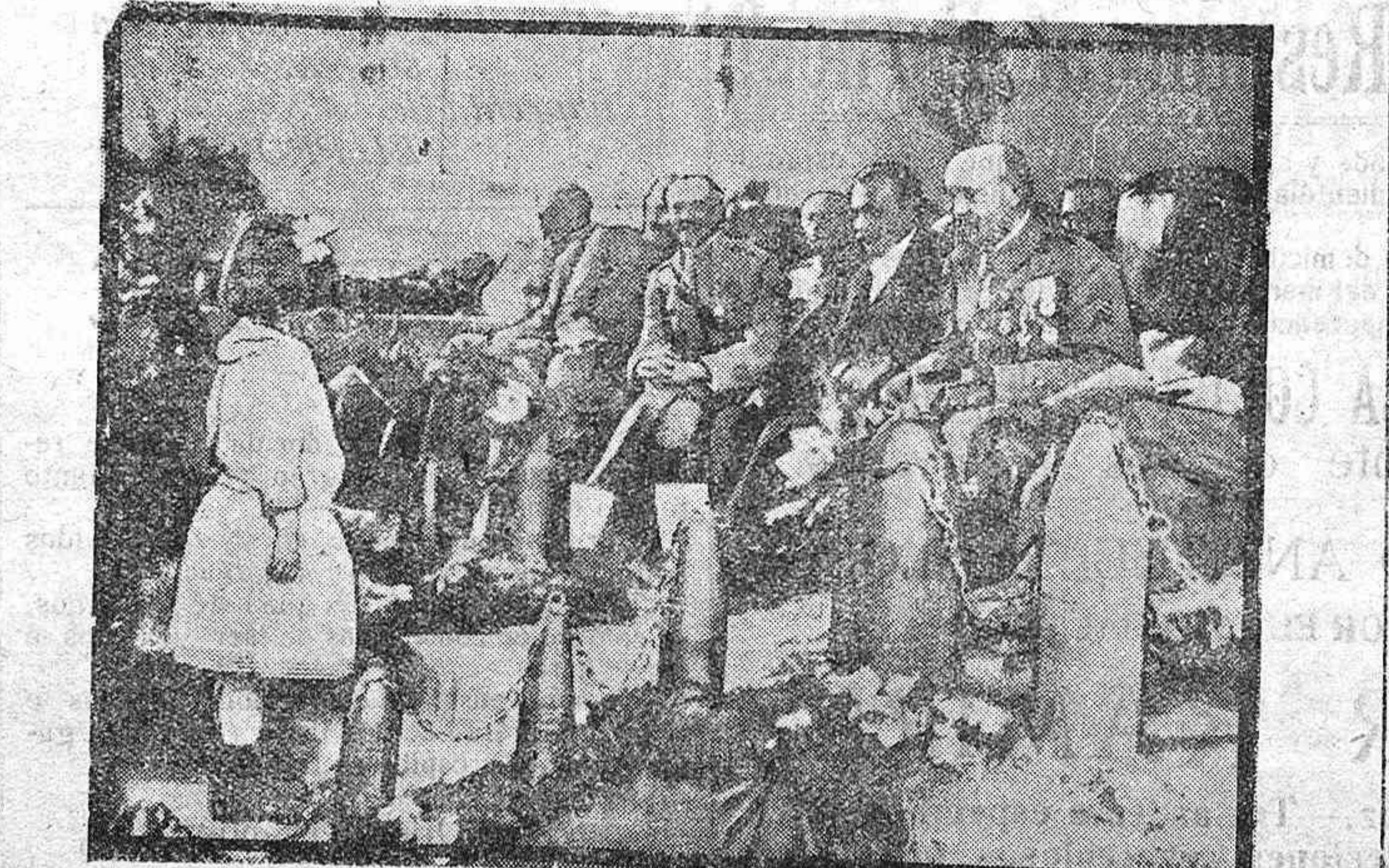
Distribución de premios en Alsacia