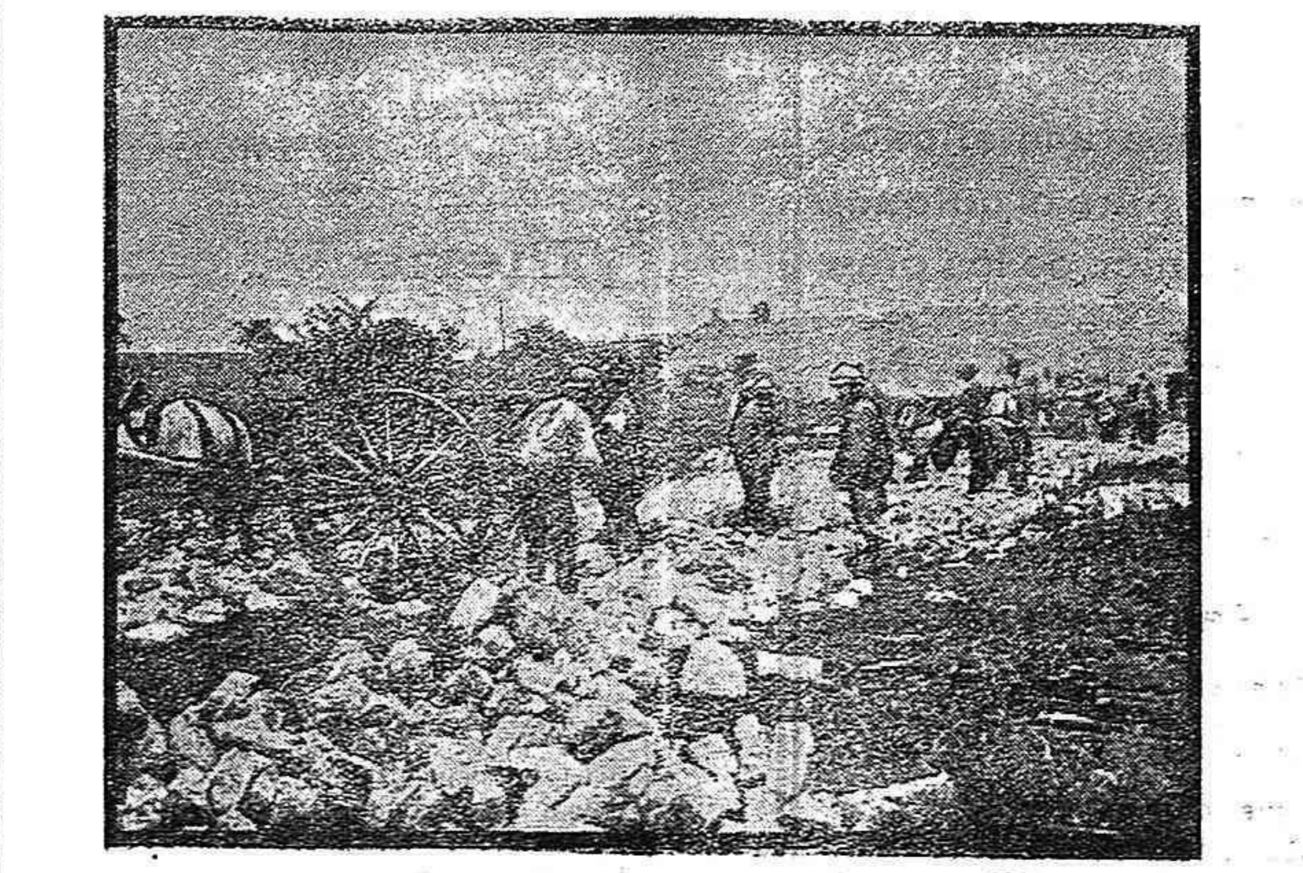
Arreglando un camino