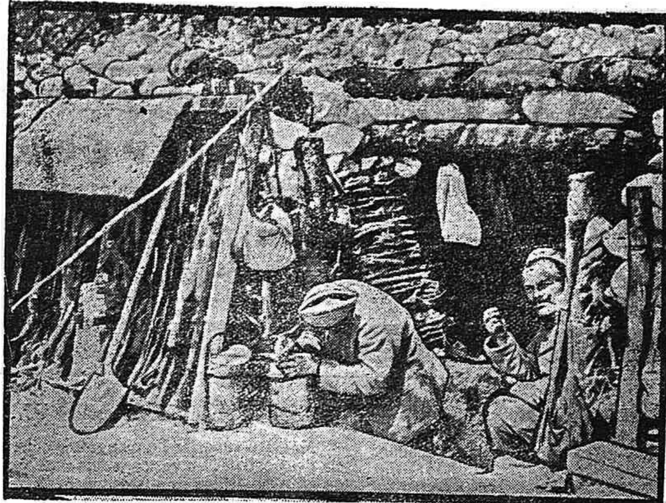
Zuavos a la entrada de un abrigo

Los aviones alemanes bombardearon la región de Geragera ayer. Nuestros aparatos hiciéronles frente derribando a once de los enemigos. Noticias alemanas. Dicen los últimos partes oficiales de Berlín: En Flandes atacaron los ingleses en una extensión de 15 kilómetros.