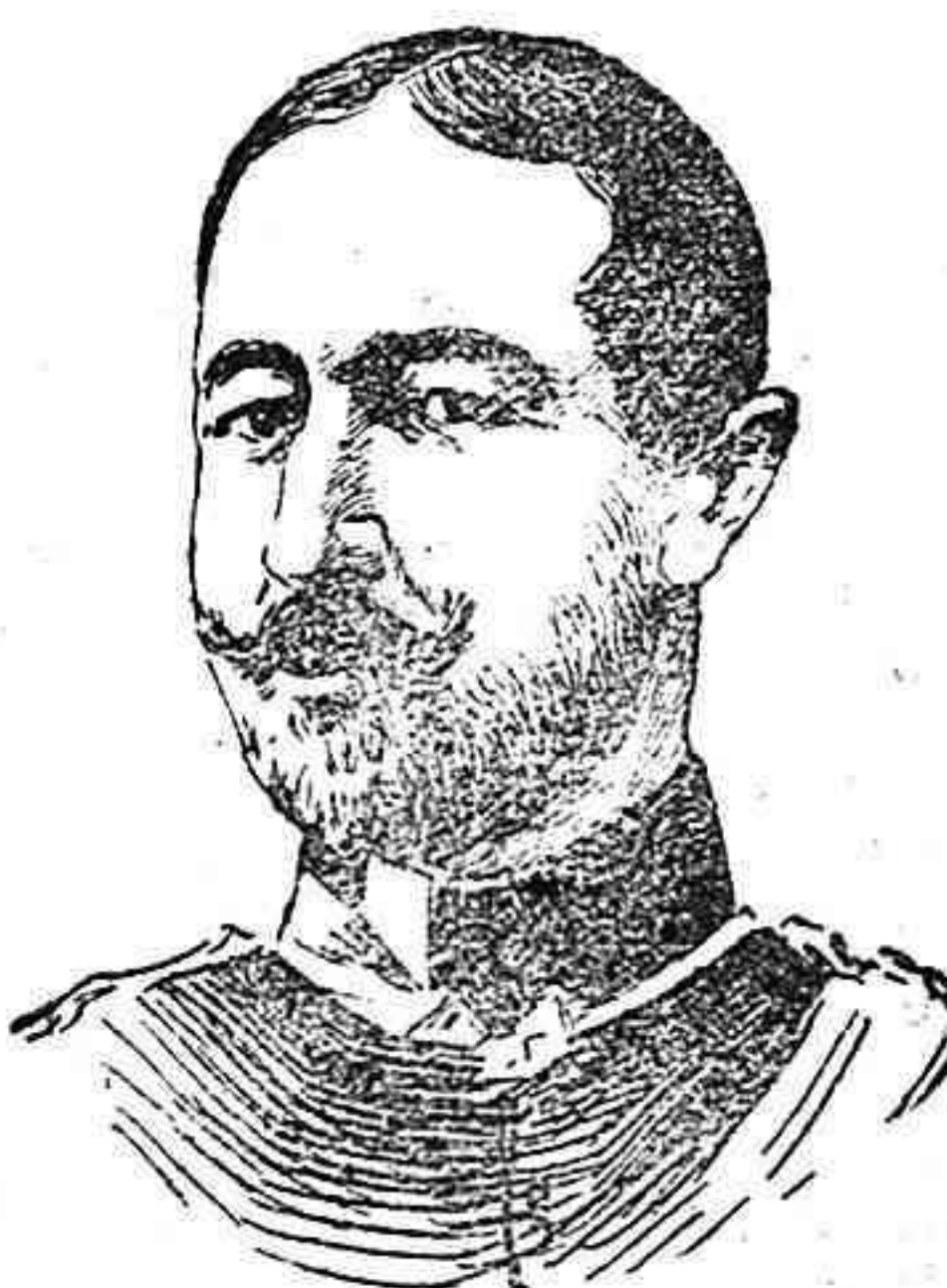
General AVERASCO, comandante del Ejército ruso-rumano de la Dobrudja