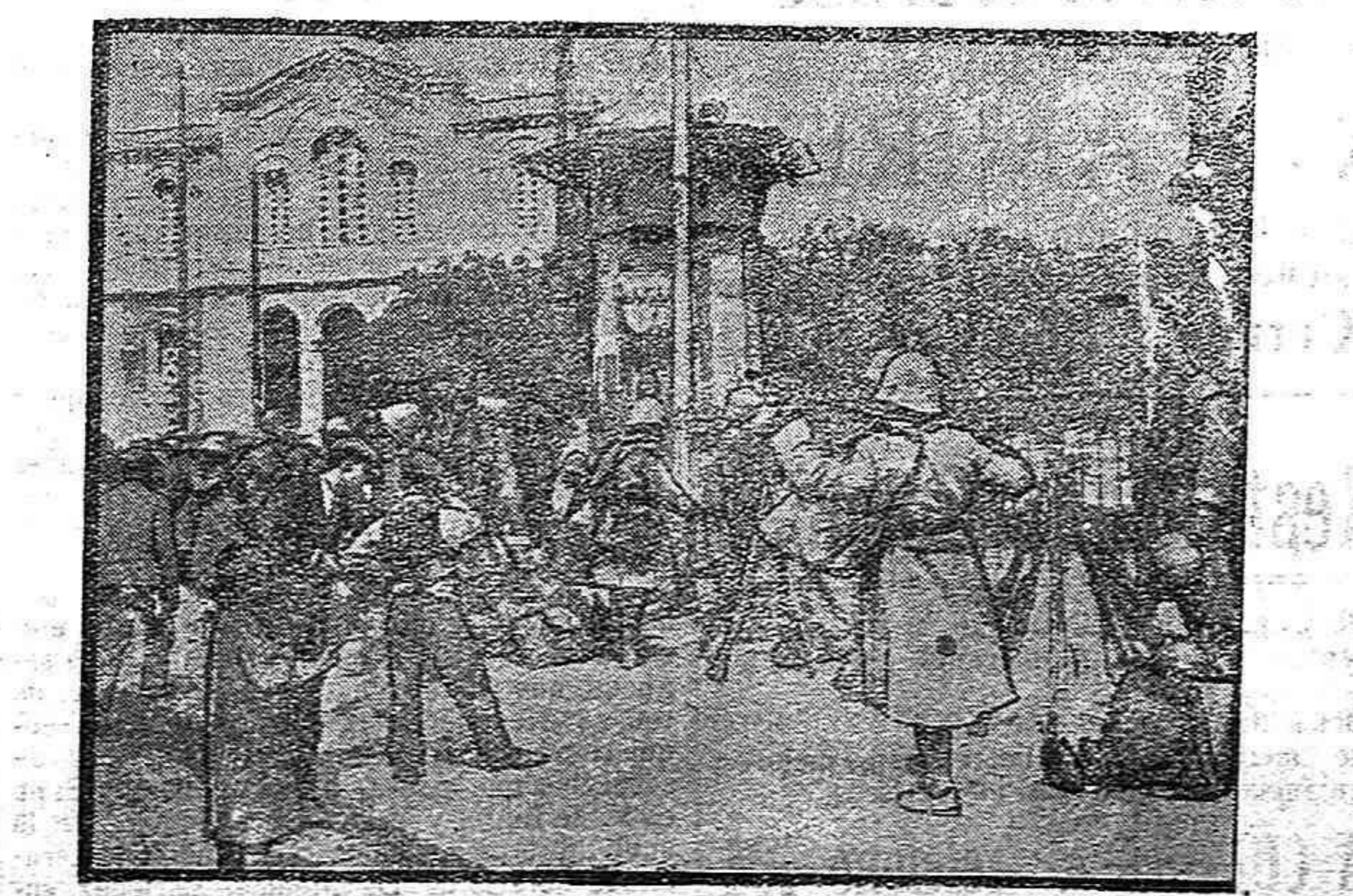
Las tropas francesas acampadas delante del jardín público

La Contaduría de fondos provinciales in-