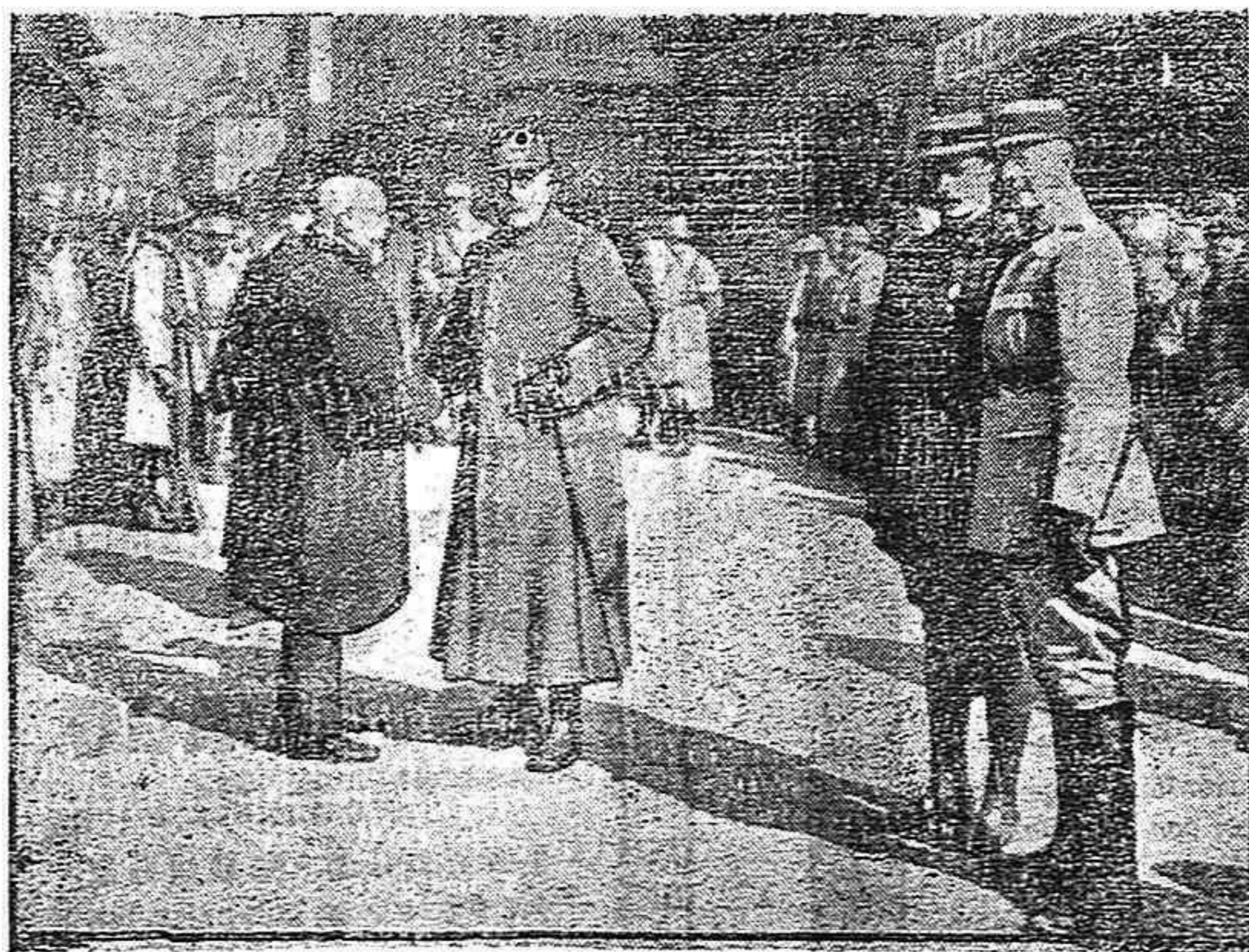
El generalísimo Nivelles en Noyon