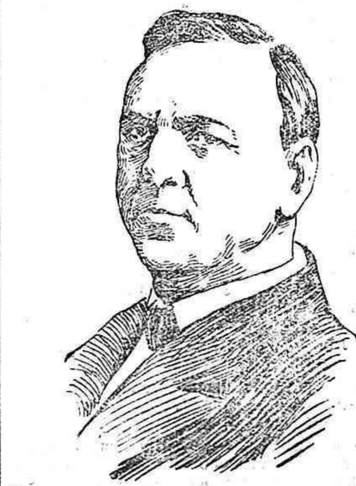
Mister JOSEPH DANIELS, secretario de Estado de la Marina de los Estados Unidos.