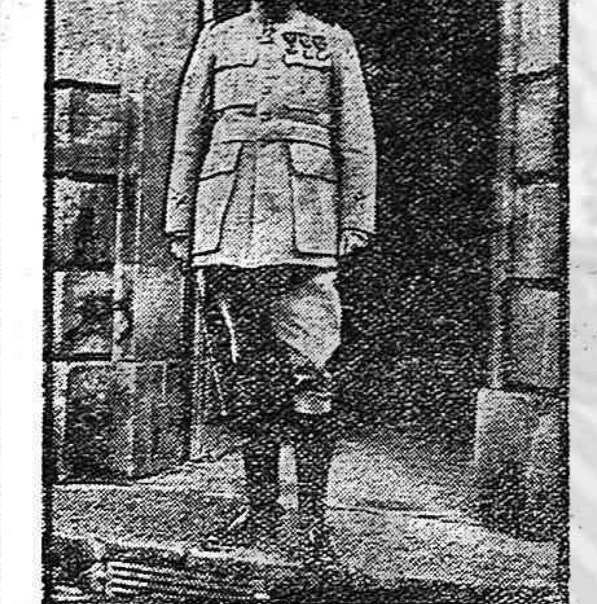
De la guerra.—El general Passaga

El telégrafo de la estación funciona con bastante irregularidad debido a que en muchos puntos hay postes que el fuerte viento dejó en mal estado.