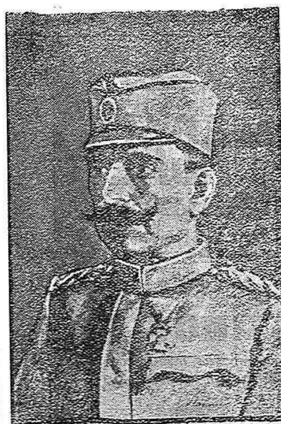
El general serbio Petar

Se inicia la idea de celebrar en todos los teatros de Galicia funciones a beneficio de dicha señora y sus hijas.