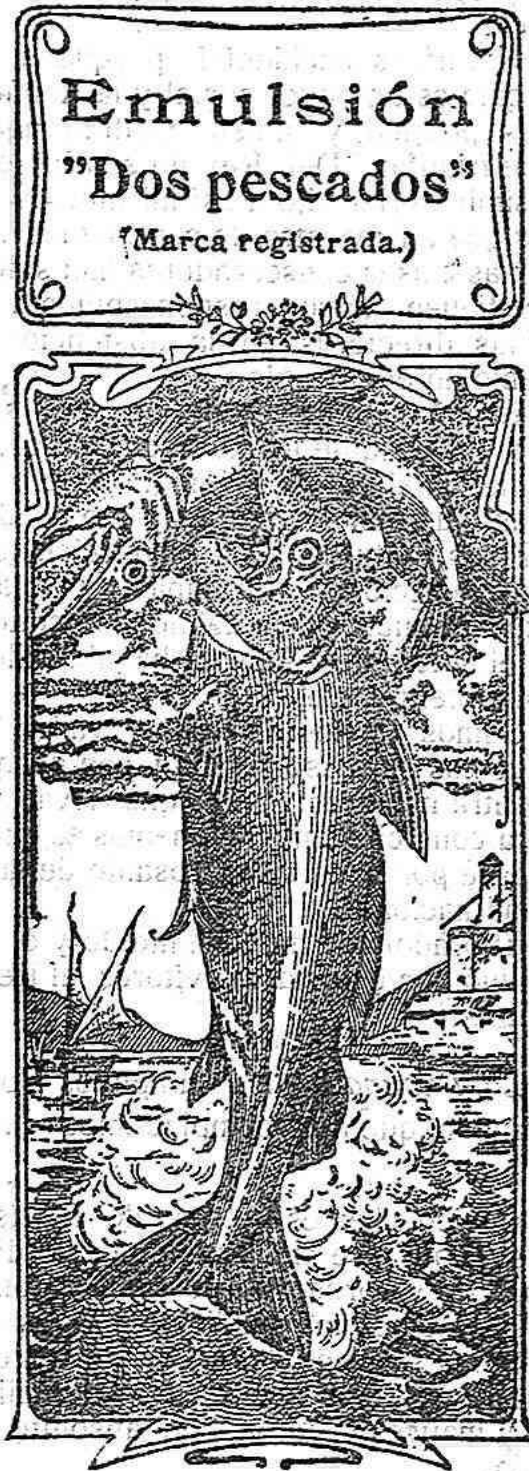
Emulsión "Dos pescados" (Marca registrada)

ARMAÑA, 3 Y 5, 2.º La última palabra Nos referimos a una nueva y excelente preparación de Emulsión «DOS PESCADOS» (marca registrada) la que compete con todas, las extranjeras y españolas, tanto en calidad como en precio. Depositarios: por menor, Farmacia y Laboratorio de Iglesias. Por mayor, Droguería de Iglesias y Compañía.