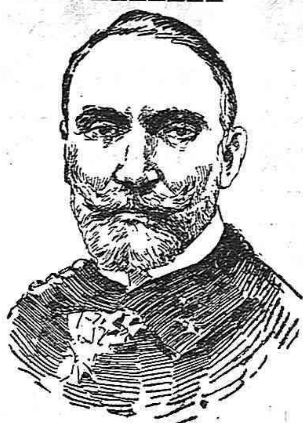
Almirante Camilo Corsi, nuevo ministro de Marina italiano