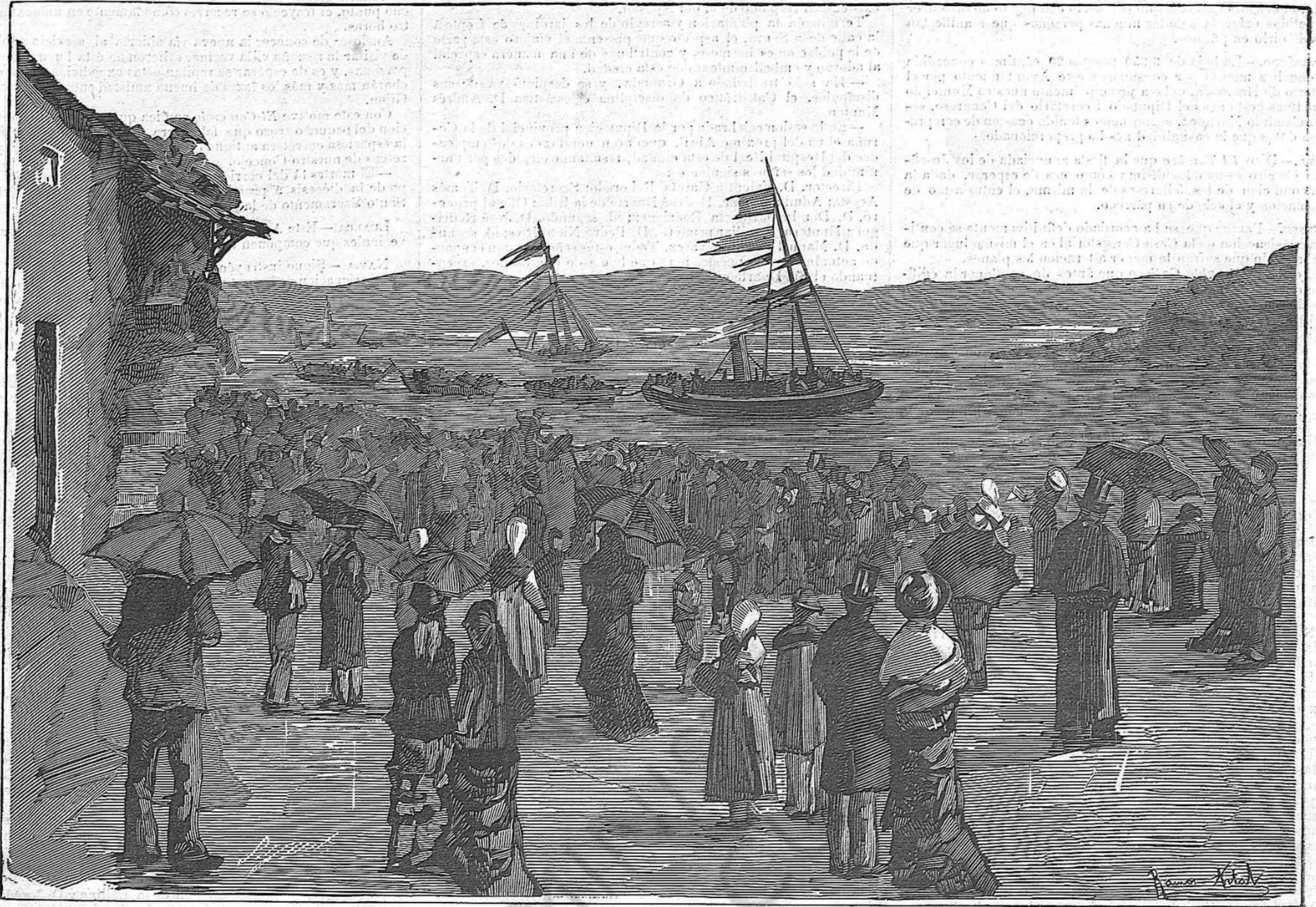
PONTEVEDRA: LLEGADA DE LOS EXPEDICIONARIOS DE VIGO AL MUELLE DE LAS CORBACEIRAS EL 25 DEL PASADO