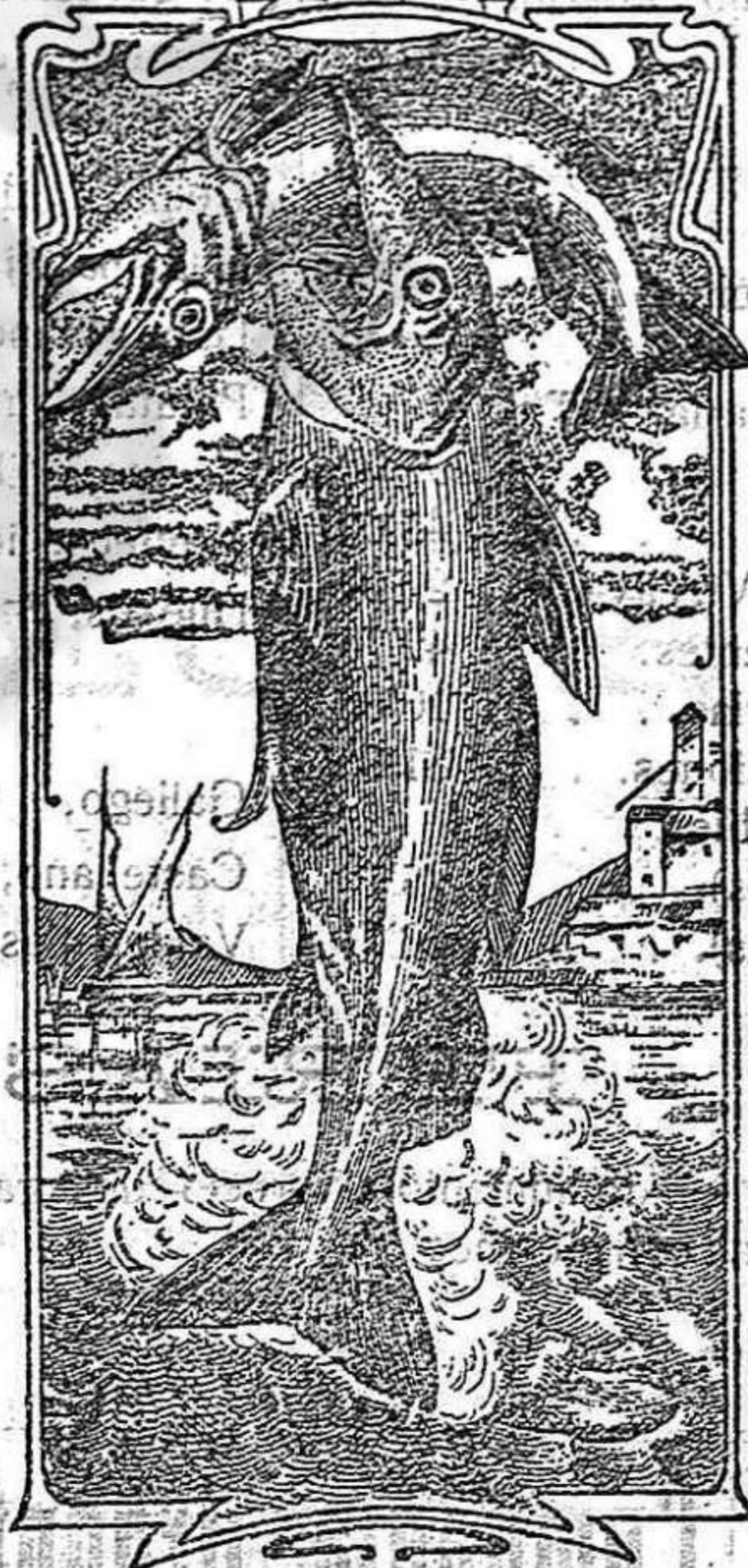
La última palabra

Nos referimos a una nueva y excelente preparación de Emulsión «DOS PESCADOS» (marca registrada) la que compete con todas las extranjeras y españolas, tanto en calidad como en precio.