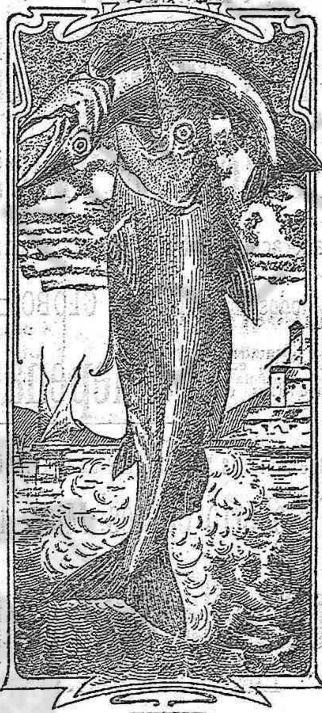
La última palabra

Emulsión "Dos pescados" (Marca registrada.)