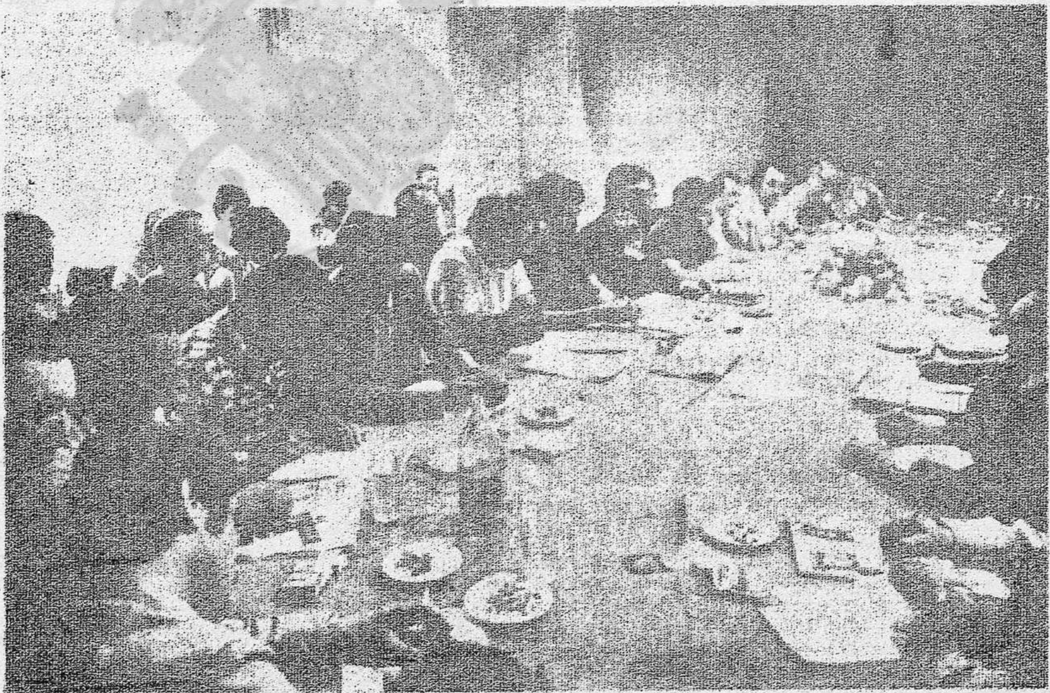
L'articulació Taula-Coordinació serà altre dels avenços decisius en el procés unitari

El trencament pactat no té tampoc res que veure amb la discussió respecte del pacte social. De "pacte social" no pot ni parlar-se en aquest moment: les lleis i institucions franquistes continuen en estaven. Es tracta d'arribar a un pacte polític per tal de reinstaurar les llibertats. Cap altra cosa pot negociar-se hui.