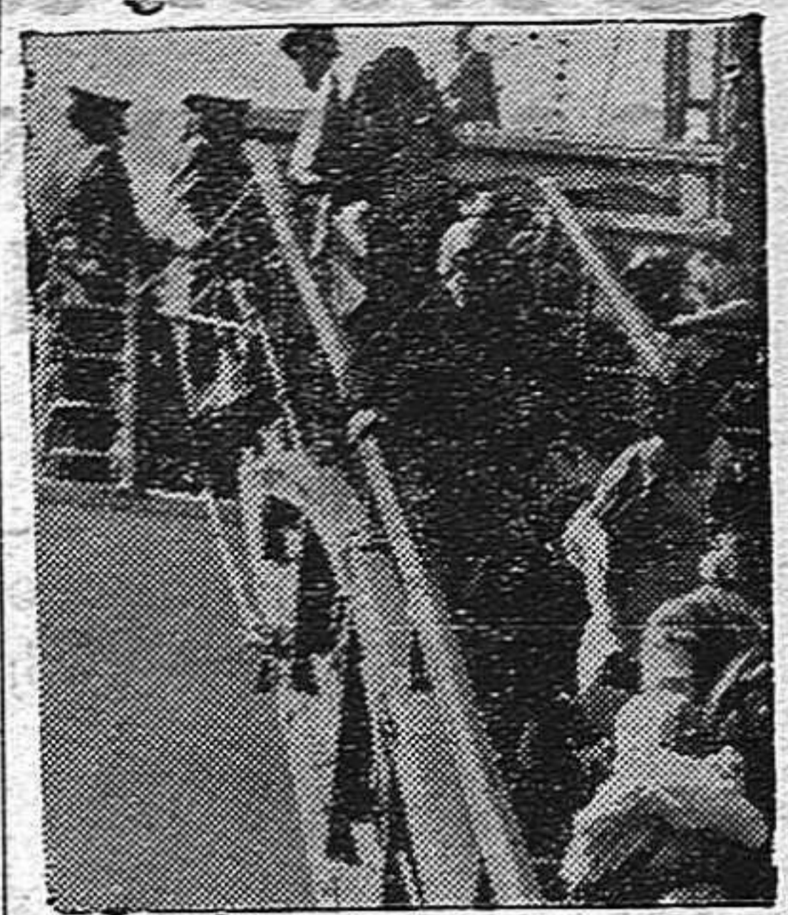
Refugiados españoles desembarcan en Chile

AÑO III Sábado 30 de Setiembre de 1939 N.º 124