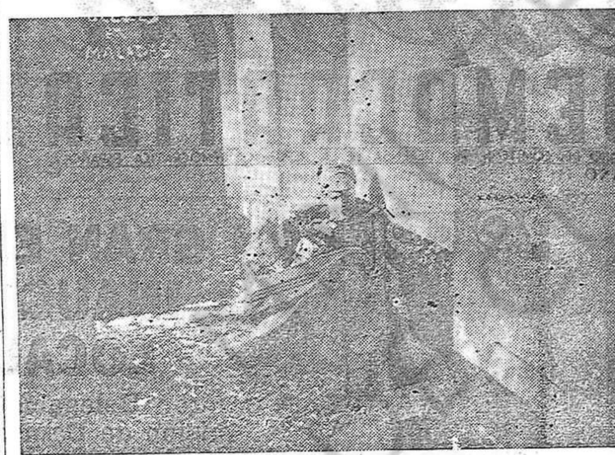
Un herido de guerra en el hospital Franco-Belga de Perpignan. Observe que tiene como abrigo un amontonamiento de paja y una manta. De esta manera, miles y miles de refugiados españoles están hacinados en los hospitales de sangre de los campos de concentración en Francia, sin tener la más elemental higiene y amenazados por tanto con una muerte segura.