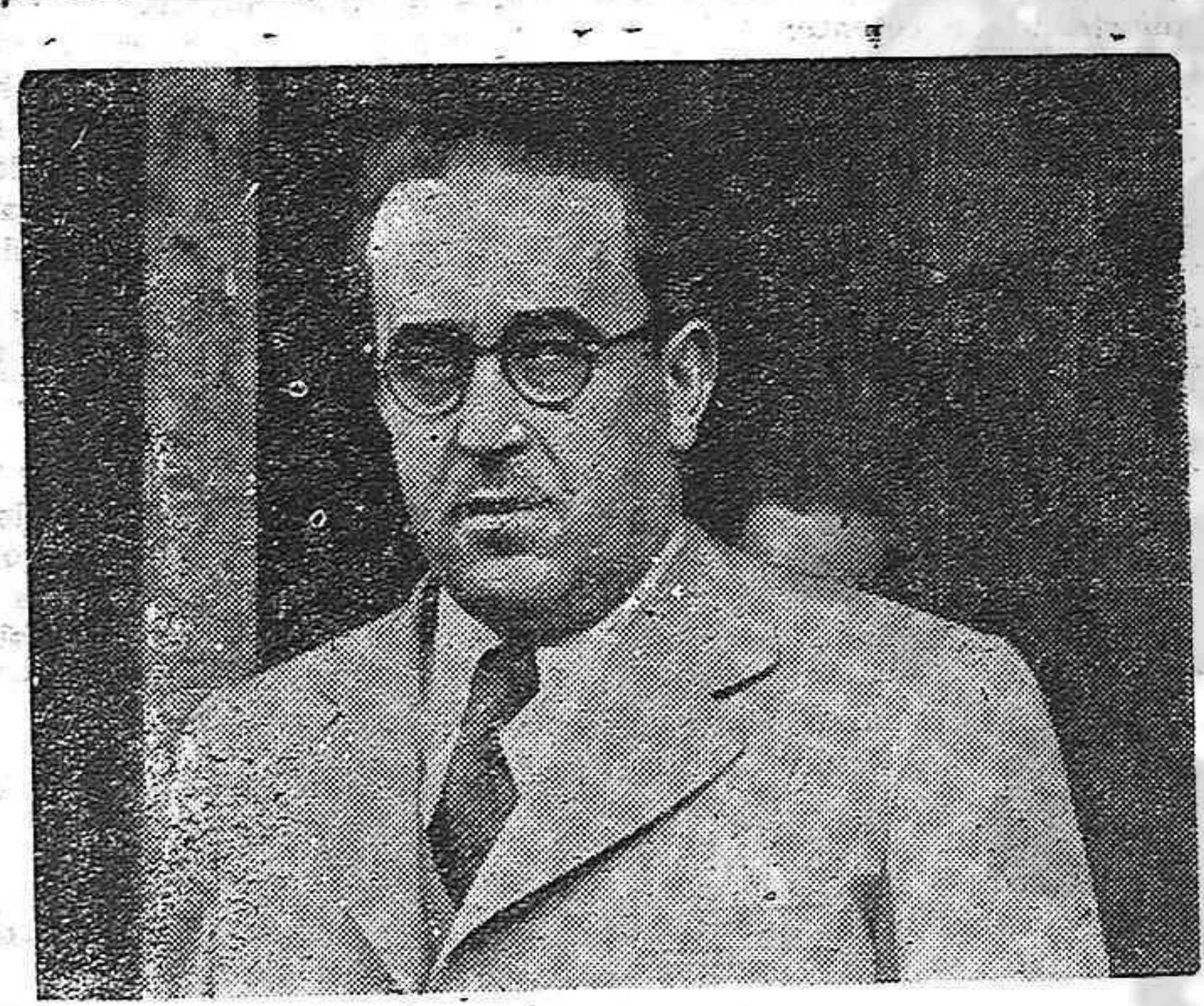
El General D. Vicente Rojo que en su reciente estada en Montevideo habló para "ESPAÑA DEMOCRÁTICA"