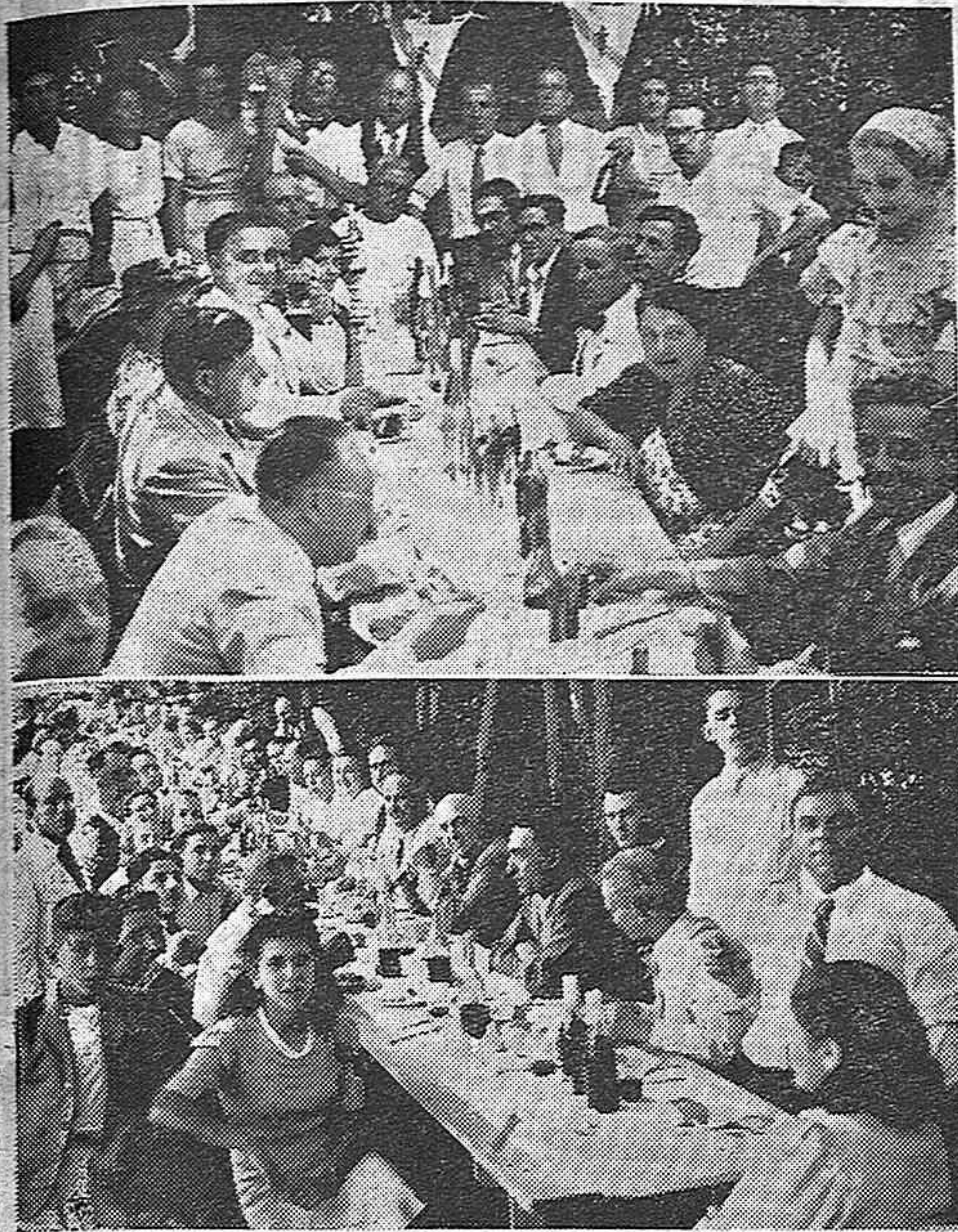
La Presidencia y un aspecto del Xantar que la Agrupación Cultural Republicana de Socios de Casa de Galicia celebró el domingo, obteniendo un gran éxito.