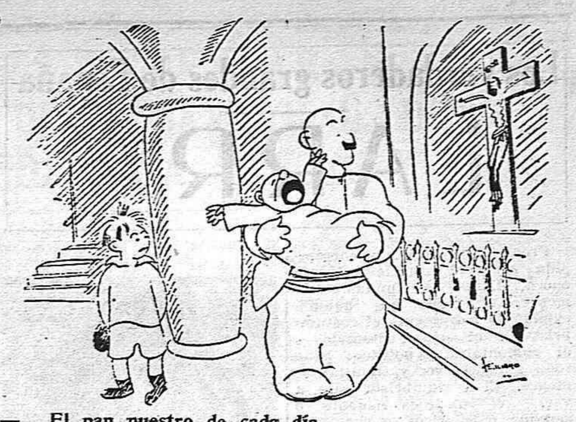
...El pan nuestro de cada día... —Vamos padre, no digas pavadas: ya sabes que no hay harina.