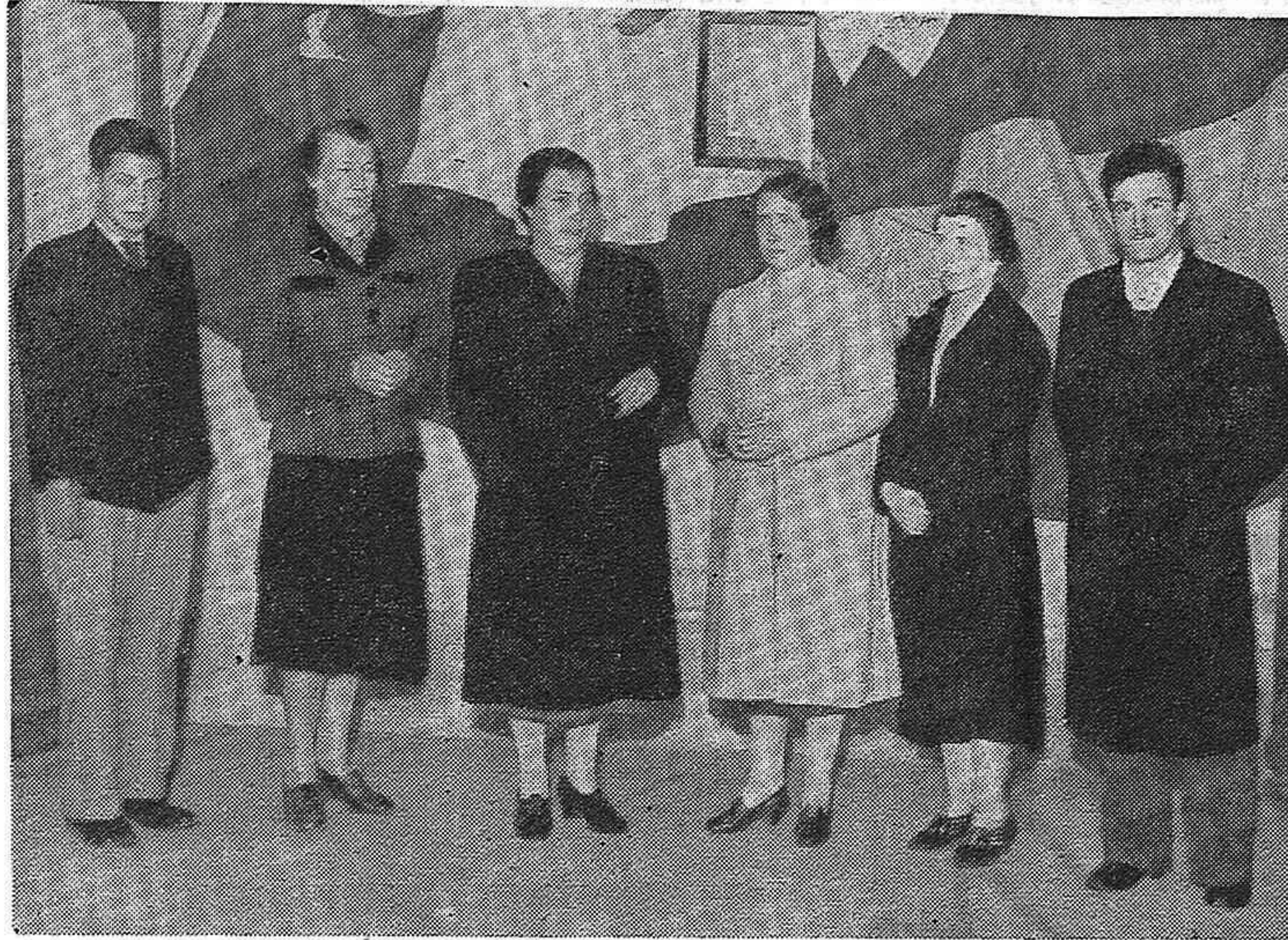
Autoridades de las entidades de ayuda al pueblo español de Paysandú, que fueron recibidas por el Presidente Baldomir en el tren presidencial, a su paso para Salto. Le pidieron la apertura de fronteras para los refugiados españoles.