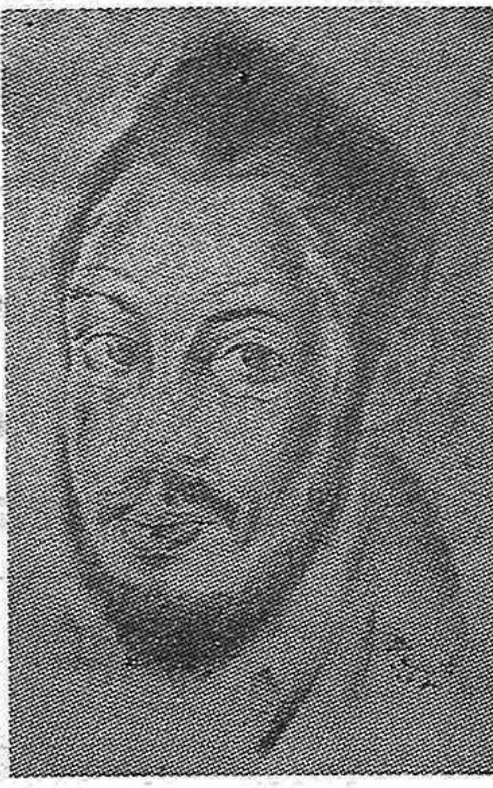
Mariano José de LARRA